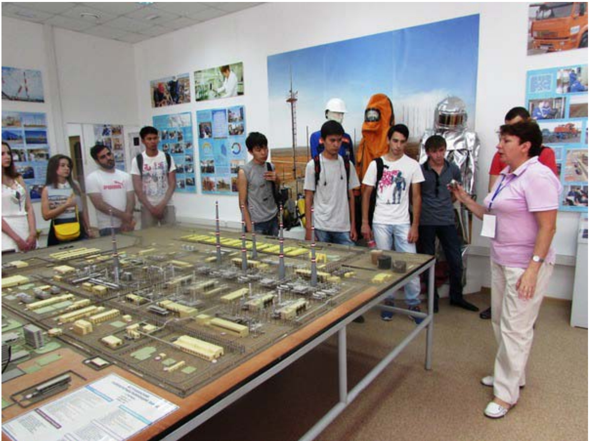
Увеличенная фотография (JPG, 848 КБ)

Первая половина июля по традиции проходит в корпоративном музее под знаком студенческой практики. В этом году более сотни студентов РГУ нефти и газа им. И.М.Губкина, Астраханского государственного технического университета, а также Южно-российского государственного политехнического университета им. М.И. Платова, Санкт-Петербургского государственного университета, Российской Академии народного хозяйства и государственной службы при Президенте РФ проходят производственную и ознакомительные практики на нашем предприятии. Их знакомство с компанией начинается в стенах корпоративного музея, где ребятам рассказывают об основных направлениях производственно-хозяйственной деятельности ООО «Газпром добыча Астрахань», его структурных подразделениях.