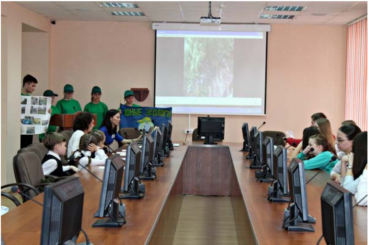
Увеличенная фотография (JPG, 671 КБ)