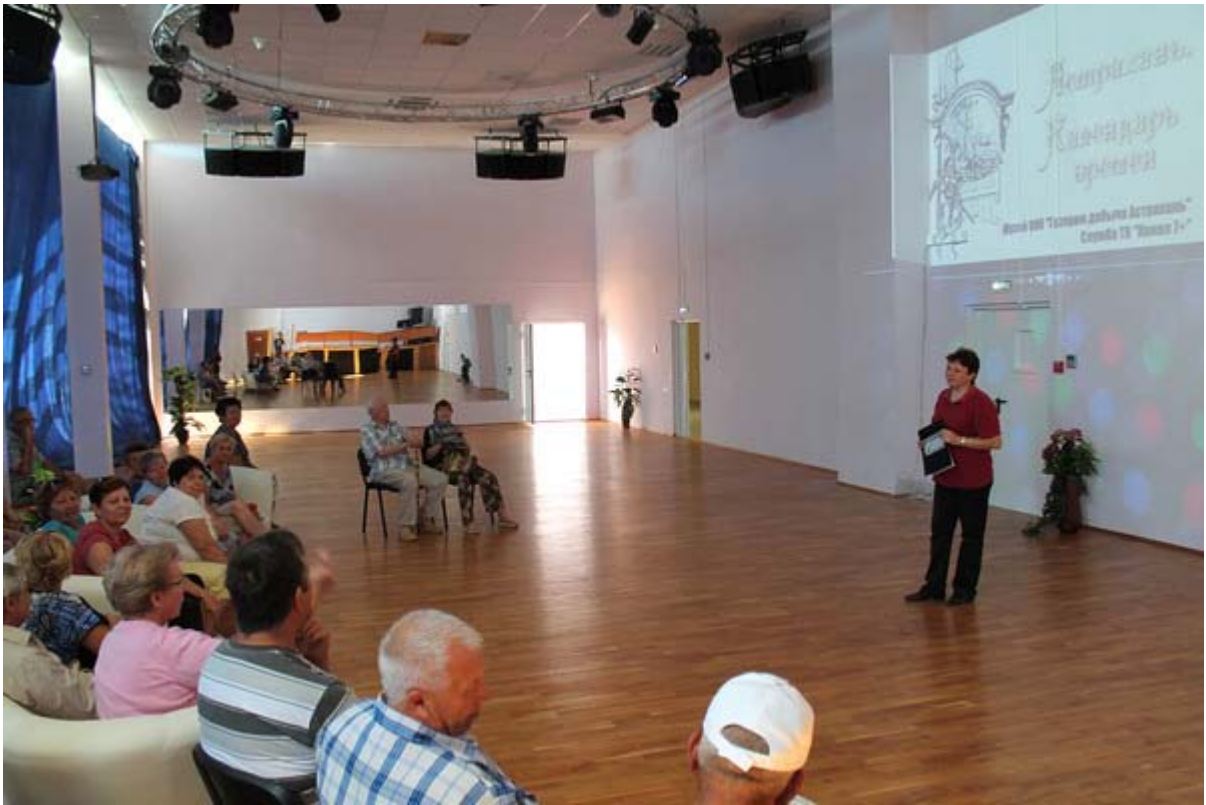
Увеличенная фотография (JPG, 648 КБ)

8 сентября в ОЦ им. А.С. Пушкина сотрудники музея ООО «Газпром добыча Астрахань» провели мероприятие для пенсионеров предприятия. «Календарь времен» — такова тема этой встречи, в ходе которой пенсионеры Общества познакомились с историей города Астрахани и вкладом родной компании в развитие Каспийской столицы.