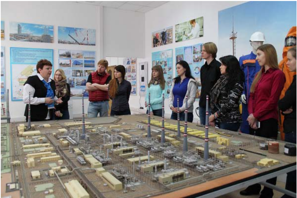
Увеличенная фотография (JPG, 677 КБ)

5 апреля Музей ООО «Газпром добыча Астрахань» посетила группа молодых работников ООО «НИИГазэкономика» в рамках ознакомительной экскурсии по объектам Общества. Корпоративный музей — первый этап знакомства с крупнейшим предприятием юга России в области добычи углеводородного сырья, впереди — поездка на АГПЗ и объекты ГПУ. «Благодарим сотрудников музея за тёплый приём и увлекательный экскурс в мир производства, добычи и переработки. Очень наглядно всё продемонстрировали», — поделились своими впечатлениями молодые специалисты.