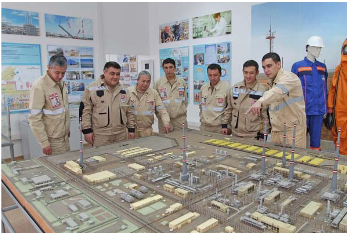
Увеличенная фотография (JPG, 959 КБ)

21 декабря с экспозицией Музея ООО «Газпром добыча Астрахань» познакомились будущие операторы Кандымского газоперерабатывающего комплекса ООО «ЛУКОЙЛ Узбекистан Оперейтинг Компани» — слушатели курса Учебно-производственного центра (УПЦ) ООО «Газпром добыча Астрахань». Им представилась возможность увидеть будущее место прохождения производственной практики с помощью макетов, схем и фотографий, представленных в экспозиции корпоративного музея. Особо впечатление произвел макет установки очистки газа от кислых компонентов, на которой узбекским специалистам предстоит работать в будущем.