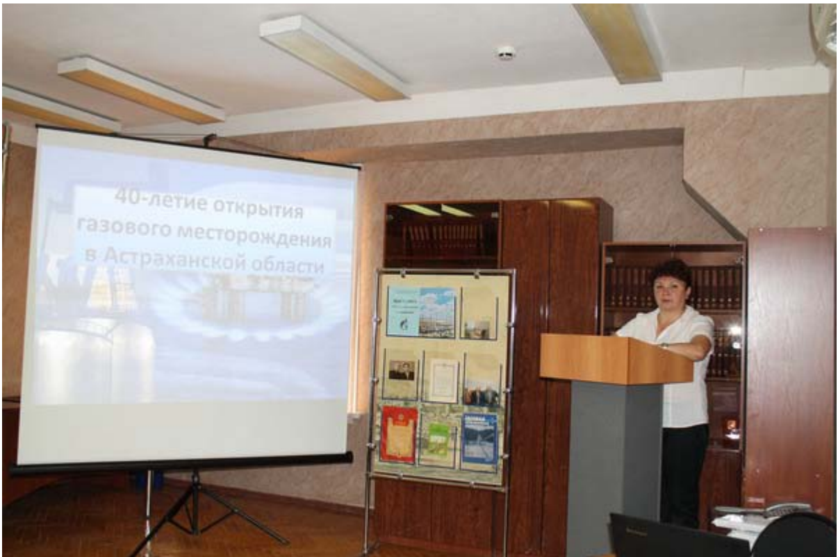
Увеличенная фотография (JPG, 488 КБ)

8 сентября в ОЦ им. А.С. Пушкина сотрудники музея ООО «Газпром добыча Астрахань» провели мероприятие для пенсионеров предприятия. «Календарь времен» — такова тема этой встречи, в ходе которой пенсионеры Общества познакомились с историей города Астрахани и вкладом родной компании в развитие Каспийской столицы.