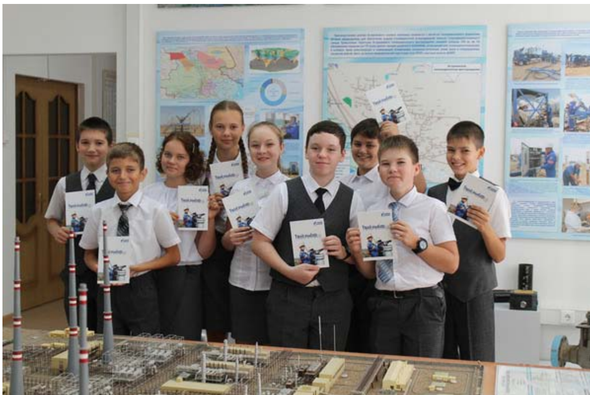
Увеличенная фотография (JPG, 695 КБ)

7 сентября в Государственном архиве современной документации Астраханской области (ГАСДАО) состоялась презентация виртуальной выставки документов и фотоматериалов, посвященной 40-летию открытия Астраханского газоконденсатного месторождения (АГКМ). В этом мероприятии приняли участие и сотрудники музея ООО «Газпром добыча Астрахань» с рассказом о первооткрывателях АГКМ, об истории его освоения и изучения. Среди выступающих были и непосредственные участники строительства Астраханского газового комплекса, а также люди, чья трудовая деятельность пересекалась с крупнейшим газовым предприятием региона. Каждый из них особо подчеркнул тот вклад, что сделали астраханские газовики в развитие Астраханской области, как в экономическом, так и в социальном плане.