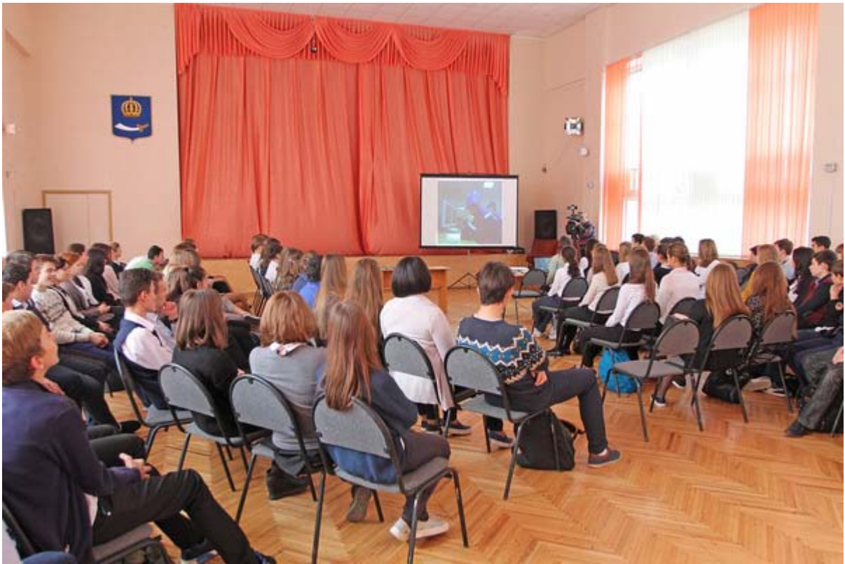
Увеличенная фотография (JPG, 821 КБ)

26 октября в лицее № 1 прошел необычный урок. Сотрудники музея ООО «Газпром добыча Астрахань» в партнерстве с отделом профессиональной ориентации Областного государственного казенного учреждения «Центр занятости населения г. Астрахани» провели совместное мероприятие. Коллеги из Центра занятости рассказали старшеклассникам о наиболее распространенных ошибках при выборе профессии, определили существенные критерии будущего выбора. Сотрудники Музея ООО «Газпром добыча Астрахань» познакомили учащихся выпускных классов лицея с особенностями производственно-хозяйственной деятельности Общества и наиболее востребованными профессиями предприятия.