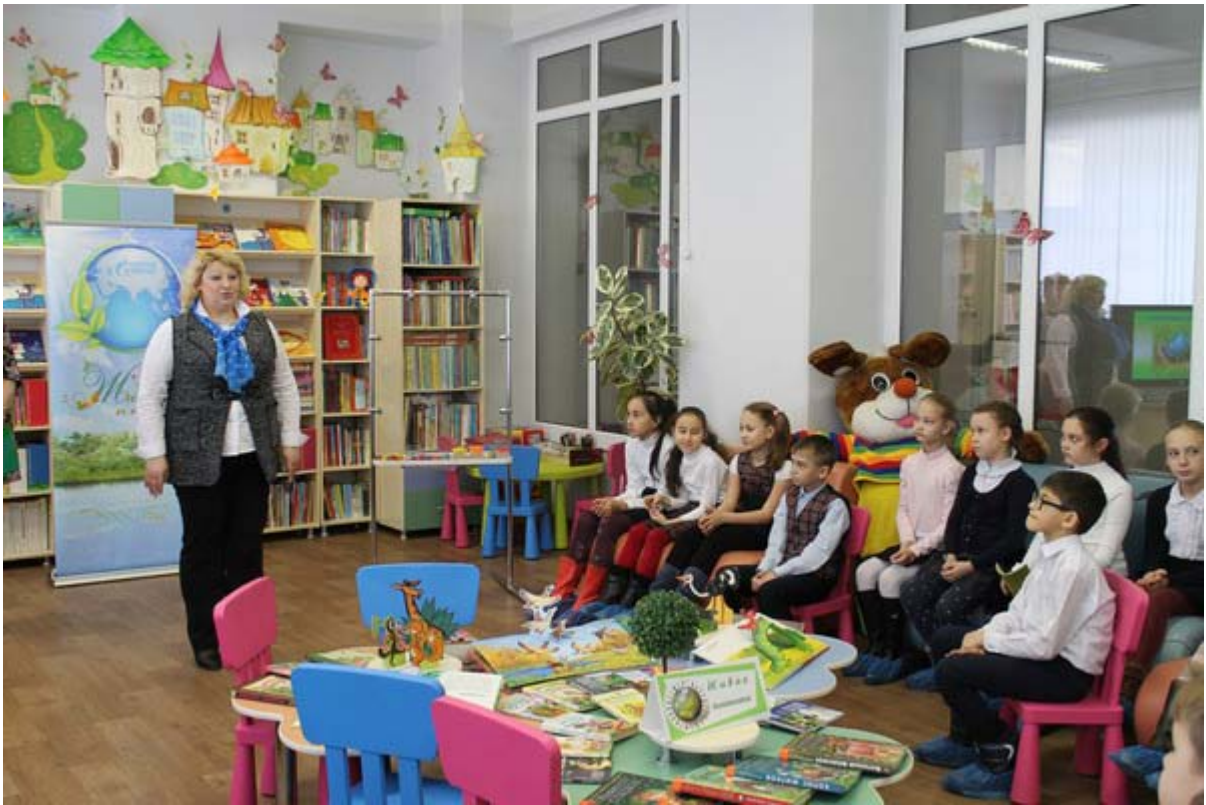
Увеличенная фотография (JPG, 673 КБ)

12 февраля музей ООО «Газпром добыча Астрахань» совместно с Областной детской библиотекой организовал очередное мероприятие проекта «Живая планета». На этот раз учащиеся НОШ № 19 познакомились с известными писателями-натуралистами, узнали много нового о книгах, рассказывающих о мире животных и растений. Сотрудники детской библиотеки показали ребятам самые разнообразные, и даже уникальные книги, хранящиеся в их собрании в единственном экземпляре. Школьникам предложили побывать в роли следопытов, артистов и художников и они с удовольствием угадывали животных по следам и импровизированным пантомимам, а также «вырастили» коллективное дерево. Интересная экскурсия по библиотечным залам никого не оставила равнодушным и участники проекта «Живая планета» выразили общее желание прийти в библиотеку еще раз для того, чтобы стать ее постоянными читателями.