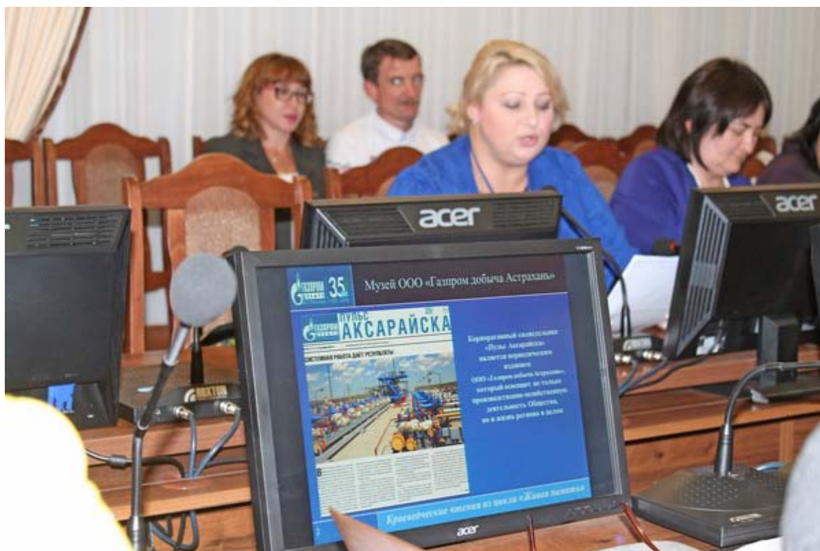
Увеличенная фотография (JPG, 699 КБ)