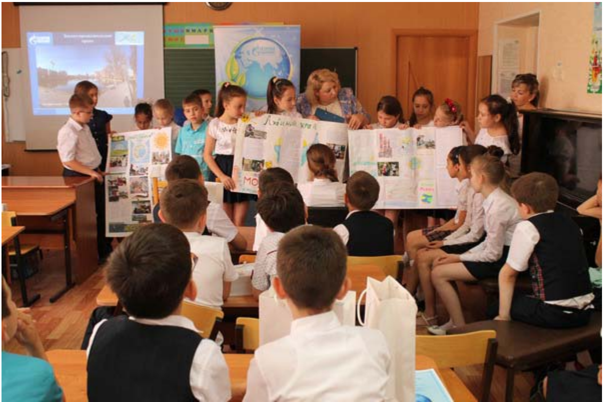
Увеличенная фотография (JPG, 570 КБ)

26 мая состоялось подведение итогов эколого-просветительского проекта «Живая планета». В течение учебного года его участники — учащиеся двух четвертых классов НОШ № 19 не только знакомились с компонентами окружающей среды и участвовали в познавательных мероприятиях, но и вели упорную борьбу во всевозможных конкурсах. Они писали сочинения, рисовали, фотографировали, делали стенгазету. Каждый класс-команда зарабатывал коллективные баллы, которые во многом определялись и индивидуальными зачетами. По результатам всех конкурсных заданий и работы в специально подготовленных к этому проекту тетрадях сотрудники корпоративного музея — разработчики и организаторы проекта «Живая планета» определили победителей. Первое место в напряженной экологической борьбе заняла команда «Экоспасатели» 4 «В» класса, всего один балл им уступила команда «Солнышки» 4 «А» класса.