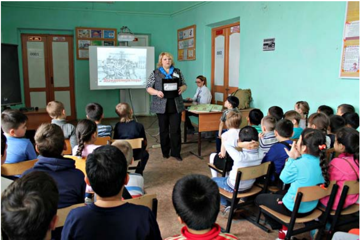
Увеличенная фотография (JPG, 696 КБ)