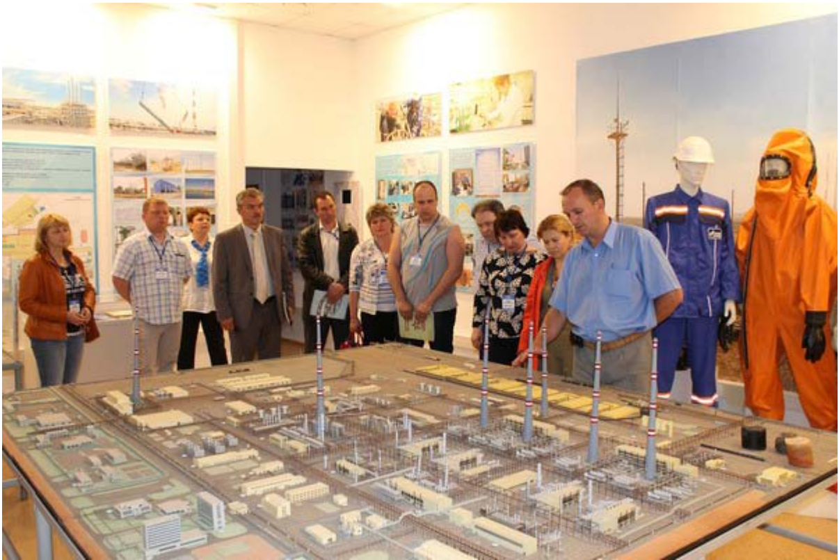
Увеличенная фотография (JPG, 750 КБ)

19 мая музей ООО «Газпром добыча Астрахань» посетили участники соревнований конкурса профессионального мастерства на звание Лучший по профессии», который проводил на своей базе Астраханский филиал «Газпром транс». Железнодорожники познакомились с историей Астраханского газового комплекса и перспективами его развития, посмотрели небольшой фильм по истории г. Астрахани. Макет 1-й очереди Астраханского газоперерабатывающего завода послужил объектом для демонстрации основных узлов железнодорожного хозяйства газового комплекса, экскурсию по которым провел представитель Астраханского филиала «Газпром транс».