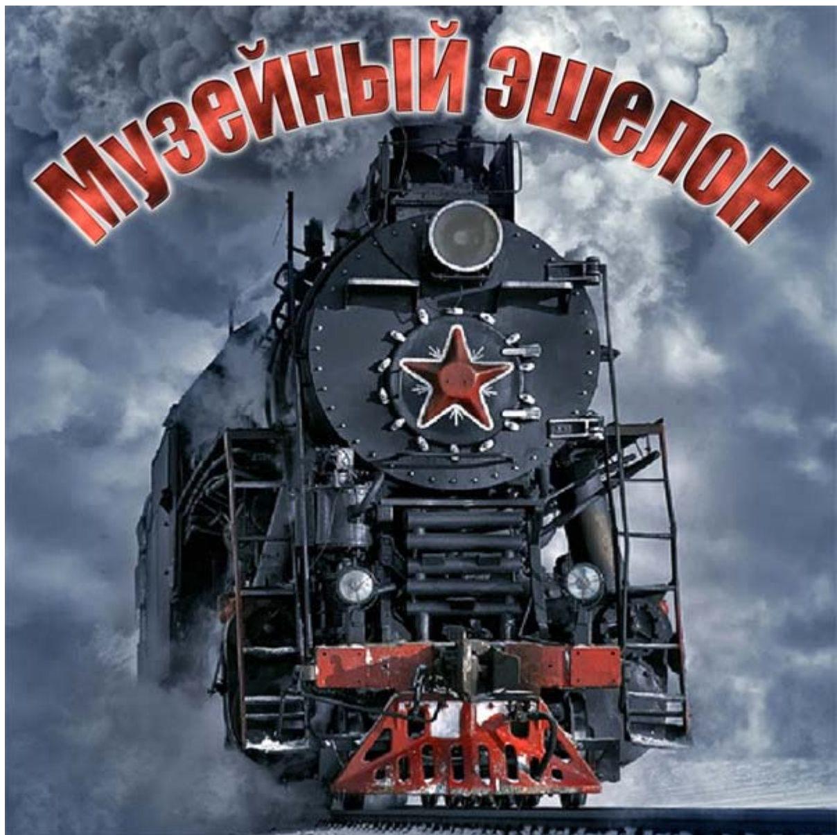
Увеличенная фотография (JPG, 485 КБ)

В канун Дня Защитника Отечества музей ООО «Газпром добыча Астрахань» приступил к реализации проекта по патриотическому воспитанию школьников. В течение февраля сотрудники корпоративного музея провели 29 патриотических мероприятий, в которых приняли участие 1 539 человек.