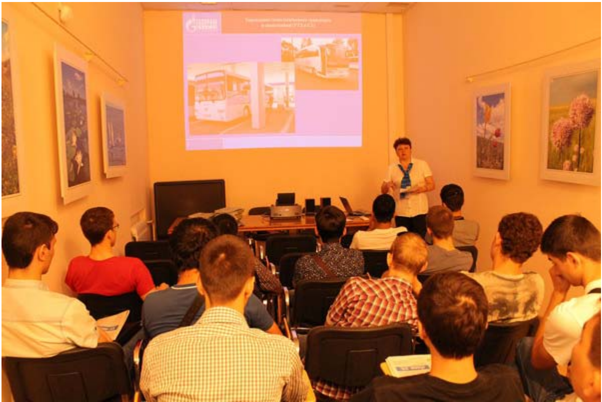
Увеличенная фотография (JPG, 594 КБ)

25 мая сотрудники музея ООО «Газпром добыча Астрахань» провели тематическое мероприятие для студентов второго курса Автомобильно-дорожного колледжа, обучающихся по специальности «Техническое обслуживание и ремонт автотранспорта». Кроме традиционной экскурсии, позволяющей дать общее представление о производственно-хозяйственной деятельности Общества, для ребят специально подготовили материал о производстве моторных топлив на АГПЗ и работе УТТ и СТ. Студенты познакомились со структурой транспортного подразделения Общества, узнали о работе системы «ГЛОНАСС», об автомобильных «новинках» предприятия.