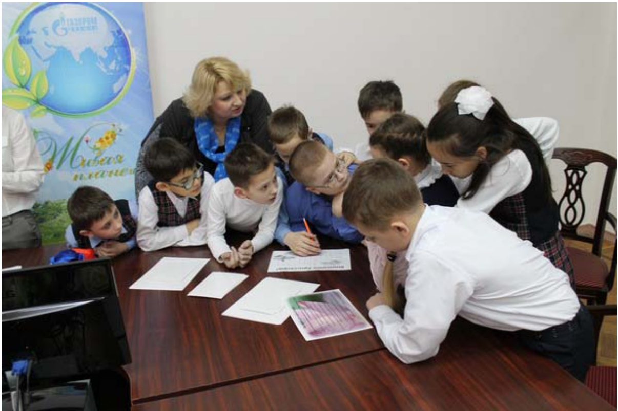
Увеличенная фотография (JPG, 474 КБ)

9 марта участники проекта «Живая планета» четвероклассники НОШ № 19 приняли участие в экологической викторине, которую сотрудники краеведческого музея подготовили в рамках эколого-просветительского проекта музея ООО «Газпром добыча Астрахань». Ребята отвечали на хитроумные вопросы, разгадывали кроссворды и играли в экологическое лото. В такой интерактивной форме школьников познакомили с особенностями жизни и повадками животных и птиц — обитателей природных ландшафтов Астраханской области.