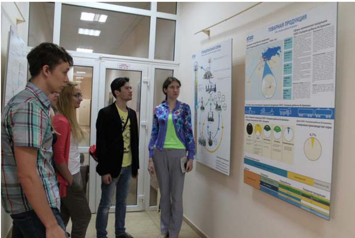
Увеличенная фотография (JPG, 551 КБ)

17 июня музей ООО «Газпром добыча Астрахань» посетила группа студентов 5 курса химического факультета МГУ, обучающихся по специальности «Фундаментальная и прикладная химия». В рамках освоения курса «Химическая технология» они проходят производственную практику на АГПЗ. Прежде всего, пятикурсники познакомились с экспозицией музея и выставками, а также посмотрели фильм по истории Астраханской губернии.