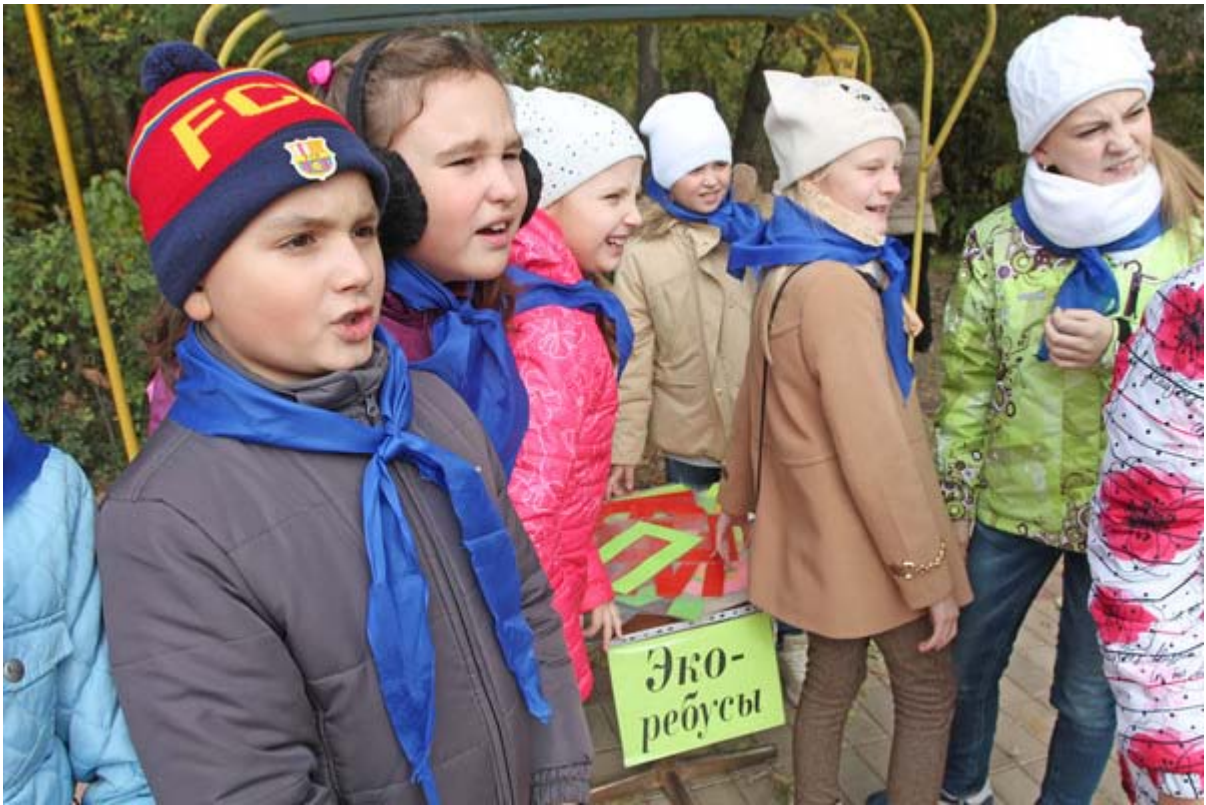
Увеличенная фотография (JPG, 814 КБ)

21 октября стартовал эколого-просветительский проект музея ООО «Газпром добыча Астрахань» «Живая планета». В этом учебном году он проходит на базе начальной школы Гимназии № 1. Ребята по традиции сформировали две команды и начали с экологического тим-билдинга, который для них организовал партнер корпоративных музейщиков — Эколого-биологический центр. Школьники прошли несколько станций, изготовили сувениры собственными руками и научились фильтровать воду. Помимо прочего, участники проекта собирали экологическую мозаику, отгадывали ребусы и отвечали на сложные вопросы викторин.