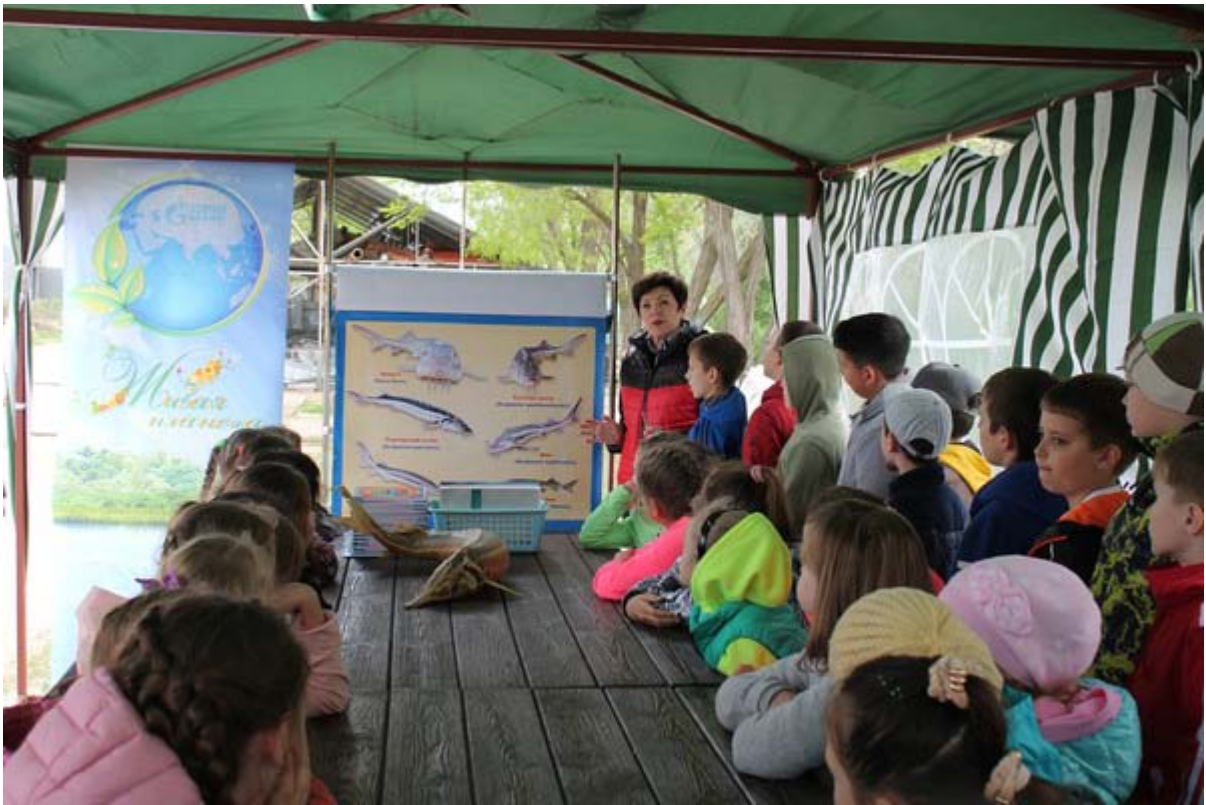
Увеличенная фотография (JPG, 687 КБ)

5 мая участники проекта «Живая планета» — четвероклассники НОШ № 19 посетили рыбноводное хозяйство, расположенное возле астраханского вододелиителя. Ребята познакомились с особенностями искусственного рыбноводства, историей осетровых и сложным процессом выращивания молоди рыб. Четвероклассникам продемонстрировали все этапы развития осетрового потомства, рассказали о значении производственного процесса, главная задача которого сохранить поголовье реликтовых обитателей Каспия и Волги. Школьники с интересом наблюдали за плавающими в садках белугами и осетрами и замершими в проточной воде щуками. «Я впервые на таком предприятии, — поделилась своими впечатлениями Бондаренко Олеся. — Здесь я узнала о том, как сложно вырастить осетра из икринки до взрослой рыбы. Нам показали несколько видов осетровых рыб, особенно понравились огромные белуги. Я таких никогда не видела». Экскурсия, организованная корпоративным музеем в сотрудничестве с одним из ведущих рыбноводных хозяйств области, понравилась и запомнилась всем — и детям, и педагогам, и родителям.