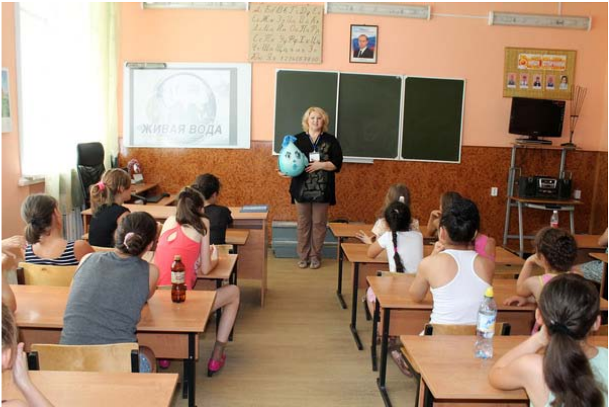
Увеличенная фотография (JPG, 719 КБ)

В течение всего июня сотрудники Музея ООО «Газпром добыча Астрахань» работали на летних площадках при школах города. Было проведено более 30 мероприятий, в которых приняло участие около двух тысяч учащихся из СОШ № 28, 56, 8, Гимназий № 1, 3, Лицея № 2 и др. Свои мероприятия корпоративные музейщики проводят и для отдыхающих в Детском оздоровительном центре им. А.С. Пушкина.