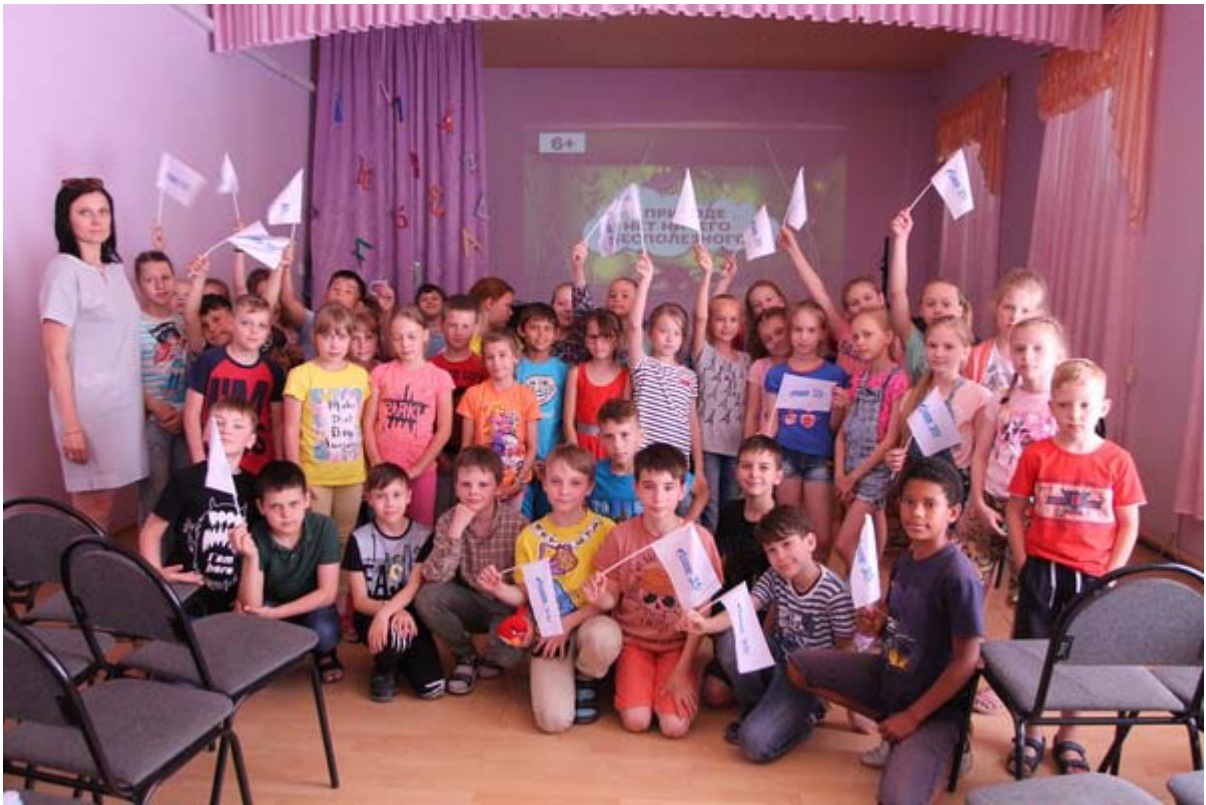
Увеличенная фотография (JPG, 706 КБ)

В июне сотрудники Музея ООО Газпром добыча Астрахань» начали проведение выездных мероприятий на летних школьных площадках города. В период летних каникул младшие школьники познакомятся с основами рационального природопользования, с экологическими проблемами региона, с работой газового предприятия.