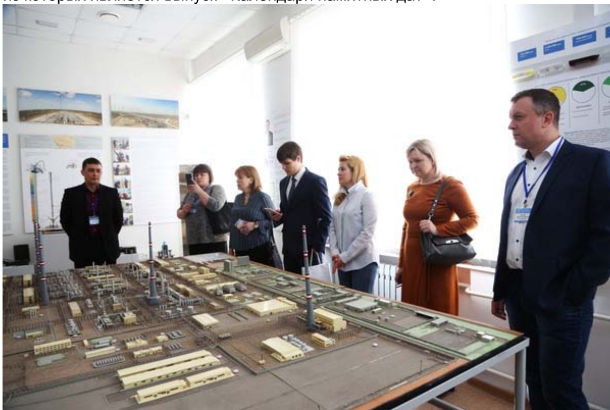
Увеличенная фотография (JPG, 623 КБ)

29 мая в Областной научной библиотеке имени Н.К.Крупской прошла конференция из цикла «Живая память». Тема, которая собрала краеведов на очередные чтения — «Главная библиотека региона: 180 лет на службе Отечеству». Участники конференции — представители органов власти, общественных организаций, учреждений культуры рассказали о роли областной научной библиотеки в жизни Астраханского региона. Музей ООО «Газпром добыча Астрахань» представил небольшое сообщение, посвященное совместным проектам главной областной библиотеки и газового предприятия, самым ярким из которых является выпуск «Календаря памятных дат».