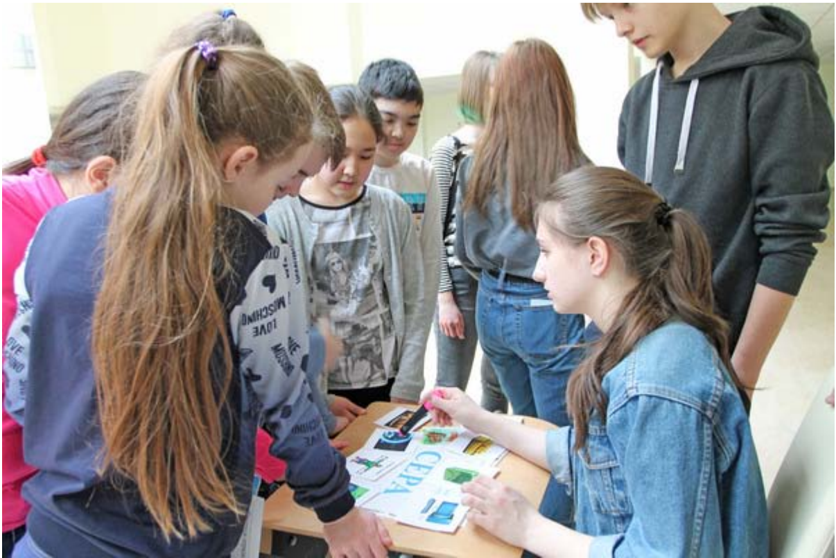
Увеличенная фотография (JPG, 790 КБ)

Три последних мартовских дня весенней смены в ОЦ имени А.С.Пушкина прошли с участием Музея ООО «Газпром добыча Астрахань», который организовал для школьников три познавательных мероприятия, рассказывающих о работе, товарной продукции и профессиях астраханских газовиков.