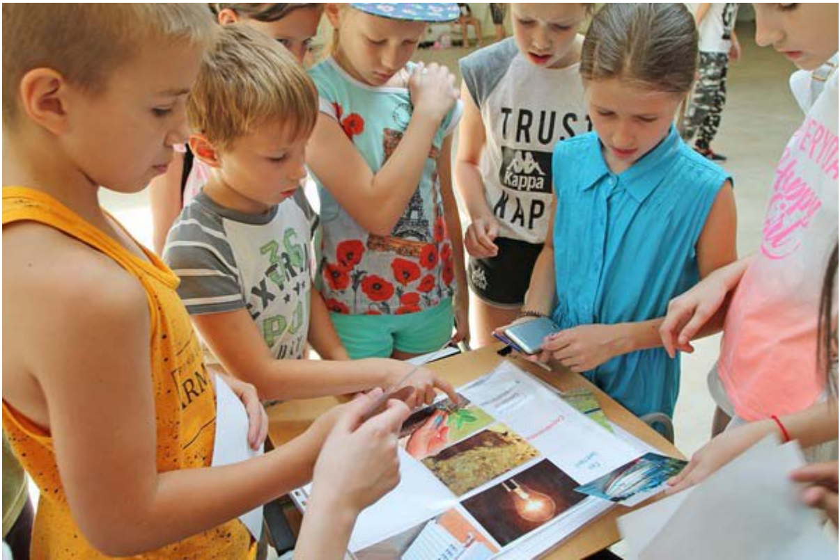
Увеличенная фотография (JPG, 608 КБ)

Летние каникулы в Оздоровительном центре имени А.С.Пушкина пройдут вместе с Музеем ООО «Газпром добыча Астрахань». Запланированы и уже проведены мероприятия из цикла «Путешествие в страну Газпромия», которые позволяют ребятам узнать о добыче и переработке сырья, природных условиях и особенностях Астраханского газоконденсатного месторождения. Для закрепления материала проводится викторина в форме квеста.