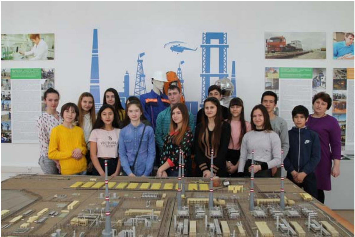
Увеличенная фотография (JPG, 654 КБ)

В марте Музей ООО «Газпром добыча Астрахань» принимал учащихся средних и старших классов Астраханской области. Школьники из Яксатова, Линейного и г. Нариманова познакомились с деятельностью крупнейшего газового предприятия региона и основными профессиями комплекса.