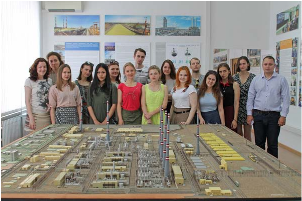
Увеличенная фотография (JPG, 952 КБ)

В июле Музей ООО «Газпром добыча Астрахань» становится отправной точкой для студентов ВУЗов, проходящих ознакомительную и производственные практики на предприятии. 05 июля с экспозицией корпоративного музея познакомились студенты Российского государственного университета нефти и газа имени И.М.Губкина (направление подготовки «Химическая технология»). Свой визит в Музей Общества запланировали и студенты Института нефти и газа Астраханского государственного технического университета, которые обучаются по направлениям «Нефтегазовое дело», «Технологические машины и оборудование», «Энерго- и ресурсосберегающие процессы в химической технологии, нефтехимии и биотехнологии».