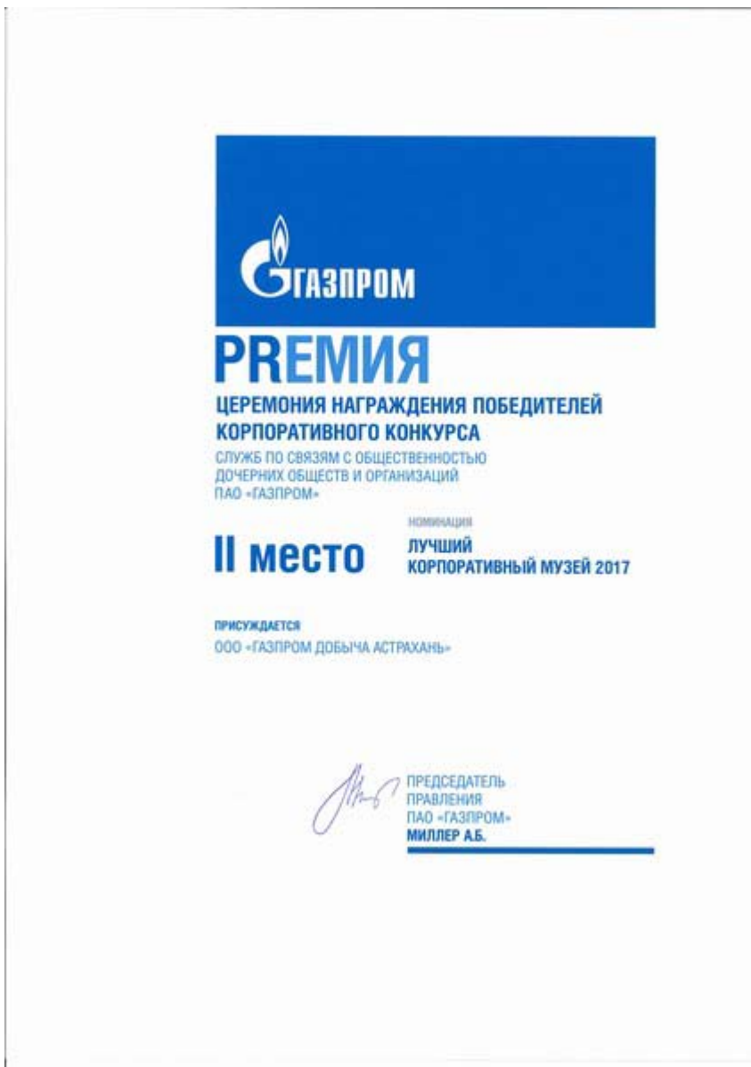
Увеличенная фотография (JPG, 206 КБ)

28 июня в рамках годового общего собрания акционеров ПАО «Газпром» состоялось подведение итогов IX Корпоративного конкурса служб по связям с общественностью дочерних обществ и организаций компании. Музей ООО «Газпром добыча Астрахань» занял второе место в номинации «Лучший корпоративный музей», сохранив свои позиции в тройке музейных лидеров ПАО «Газпром».