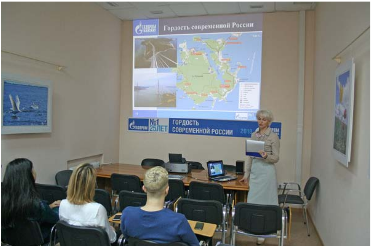
Увеличенная фотография (JPG, 859 КБ)

В марте Музей ООО «Газпром добыча Астрахань» принимал учащихся средних и старших классов Астраханской области. Школьники из Яксатова, Линейного и г. Нариманова познакомились с деятельностью крупнейшего газового предприятия региона и основными профессиями комплекса.