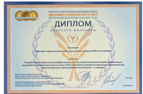
Медаль и диплом лауреата Всероссийского конкурса на лучшее инновационное решение в области обеспечения безопасных условий труда «Здоровье и безопасность»

К концу 1980-х годов по индивидуальному заказу с учётом особенностей АГКМ было разработано портативное дыхательное устройство ПДУ-3, а во второй половине 1990-х годов специалистами ВНИИгаза и Одесского государственного университета была разработана противогазная фильтрующая модернизированная коробка КПФМ, способная выдерживать высокую концентрацию сероводорода.