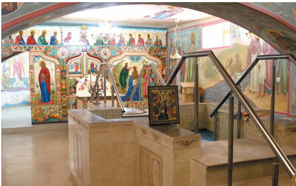
Богоявленский придел собора Святой Живоначальной Троицы

и животного мира. В нижнем ярусе – водный мир с рыбами и водорослями, в среднем – животные, травы и деревья, в верхнем – птицы. С левой стороны – икона, изображающая крещение Иисуса Иоанном Предтечей. С правой – двустворчатые дьяконские врата, на одной половине которых икона искушения Адама и Евы в раю, а на второй – образ Пресвятой Богородицы «Носящая во чреве».