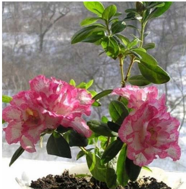
Азалия любит прохладу, в период цветения температура воздуха не должна повышаться более +18 – +20 °С. Любит обильный полив и не переносит прямых солнечных лучей

Человеку всегда чего-то не хватает: летом – прохлады, зимой – палящего солнца. Ну что ж, видно, мы так устроены. И природа, кстати, солидарна с нашими желаниями. Хотя бы в той части, что создала такие растения, которые зацветают исключительно тогда, когда за окном минус, а сердцу так «не хочется покоя».