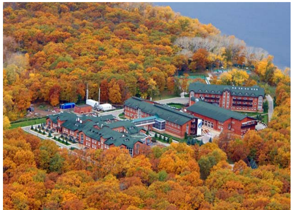
Санаторий-профилакторий «Нива», Саратовская область