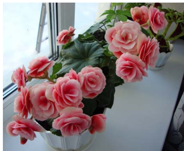
Бегония сортов «бориас» или «лоррен» не любит сквозняков и нуждается в хорошем освещении, оптимальный температурный режим для этого растения – плюс 15–20 градусов