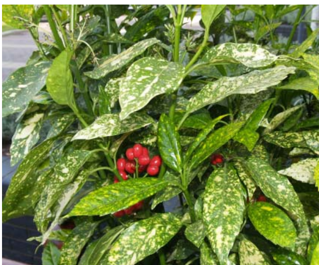
Золотое дерево или аюкуба теневыносливо и может быть размещено по центру комнаты. Всё, что нужно аюкубе, – это умеренный полив и невысокая температура в помещении