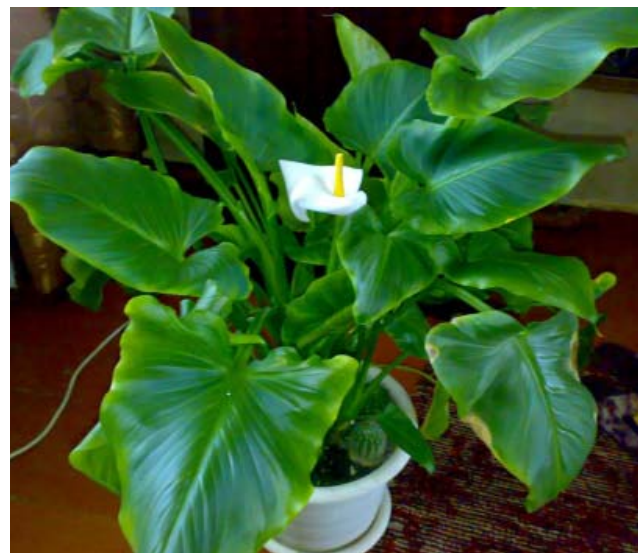
Кала эфиопская при уходе требует много влаги, очень любит опрыскивания. Вырастает до 150 см в высоту, а листья его достигают в длину 40 см