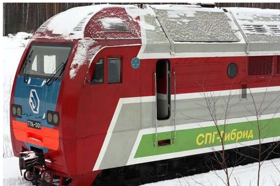
Иновационный магистральный газотурбовоз – первый серийный российский локомотив, работающий на сжиженном природном газе

Компания также реализует программу по переводу корпоративного транспорта на природный газ. На сегодняшний день доля газомоторных автомобилей в автопарке Группы «Газпром» составляет 26%. В среднесрочной перспективе компания планирует значительно увеличить количество собственной газомоторной техники. Реализация этой программы уже принесла существенный экономический эффект: суммарно в 2014–2015 годах и за 10 месяцев