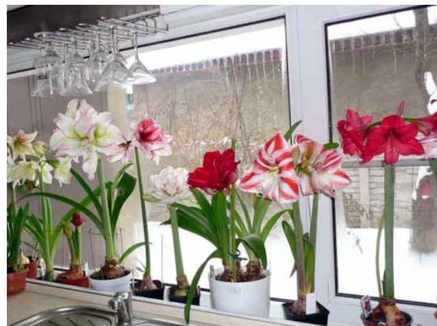
Гиппеастум называют ещё «кавалерийскими звёздами». При покупке выбирайте самую крупную луковицу, так как она даст больше всего цветков. Любит свет и много влаги