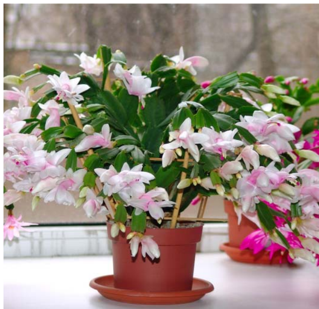
Лесной кактус шлюмбергера в народе называют по-разному: «декабрист» или «рождественский кактус». Как только появятся первые бутоны, необходим обильный полив