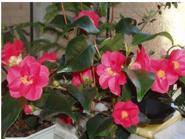
Камелия японская – декоративно цветущий кустарник. Для цветения камелии необходимо прохладное содержание при температуре +10 – +15 °С и много света