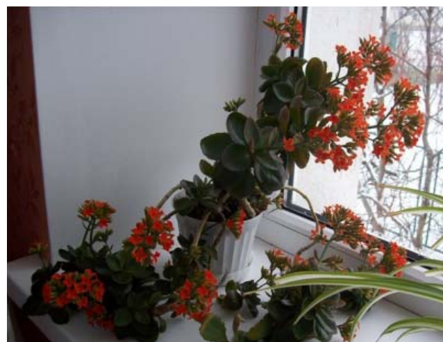
Цветение каланхоэ Блоссфельда бывает наиболее активным, если осенью держать это растение на северных окнах, а в начале декабря переставить на более светлое южное окно