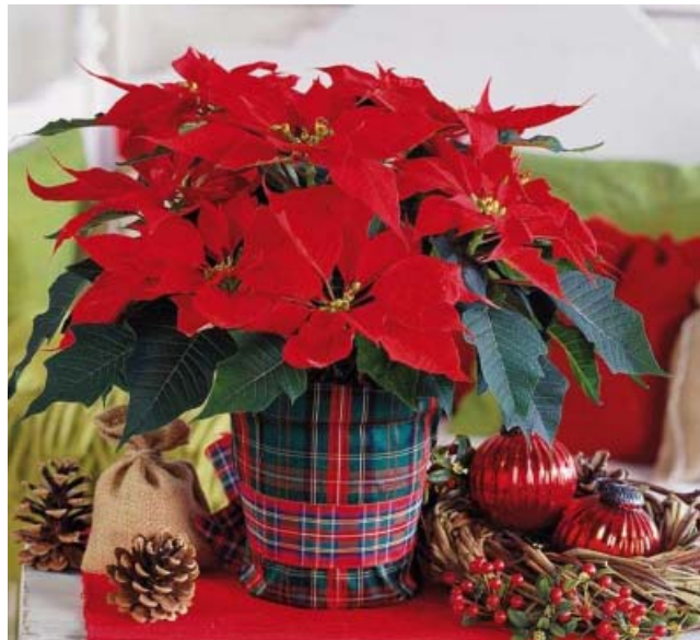
«Рождественская звезда» или пуансеттия – традиционное украшение на новогодние праздники. Есть сорта с белыми, кремовыми, розовыми и двуцветной окраски прицветниками