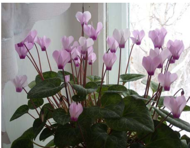
Цикламен или альпийская фиалка уже при +17 наотрез отказывается цвести, поэтому зима – это лучшее время, чтобы полюбоваться цветами, похожими на порхающих бабочек