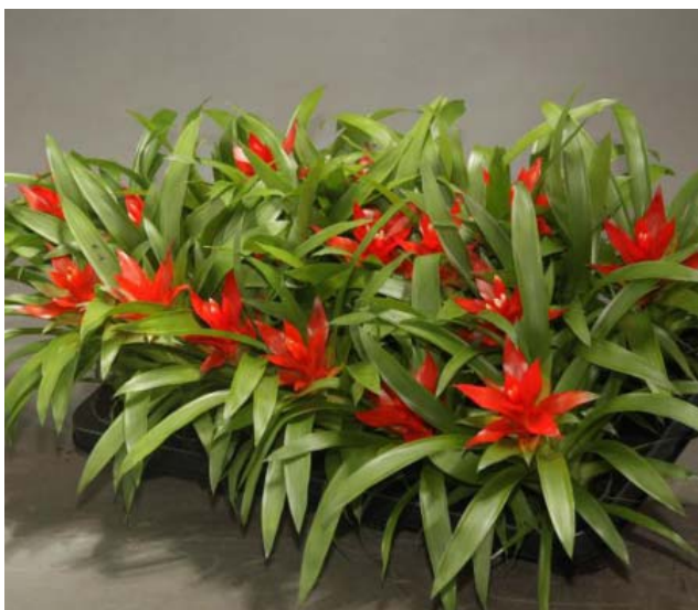
Гузмания подарит яркие соцветия красно-оранжевого цвета, если создать ей влажную среду, часто опрыскивать листья или протирать их влажной губкой