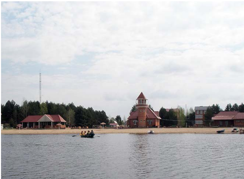
База отдыха «Селигерские зори», Тверская область