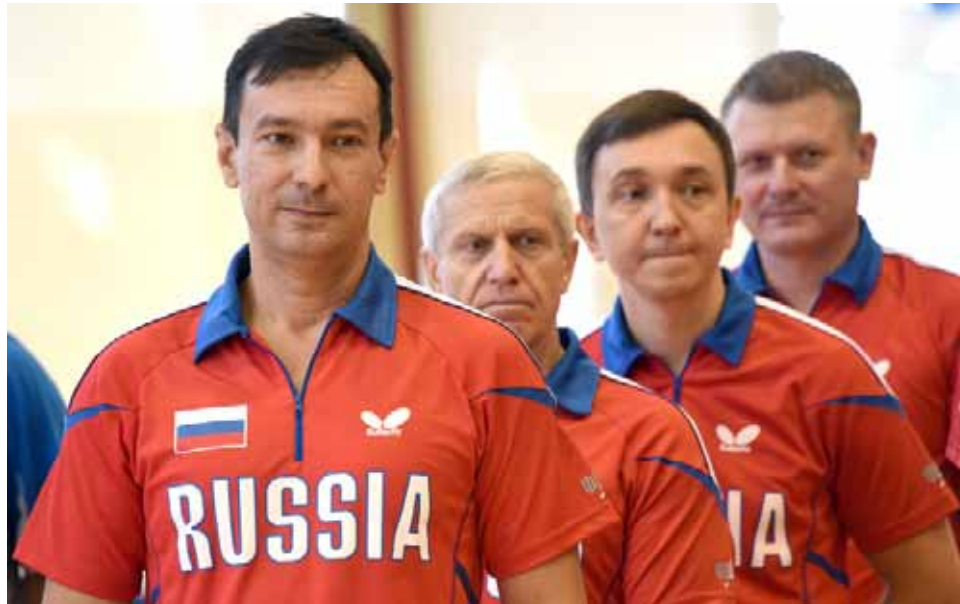
Победители в турнире по настольному теннису

Серебряные награды вручили команде ВЧ в составе заместителя начальника час-