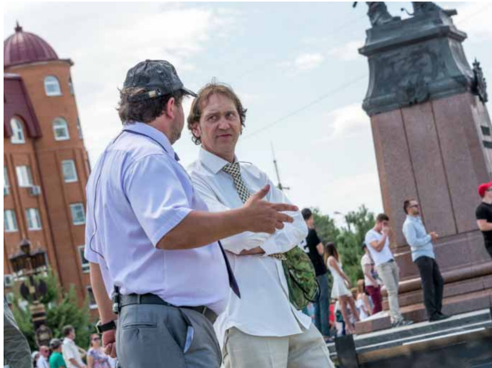
На съёмках фильма «День выборов-2»

– Сначала для того, чтобы снять рыцарей под дождём их поливали из пожарной машины, а затем начался настоящий