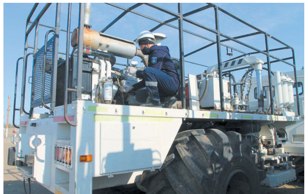
Техническое обслуживание сейсмовибратора «Батыр»