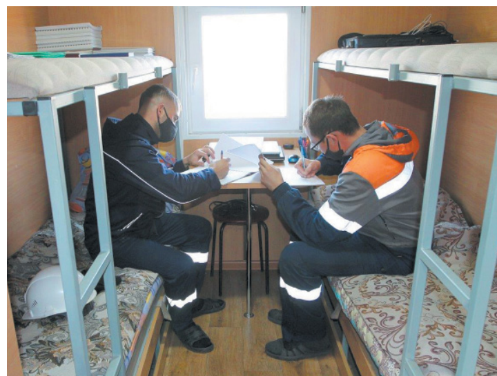
В жилом вагончике

В будущем году исполнится 45 лет со дня открытия месторождения, которое ООО «Газпром добыча Астрахань» эксплуатирует почти сорок лет. Казалось бы, за столь внушительный срок подземные залежи изучены вдоль и поперек, но стремительное развитие технологий позволяет каждый раз детализировать наши знания о недрах.