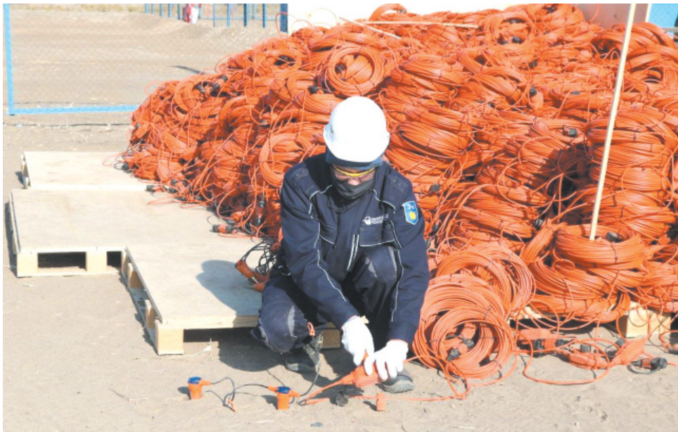
Демонстрация сейсморазведочного оборудования

словами, исходящая волна будет со всех сторон «ощупывать» каждый слой, любой выступ, впадину или трещину с тем, чтобы дать наиболее точный образ подземного горизонта.