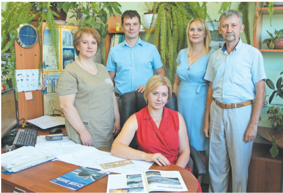
Отдел по разработке архитектурно-строительных решений