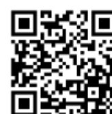
«Ночь в лесу»