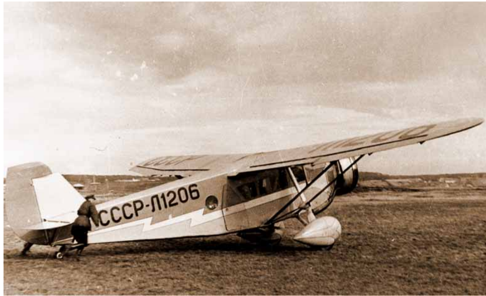
Первое в истории предприятие воздушного сообщения связывало Астрахань и Москву и обслуживалось шестиместными самолетами «Сталь-3», выполнявшими по одному рейсу в день