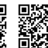
«Тур в пустыню»