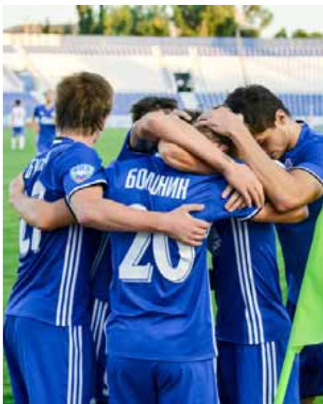
Астраханцы празднуют забитый гол

На минувшей неделе футболисты астраханского «Волгаря» провели сразу две встречи в рамках ФОНБЕТ-Первенства России. 13 августа астраханцы принимали в родных стенах калининградскую «Балтику», а в среду, 17 августа, встречались на выезде с «Зенитом-2» из Санкт-Петербурга.