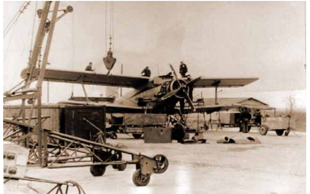
В годы Великой Отечественной войны Астраханский аэропорт имел важное стратегическое значение