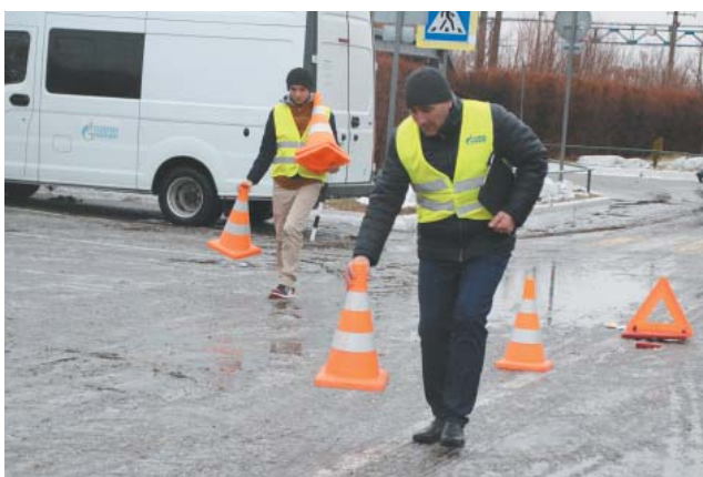
На место происшествия прибыли сотрудники отдела безопасности дорожного движения УТТиСТ и закрыли данный участок для движения, чтобы сохранить доказательную базу