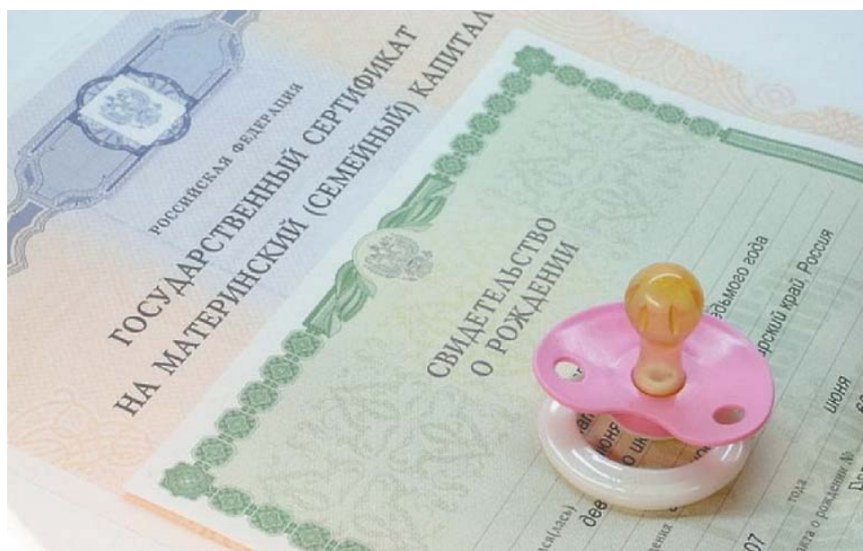
С 1 февраля на 7,3 % увеличится размер материнского капитала

Возобновилась индексация пенсий для тех, кто формально вышел на заслуженный отдых, но продолжает трудиться. Их