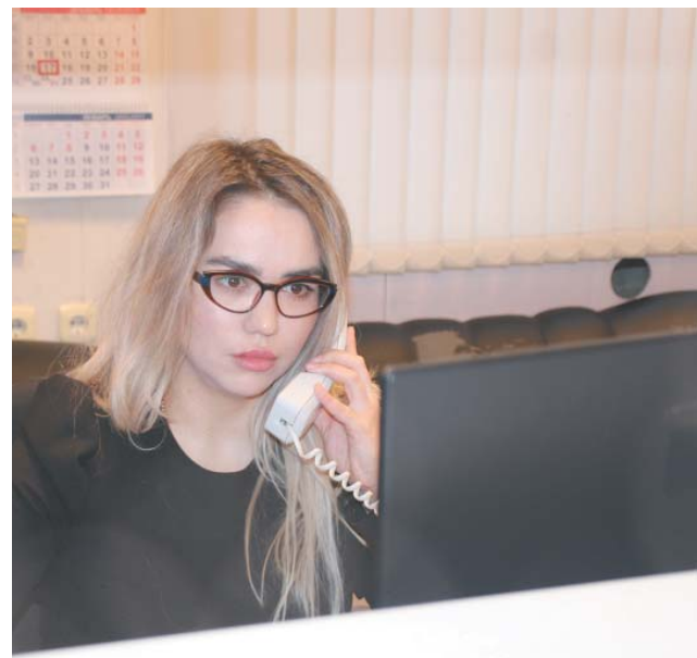
Получивший информацию диспетчер передал её профильным отделам Общества и условно в ОГИБДД по Красноярскому району