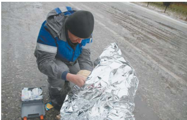
Водитель оказал условному пострадавшему первую помощь

ванию навыков и умений водителей, диспетчеров, сотрудников отдела БДД и ЧУЗ МСЧ проводятся в ООО «Газпром добыча Астрахань» ежегодно. Эти мероприятия включены в комплексный план по предупреждению ДТП на предприятиях Группы «Газпром». Тренировки выполняются согласно методическим рекомендациям, а также СТО Газпром «Безопасность на автомобильном транспорте». ■