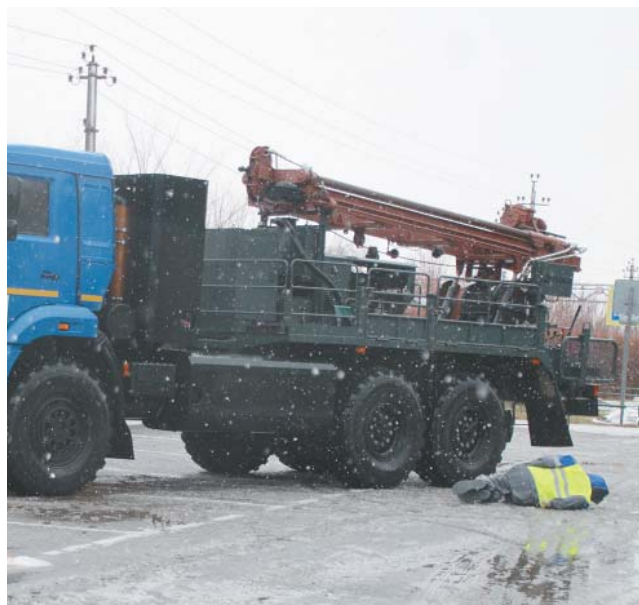
По легенде тренировки автомобиль КамАЗ совершил при движении задним ходом наезд на условного пешехода (манекен)

После условного наезда водитель покинул кабину грузовика, чтобы оценить обстановку, и оповестил о ДТП диспетчерскую службу, своего руководителя – начальника автоколонны и условно экстренные службы по номеру 112. Получивший информацию диспетчер передал её дальше профильным отделам Общества и условно в ОГИБДД по Красноярскому району. Пока водитель оказывал пострадавшему первую помощь, на место происшествия прибыли сотрудники отдела безопасности дорожного движения УТТиСТ и закрыли данный участок для движения, чтобы сохранить доказательную базу. В то