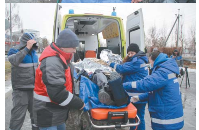
Сотрудники ЧУЗ «Медико-санитарная часть» оказали медицинскую помощь условному пострадавшему и транспортировали его в медицинское учреждение