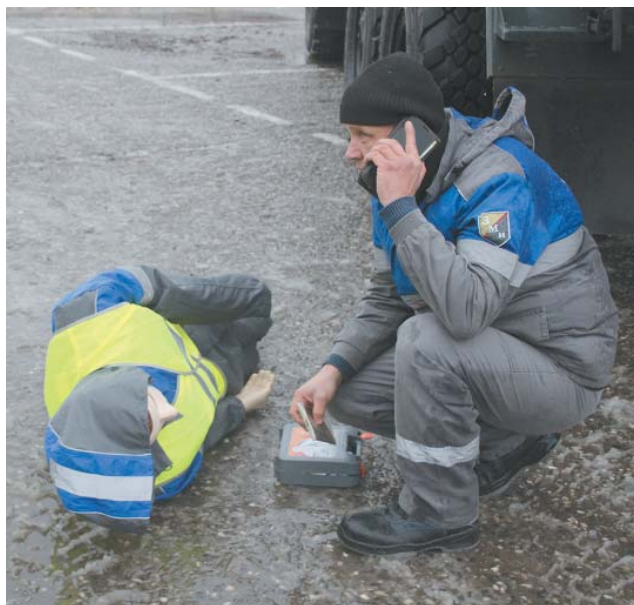
После условного наезда водитель покинул кабину грузовика, чтобы оценить обстановку, и оповестил о ДТП