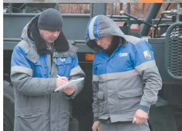
Сотрудник по охране труда осуществил сбор информации и фотографирование места ДТП