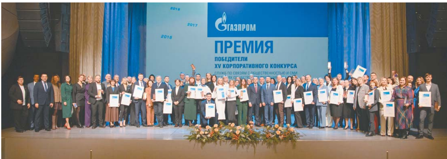
Победители XV конкурса служб по связям с общественностью и СМИ дочерних обществ и организаций ПАО «Газпром»