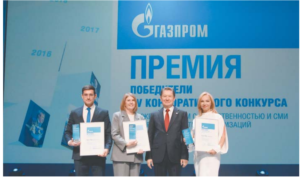
Награды победителям Гран-При вручил Алексей Миллер

Среди музейных проектов победителем стал – «Даёшь Уренгой!». ООО «Газпром добыча Уренгой» организовало историческую реконструкцию события 50-летней давности – отправление первого автотракторного поезда с добровольцами для обустройства Уренгойского месторождения в 1973 году.