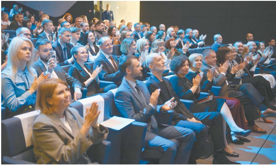
Во время церемонии

В Санкт-Петербурге состоялось награждение победителей XV конкурса служб по связям с общественностью и СМИ дочерних обществ и организаций ПАО «Газпром». В церемонии принял участие Председатель Правления ПАО «Газпром» Алексей Миллер.