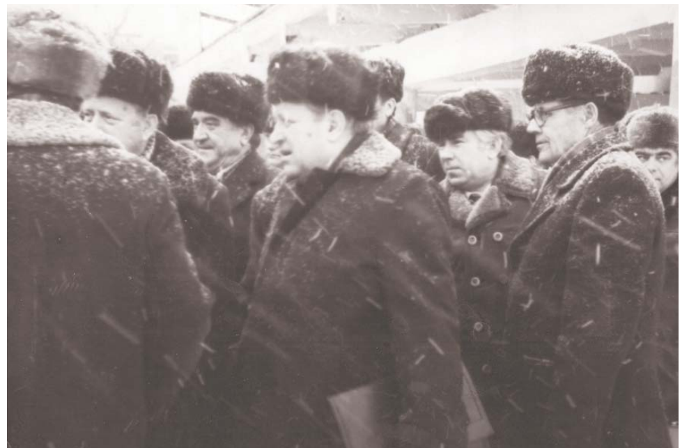
Правительственный десант на объектах АГК. 1982 год

Перед Динковым поставили новую задачу – создание газового промысла в зоне