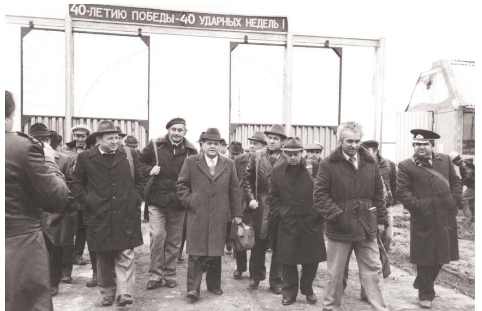
Визит правительственной делегации на объекты Карачаганакского месторождения. 1980-е гг.