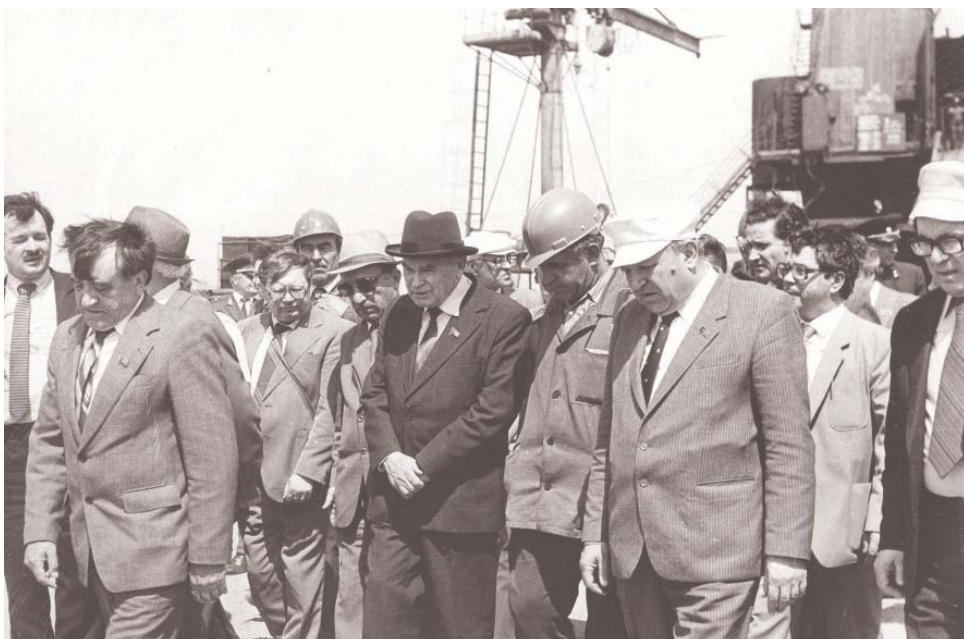
Визит на АГКМ Байбаева Н.К., председателя Госплана СССР. Посещение буровой. 1984 год

Его труд был отмечен званием Героя Социалистического труда, орденами Ленина, Октябрьской революции, Трудового Красного Знамени и другими наградами. ■