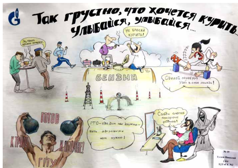
1 место (ГПУ)