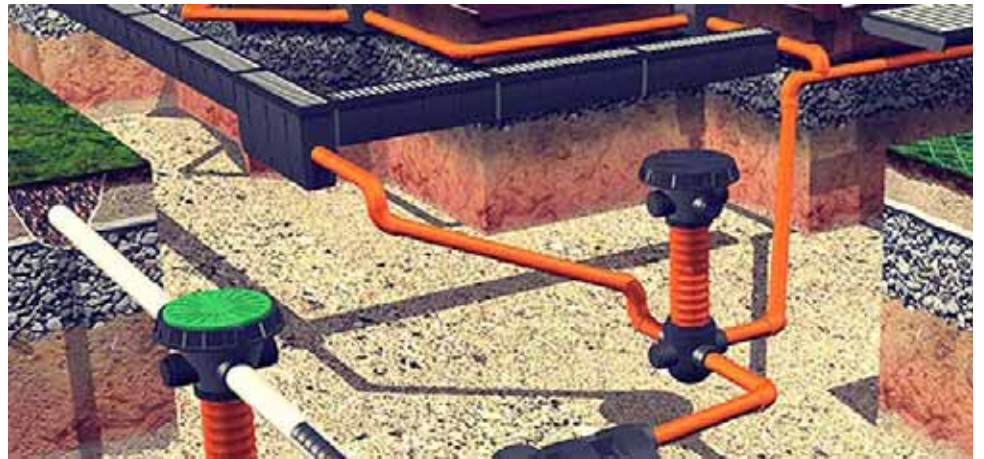
Мечты автомобилистов и пешеходов

И ещё один показательный аргумент в пользу ливне-дренажной системы – это состояние жилого фонда. И не нужно удивляться! Подтопление домов грунтовыми и дождевыми водами – проблема для астраханцев многовековая и дорогостоящая. Причём в связи с жилищным законодательством, где чётко сказано, что собственники несут ответственность за состояние дома, получается так, что подтопленные подвалы – это головная боль жильцов! Да ещё какая! Дело в том, что при подмочке фундамент здания расслаивается и на нём появляется светлый рыхлый налёт, напоминающий гипс. Помимо этого, возможно возникновение плесени и грибка, желтоватых размытых пятен, запаха сырости в непосредственной близости от бетонного монолита. Специалисты отмечают, что при высоком уровне грунтовых вод ещё на стадии строительства здания начинают возникать сложности и необходимо устройство дренажной системы и отведение вод в ближайший водоём, накопительный колодец или городские коммуникации. Примеров подтопления жилого фонда много. После майских ливней «потонули» подвалы пятиэтажек на ул. Коммунистической, Красноармейской, а также ряд домов в Юго-Востоке. Кстати, как констатируют специалисты-строители, из-за постоянной подмочки изношенность жилого дома увеличивается в разы. Таким образом, напрашивается более чем очевидный вывод: и дома, и дороги начинать строить необходимо с обустройства дренажной системы.