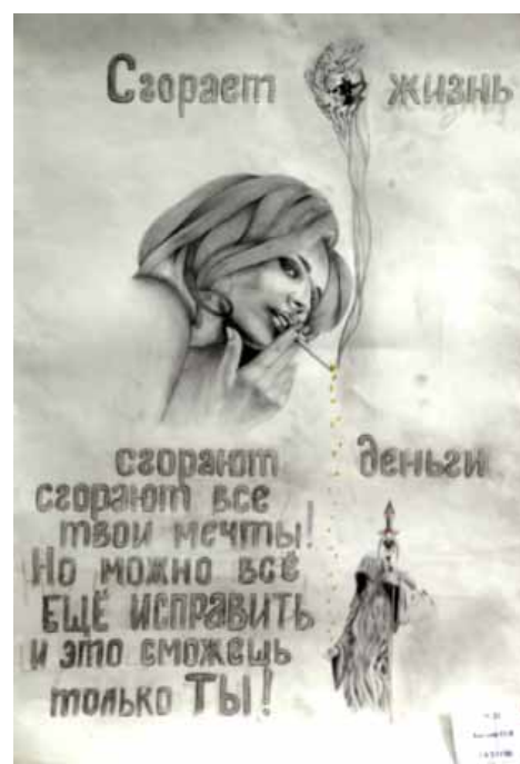
2 место (УКЗ)