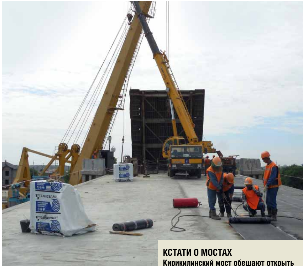
Длина моста 254 метра. Ширина проезжей части 9 метров (две полосы движения)