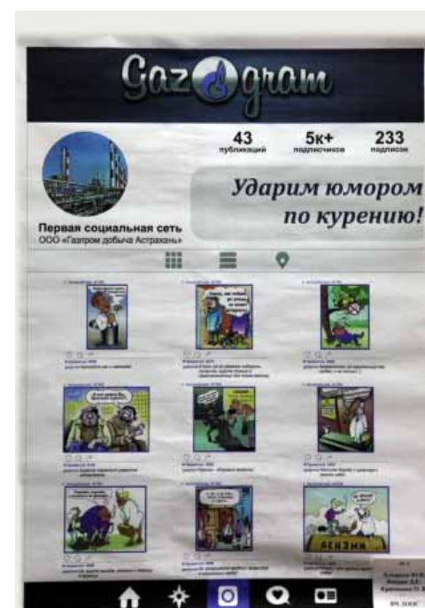
3 место (ВЧ)