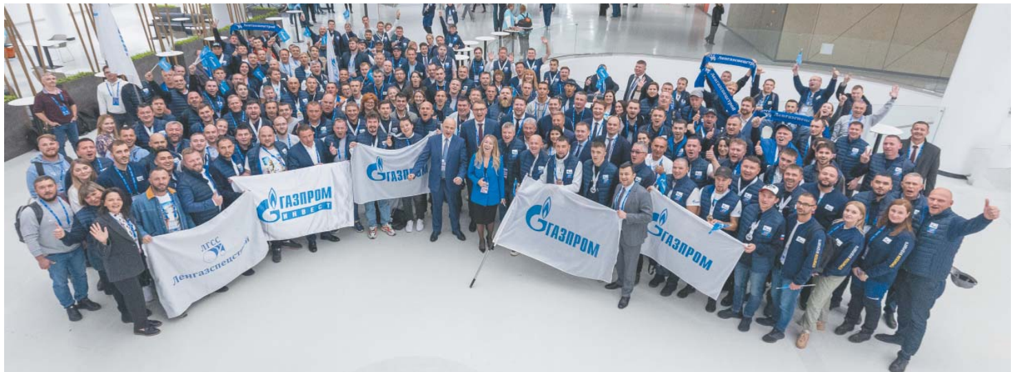
Команда «Газпрома» завоевала 43 медали и вышла в абсолютные лидеры общего медального зачета

Международный строительный чемпионат – ежегодное мероприятие, объединяющее соревнование профессиональных специалистов сферы промышленно-