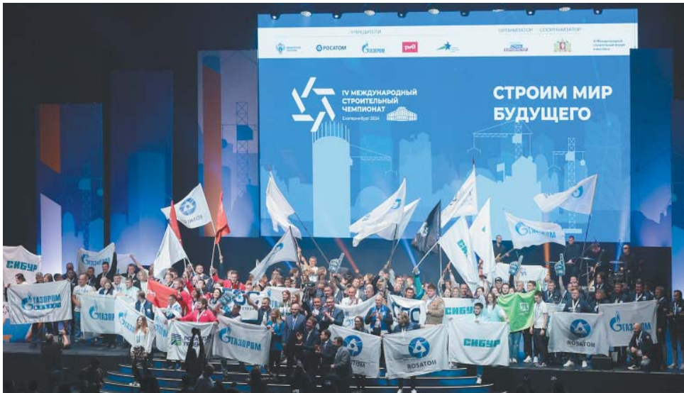
Сборную компании представляли 157 работников из более чем 20 дочерних и подрядных организаций