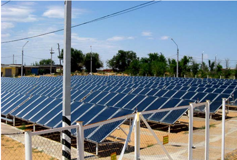
Энергетический комплекс из солнечных коллекторов и котельная мощностью 30 МВт в городе Нариманов

В Наримановском районе ищут альтернативу голубому топливу