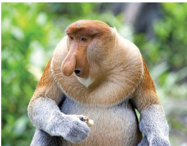
Носачи – дружелюбные