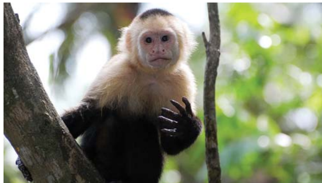
Капуцины – участливые

Наступающий год Обезьяны, безусловно, будет интересным, как интересны и сами обезьяны. В мире насчитывается около 300 видов этих человекообразных животных. Все они в той или иной степени наделены людскими качествами. Вглядитесь, это интересно!