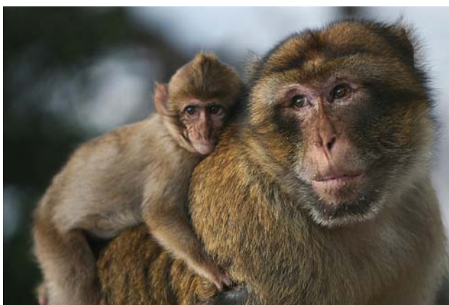
Мартышки обыкновенные – весёлые