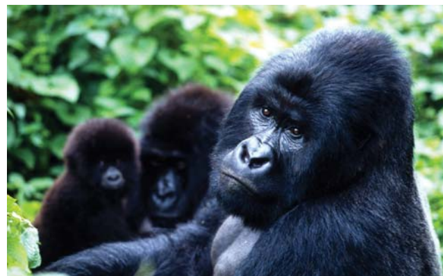
Гориллы – сильные