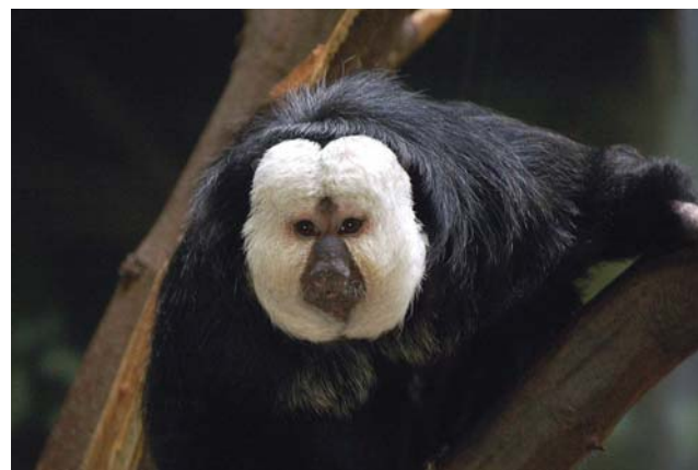
Широконосые обезьяны – гламурные