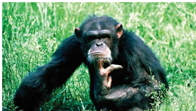
Шимпанзе – изобретательные