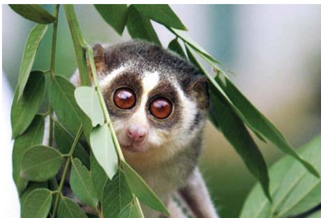
Лемуры – невозмутимые