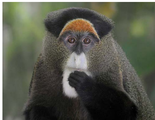
Мартышки Бразза – опрятные

И ВСЁ-ТАКИ, НЕСМОТРЯ НА СХОЖЕСТЬ ОБЕЗЬЯН С ЛЮДЬМИ, НЕ СТОИТ ЗАБЫВАТЬ, ЧТО «ЧЕЛОВЕК – ЭТО ЗВУЧИТ ГОРДО!»