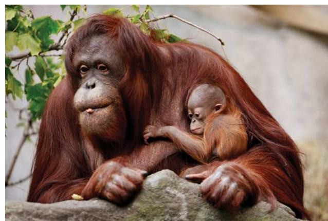
Орангутаны – ловкие