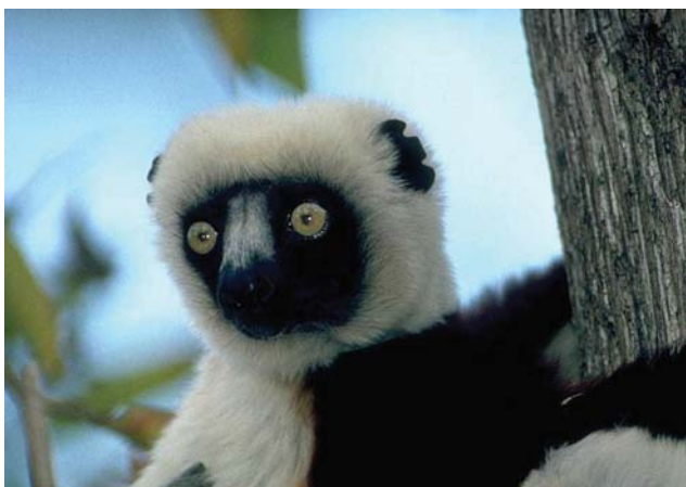
Сифаки – семейственные