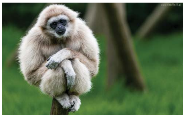
Гиббоны – чадолубивые