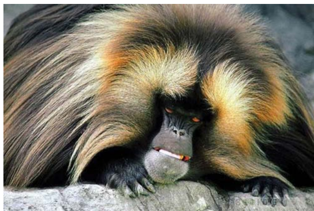
Гелады – смелые