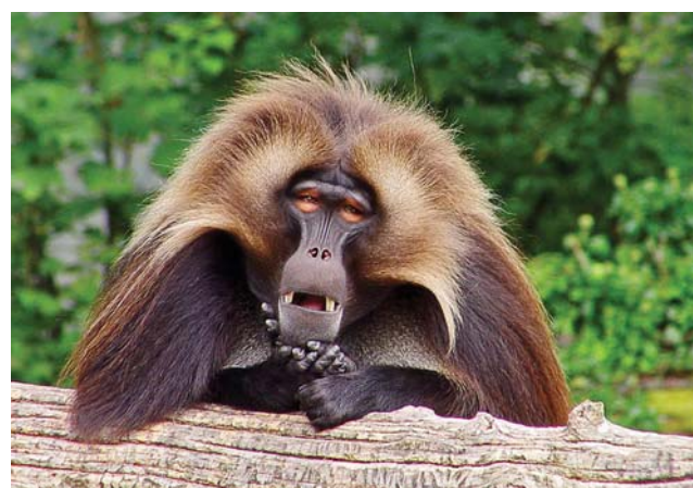
Павианы – умные