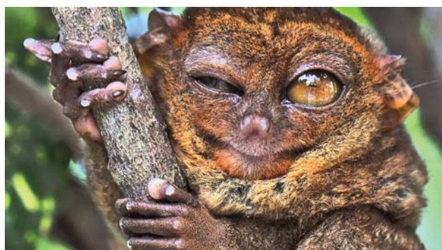
Долгопяты – зоркие