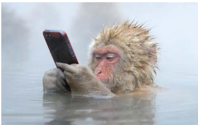
Макаки – заботливые