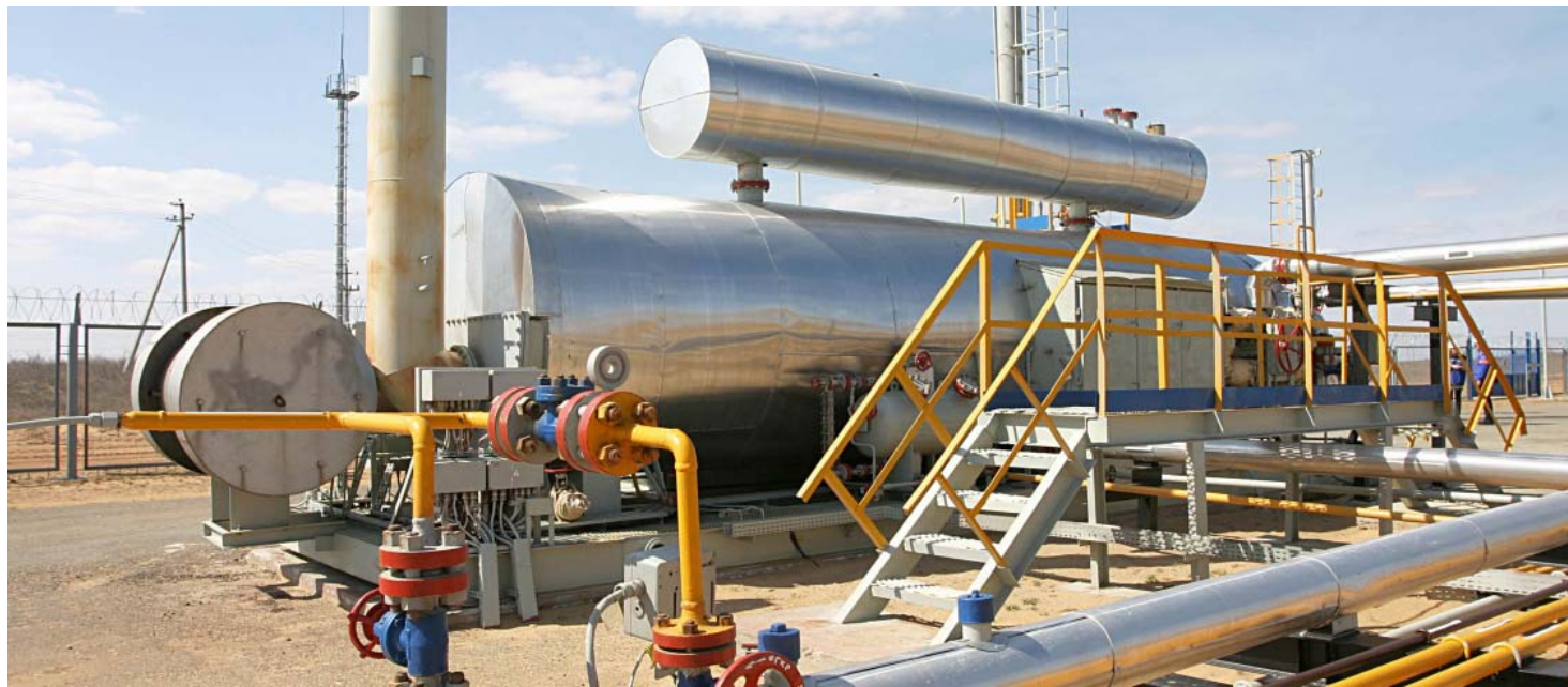
Подогреватель ГЖС ГП-1935 производства ФПК «Космос-Нефть-Газ» (г. Воронеж)

На протяжении многих лет с нами тесно сотрудничают более десятка отечественных предприятий, освоивших производство и усиленно работающих над освоением моноблоков, задвижек с ручным и пневматическим управлением, трубных и колонных головок, обратных клапанов, угловых дроссельных штуцеров и другой соответствующей продукции, которая не уступает образцам зарубежных фирм «Cameron», «Malbrancque», «Barber», «McEvoy», «Anson», «FMC». Доказали