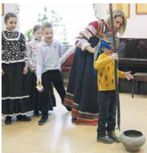
Народная игра «Горшок»