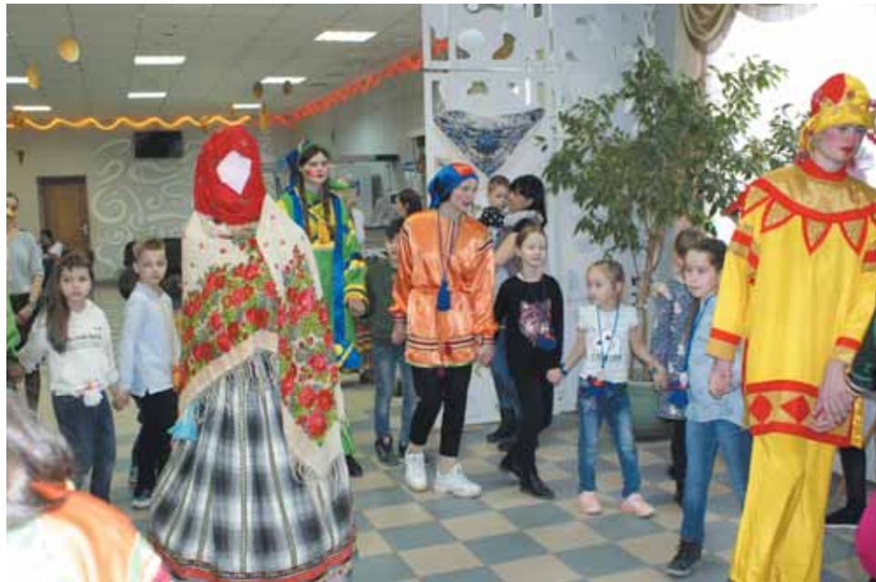
«Масленица во двор въезжает»

Самой загадочной и буквально погружающей в фольклорный мир стала пло-