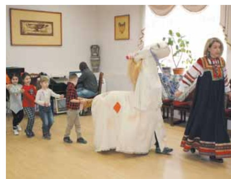
Катание на масленичной лошадке