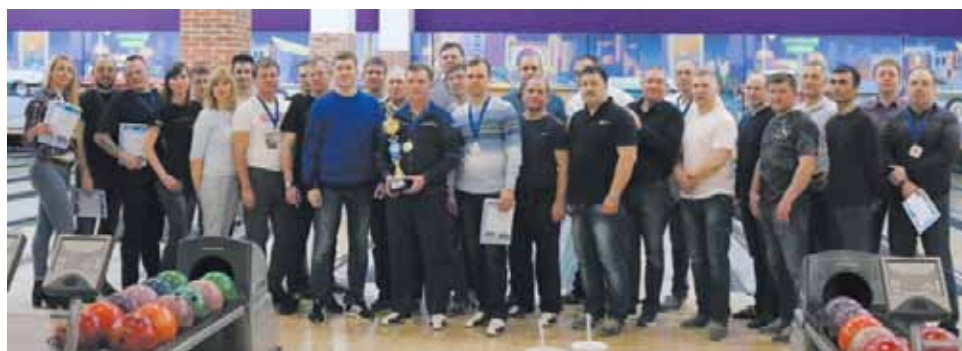
Победители и участники соревнований по боулингу

Сборной ГПУ, набравшей 805 очков, достались серебряные награды. Честь Газо-