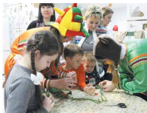
Творчество на площадке «Посиделки»