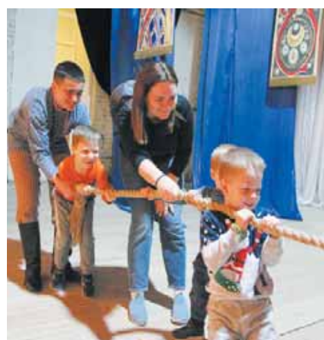
Народная игра на площадке «Разгуляй»

щадка «Сказкин дом». Едва переступив порог помещения, дети оказывались сначала в волшебном лесу, где рядом с огромными старыми деревьями расположился пруд с кувшинками и маленьким мостиком. Затем попадали в избу с большой печью, в которой можно было готовить блины, и столом, посреди которого красовался настоящий чугунок.