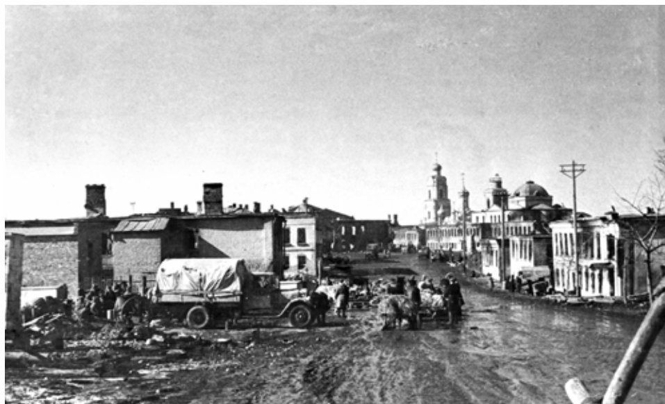
Освобожденная Вязьма, 1943 год

Однажды едва не погибла. Кто-то наступал полициям, что моя мама – комсомолка, у неё и билет есть. Пришли к нам с обыском. Перевернули весь дом вверх