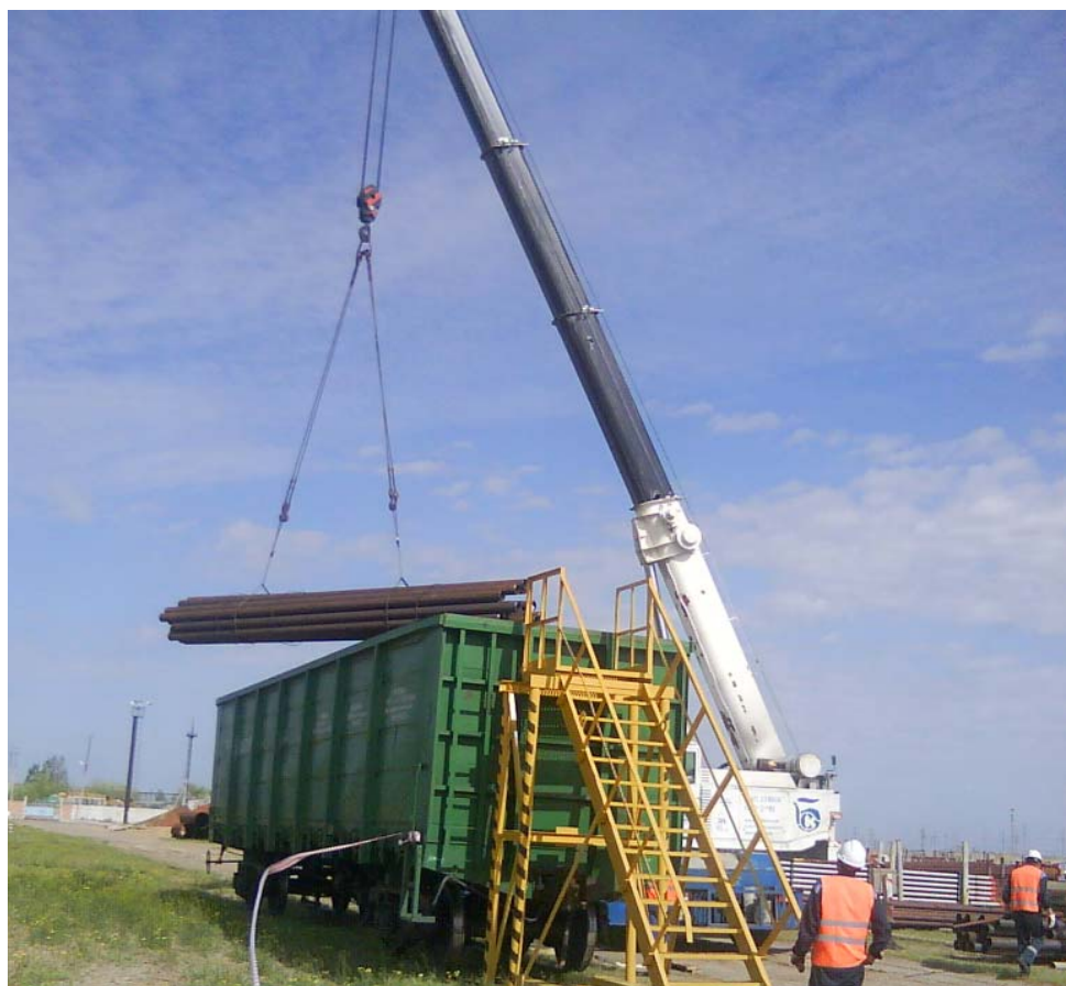
Площадка стропальщика для осуществления погрузо-разгрузочных работ на ж/д вагонах