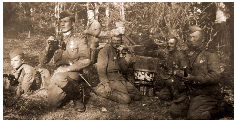
Австрия, 1945 г.

В наградном листе есть и несколько цифр: за время сорокадневных боёв по освобождению от немецких захватчиков