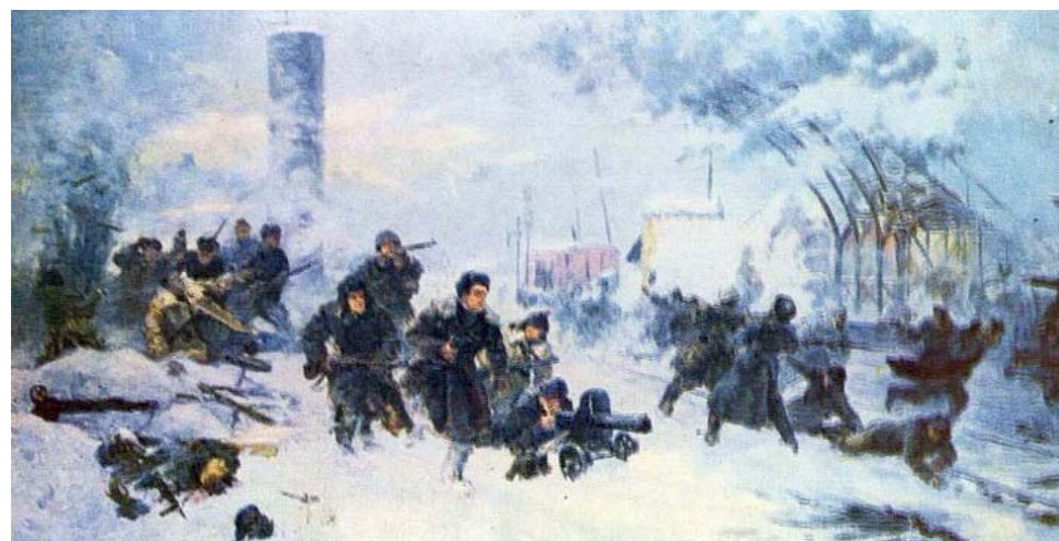
А. Горпенко «Бой под станцией Крюково», 1943