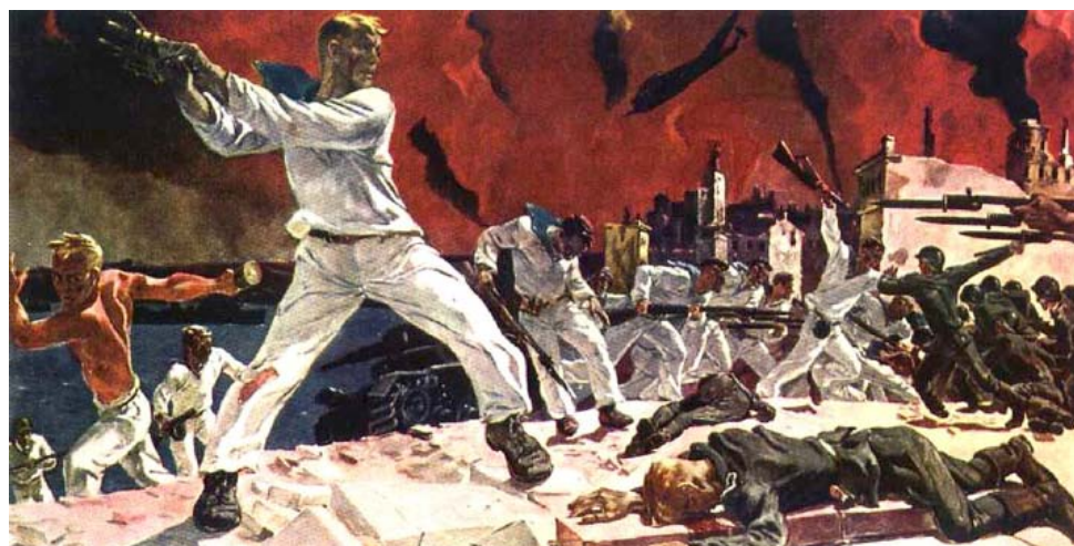
А. Дейнека «Оборона Севастополя», 1942