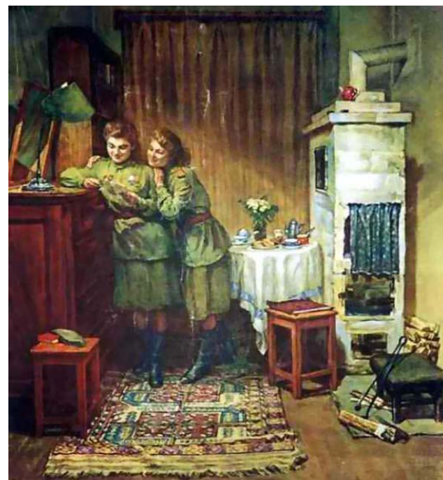
С. Рянгина «Подруги», 1947