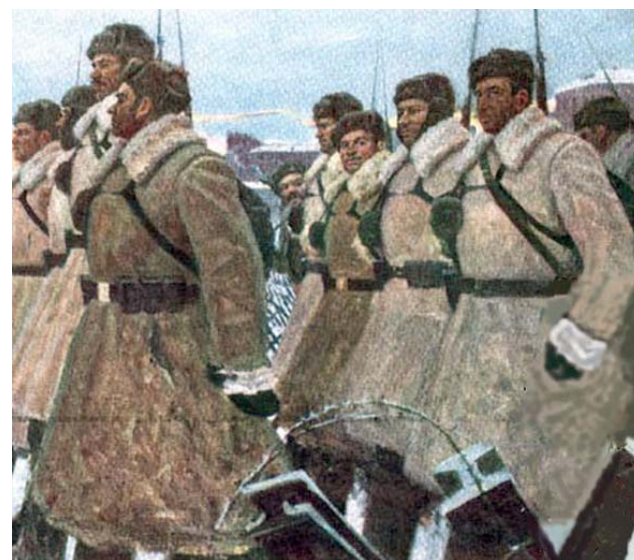
А. Лысенко «1941 год»