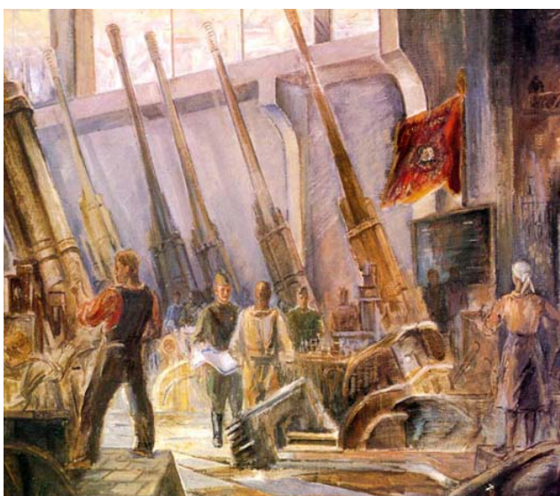
А. Козлов «Соревнование на военном заводе», 1942