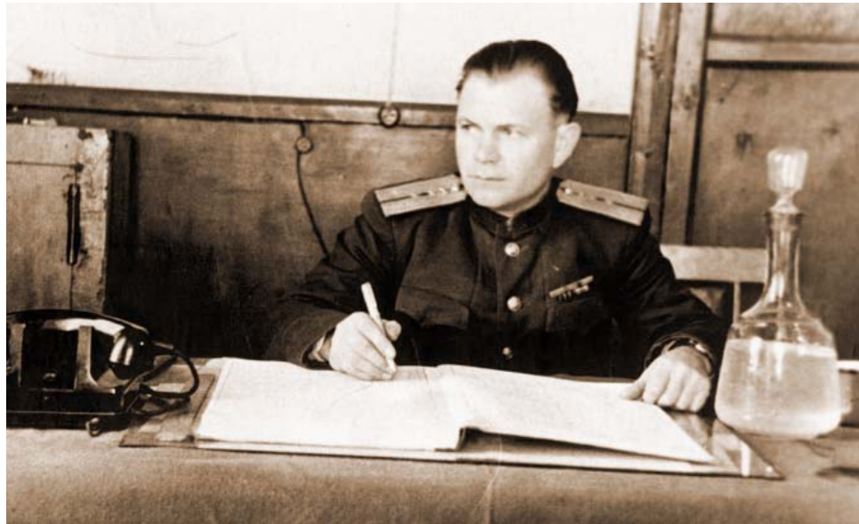
Начальник погранзаставы, г. Термез, Узбекистан, 1957 г.

Вот такой эпизод вспоминал отец из своей пограничной службы: «Турецкие войска уже стояли на границе в полной боевой готовности. Они рассчитывали взять Батуми за три дня. Поэтому перед выходом на границу все отряды предупредили, что любой выстрел на границе – это боевая тревога, при этом застава поднималась «в ружьё» и срочно сообщалось в Батуми, в пограничные войска и в войска дислоцирования. Однажды ночью я вышел с моим учеником (из раненых фронтовиков, которых из Батуми после выздоровления направляли в погранзаставы) на границу, определил его задачу и предупредил, что на границе есть медведь. Обычно он выходил из кустов, но людей не трогал, только сопровождал пограничников и норовил поиграть с ними. Вот этот медведь нас и встретил. И вот на рассвете слышу: щёлкает затвором мой ученик. Я не успел ему подать знак, как услышал выстрел, потом второй, и вижу: перед ним стоит ране-