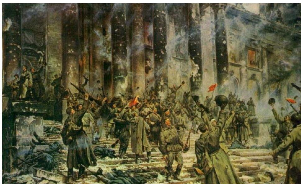
П. Кривоногов «Победа», 1945