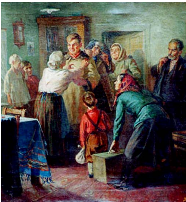
Ф. Деряжный «Возвращение», 1950