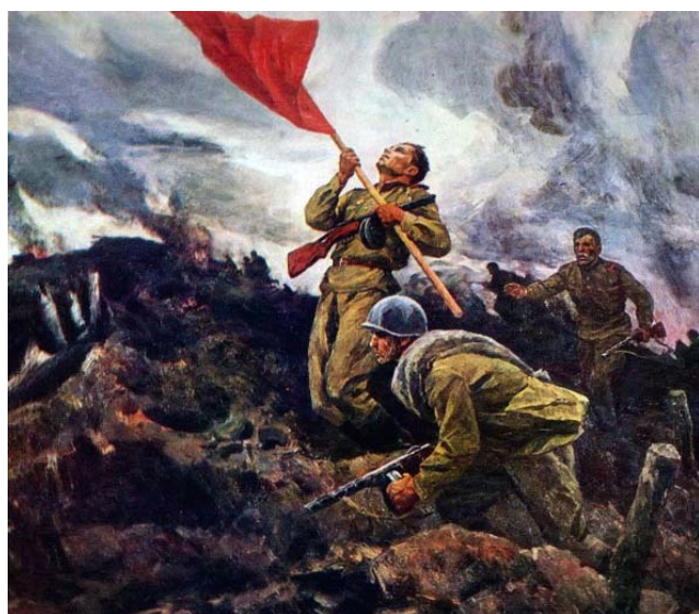
А. Широков «За Родину»