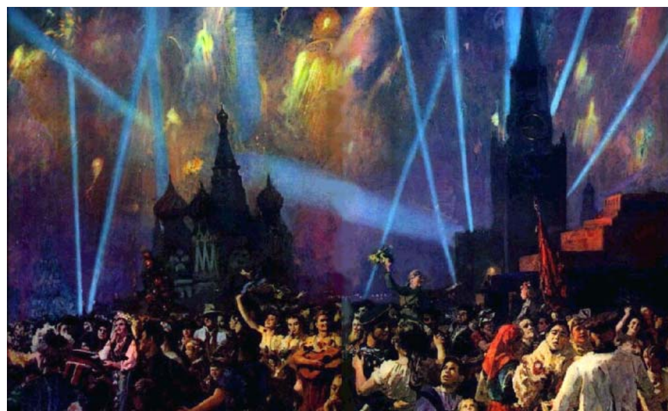
Б. Иогансон «Праздник Победы», 1947