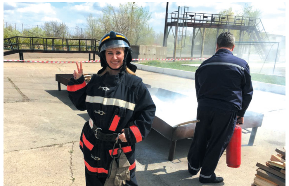
Участие в конкурсе «Лучший специалист по охране труда», 2016 год