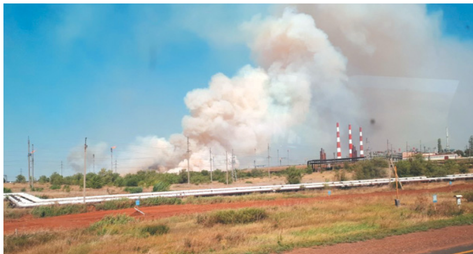
Степной пожар вблизи гелиевого завода

Не разрешается выбрасывать непотушенные окурки и спички, в том числе из автомобильного транспорта.