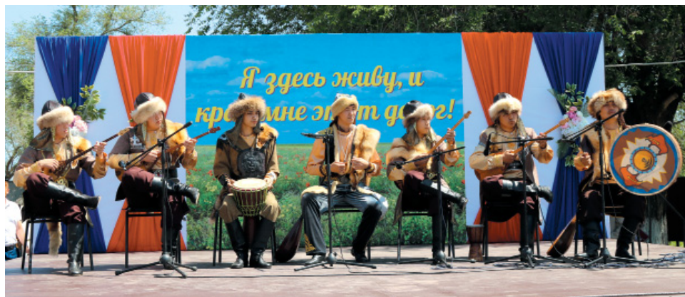
Ансамбль казахских народных инструментов «Шалкыма» Астраханского государственного колледжа культуры и искусств поздравляет степновцев с сотым днём рождения музыкальным подарком

Первое упоминание о поселке Аксарай в составе Сеитовской волости Красноярского уезда относится к 1918 году. И только в 1969 г. указом президиума Верховного Совета РСФСР поселок центральной усадьбы совхоза «Аксарайский» переименован в поселок Степной. На сегодняшний день поселок Степной является административным центром МО «Аксарайский сельсовет», в состав которого входит еще три населенных пункта: с. Малый Арал, п. Приозерный, п. Кигач. В дружбе и согласии живут здесь представители разных национальностей, которые по праву гордятся своей малой родиной и её историей! А потому на праздник пришли не только жители посёлка, съехались «степновцы» из разных уголков Красноярского района, города Астрахани и области. И, конечно, на юбилейные торжества собралось много почётных гостей, среди которых пред-