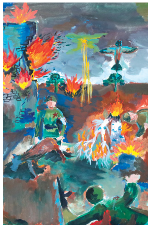
«1941 г. Наступление», Святослав Абакумов, 10 лет

Выставка продлится две недели, 8 мая она будет работать в фойе и сквере театральной части Административного центра газодобывающих предприятий. Предлагаем вниманию читателей некоторые работы с выставки.