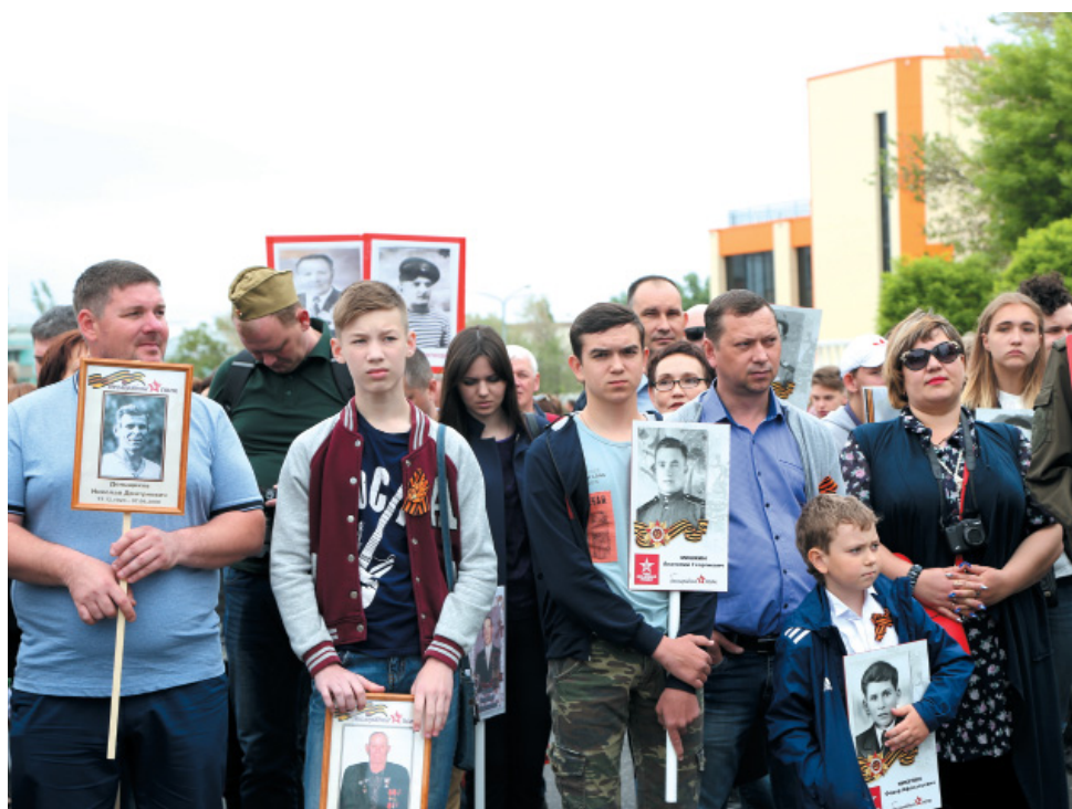
Колонна астраханских газовиков на шествии 2018 года