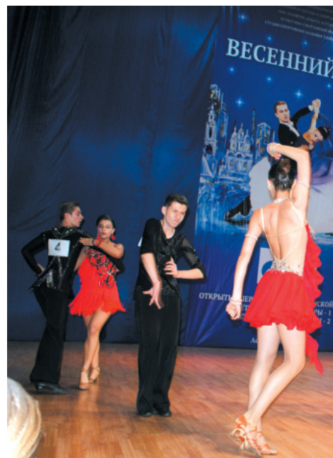
На танцпол вышли танцоры из 19 клубов России. Всего в соревнованиях приняли участие около 400 пар