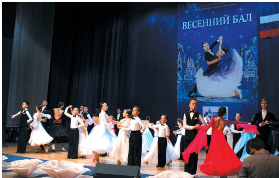
Турнир открыли «Большим вальсом» воспитанники Студии спортивных бальных танцев «Факел»