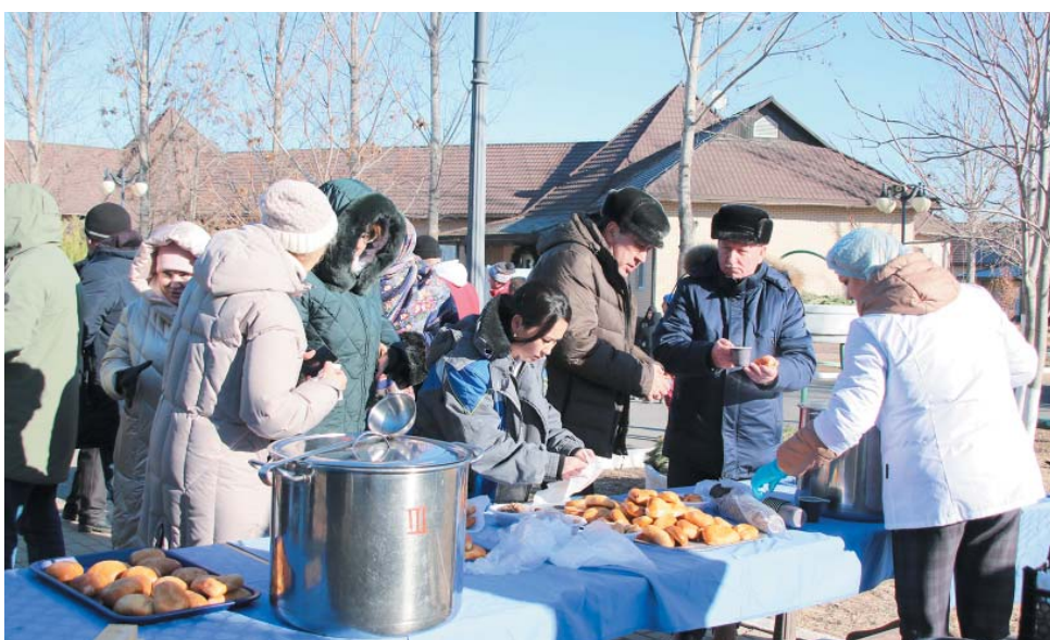
После морозной купели – горячий чай, вкусные пирожки и гречневая каша