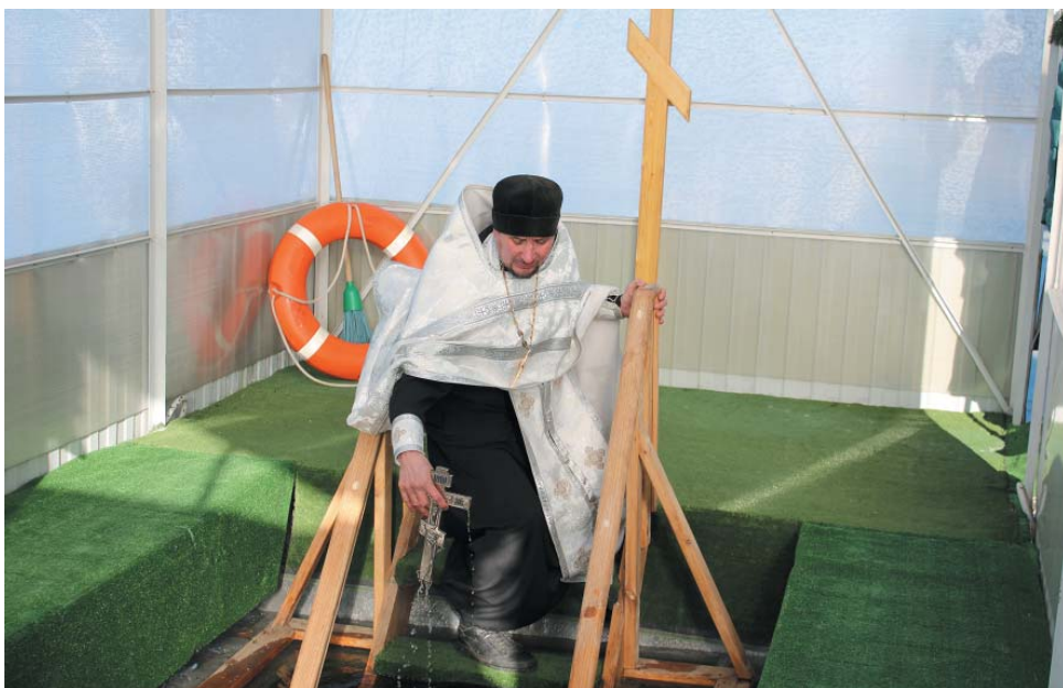
Чин освящения крещенской купели