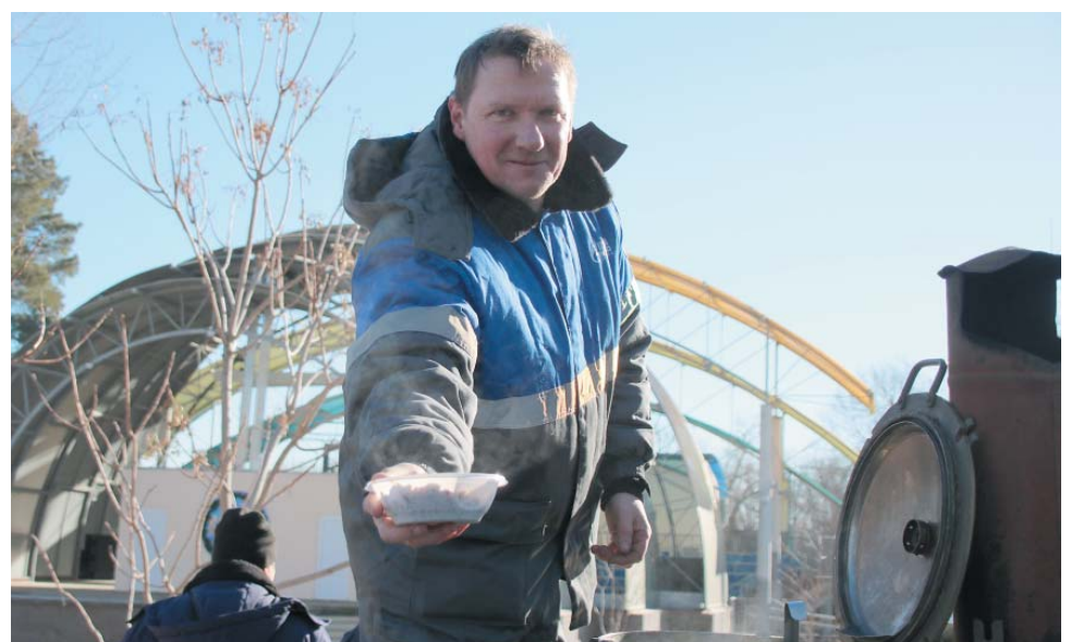
– Угощайтесь, гости дорогие! Приезжайте к нам через год снова!