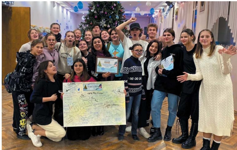
В фестивале «Зимняя сказка – 2023» приняли участие 20 воспитанников ДЮТС «Авотимы»