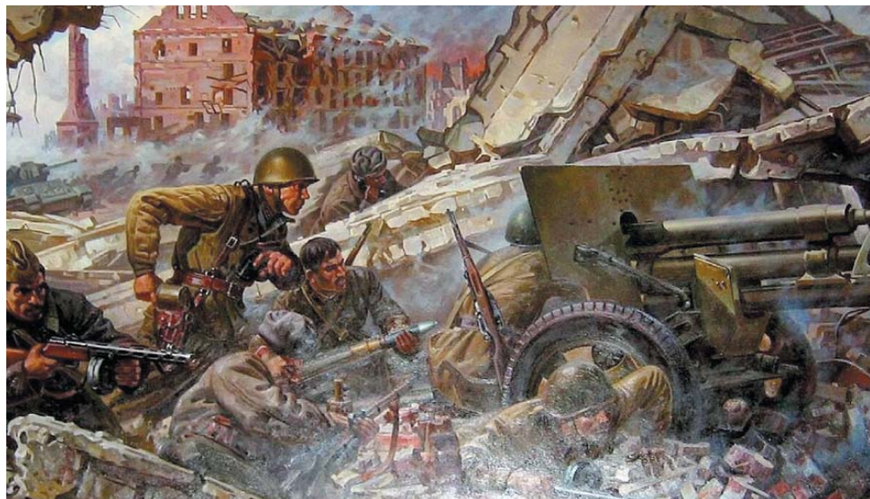
«Битва за Сталинград», Г. Марченко

2 февраля мы отметим 80-летний юбилей разгрома советскими войсками немецко-фашистских захватчиков в Сталинградской битве. Сталинградская битва – одна из крупнейших в Великой Отечественной войне 1941–1945 годов. Она началась 17 июля 1942 года и закончилась 2 февраля 1943-го.