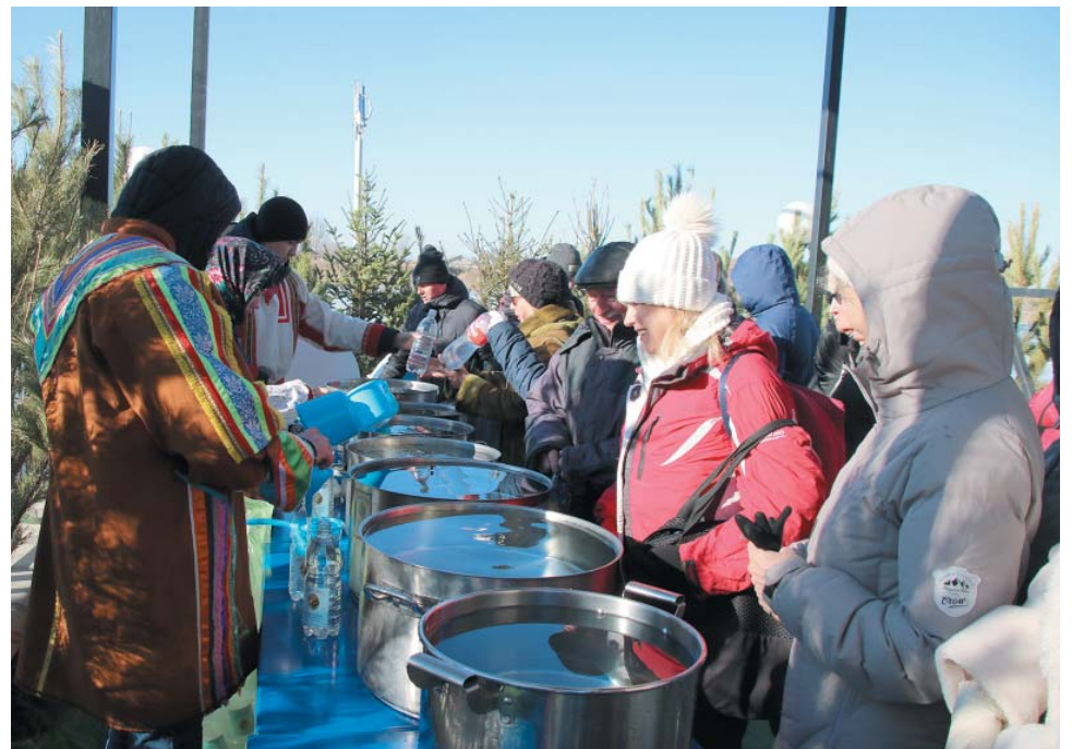
Крещенскую воду раздавали молодые работницы ООО «Газпром добыча Астрахань»