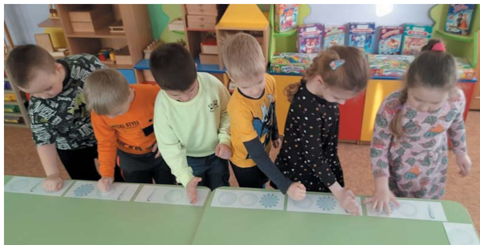
Занятие по нейрогимнастике

Что делать при задержке речевого развития ребёнка? Известно, что речь малыша формируется в общении с окружающими его взрослыми. На помощь родителям с радостью приходят педагоги. В ЧДОУ «ЦРР – детский сад «Мир детства» в работе с детьми 3–7 лет успешно реализуется инновационный коррекционно-развивающий проект «Речь на кончиках пальцев» здоровьесберегающей направленности, разработанный учителями-логопедами.