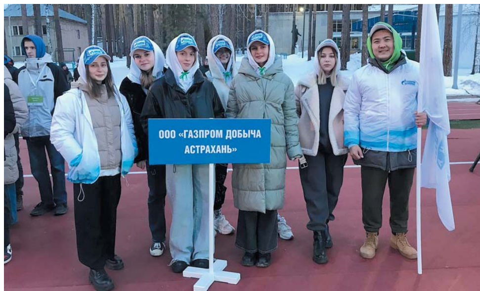
Делегация ООО «Газпром добыча Астрахань» на Первом Экологическом лагере ПАО «Газпром», 2022 год