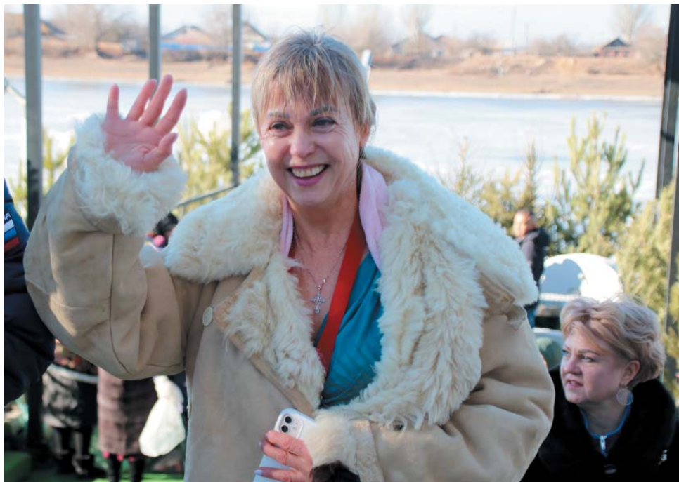
Крещенские купания – заряд бодрости на весь год