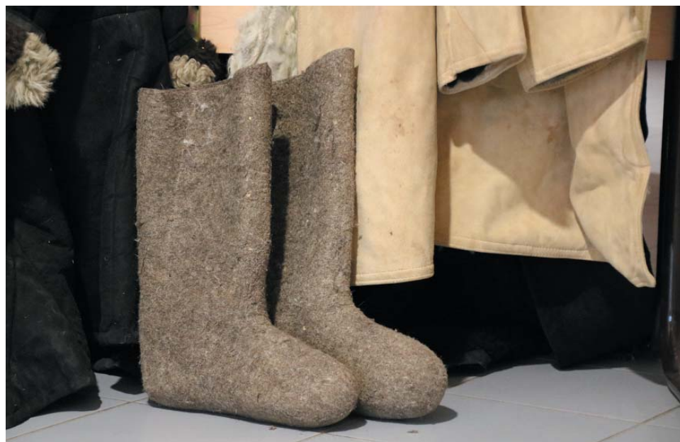
Все купальщики получили соответствующую мероприятию экипировку