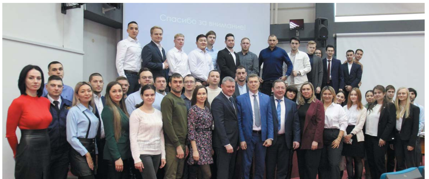
Общее фото участников отчётной конференции Совета молодых учёных и специалистов ООО «Газпром добыча Астрахань»