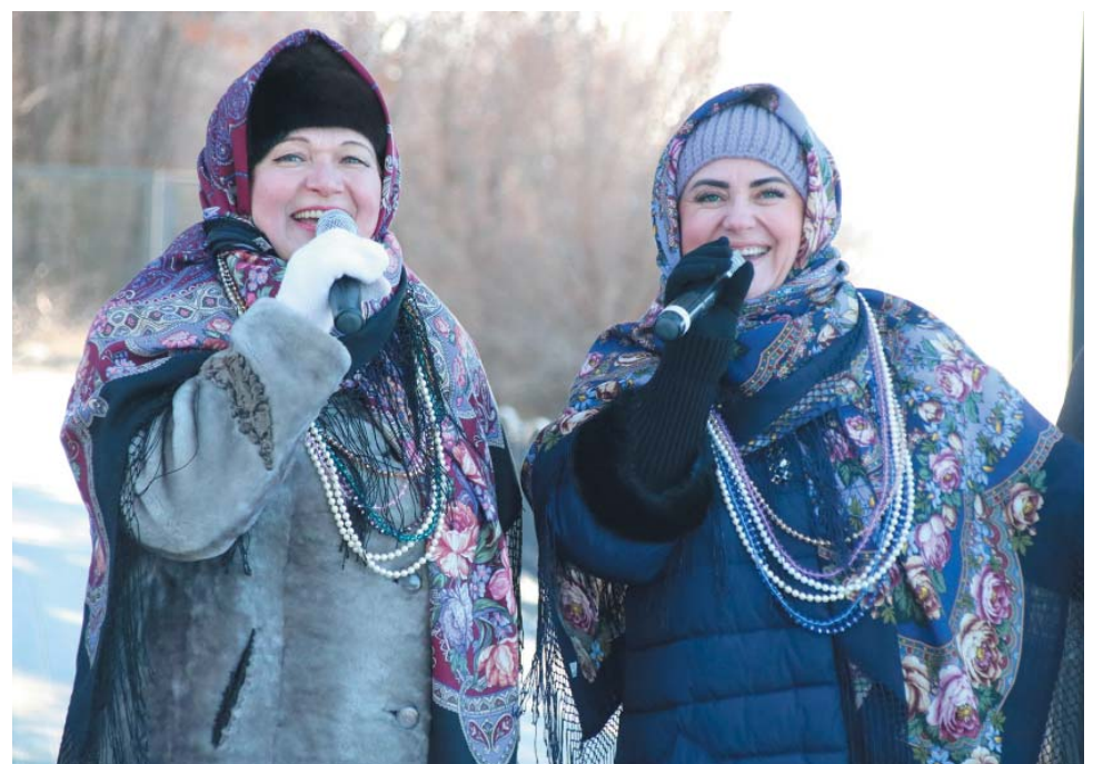
Праздничное настроение поддерживали солисты Культурно-спортивного центра