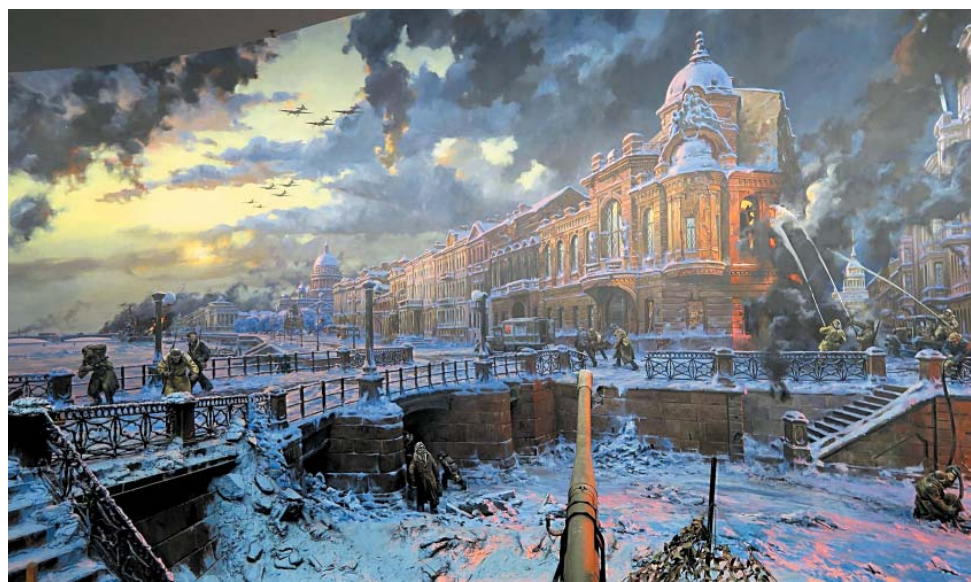
Фрагмент диорамы «Блокада Ленинграда», Е. Корнеев

Утром 14 января 1944 года ленинградцев разбудил гул оглушительной канонады. Масштабная артподготовка, которая проводилась в районе Ораниенбаумского плацдарма советской артиллерией, стала началом крупной наступательной опера-