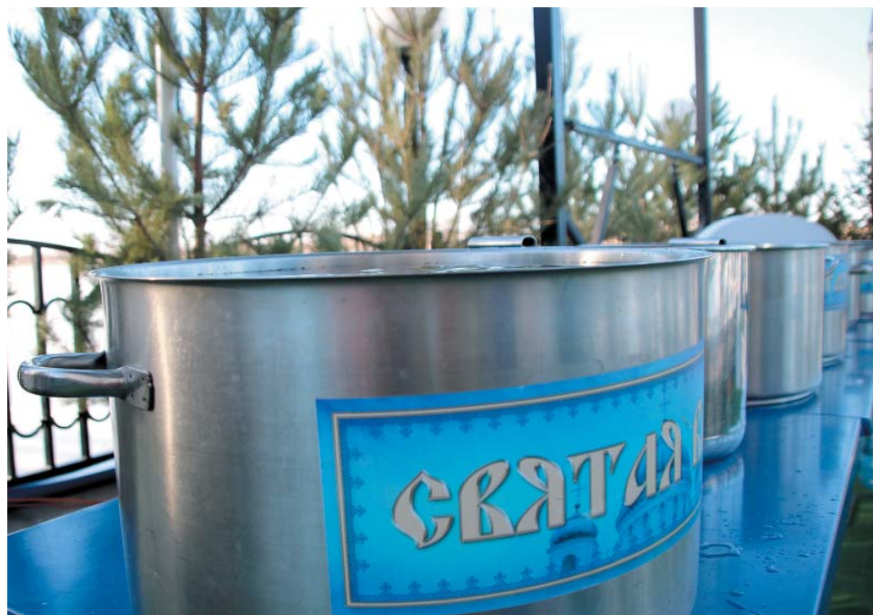
В праздник Крещения Господня проводится Великое освящение воды

Александр СМОЛЬКОВ