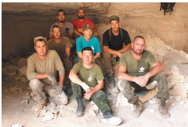
Цель экспедиции «Аджимушкай» – найти архив, способный наиболее точно определить хронологию событий тех лет

У каждого человека есть заветная мечта. Кто-то стремится покорить горную вершину, другой – совершить морское путешествие, третий грезит полётом на дельтаплане. У ребят из поискового отряда «Факел» Общества «Газпром добыча Астрахань» мечта особенная – шаг за шагом идти к тому дню, когда будет предан земле последний советский солдат Великой Отечественной войны. Для выполнения этой патриотической миссии входящие в состав «Факела» газодобытчики ежегодно принимают участие в поисковых экспедициях на местах ожесточённых сражений. В 2022 году отряд выезжал в четыре такие экспедиции.