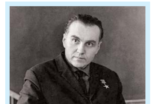
Василий Александрович Сухомлинский (1918–1970), педагог-новатор, детский писатель: – Истоки способностей, дарований детей находятся на кончиках их пальцев.

• Говорите со своим ребёнком! Используйте каждую минуту вместе – утреннее одевание и умывание, время, когда ведёте малыша в сад и обратно. Если вы играете с ребёнком, старайтесь привлекать его к активным действиям и вместе их проговаривать.