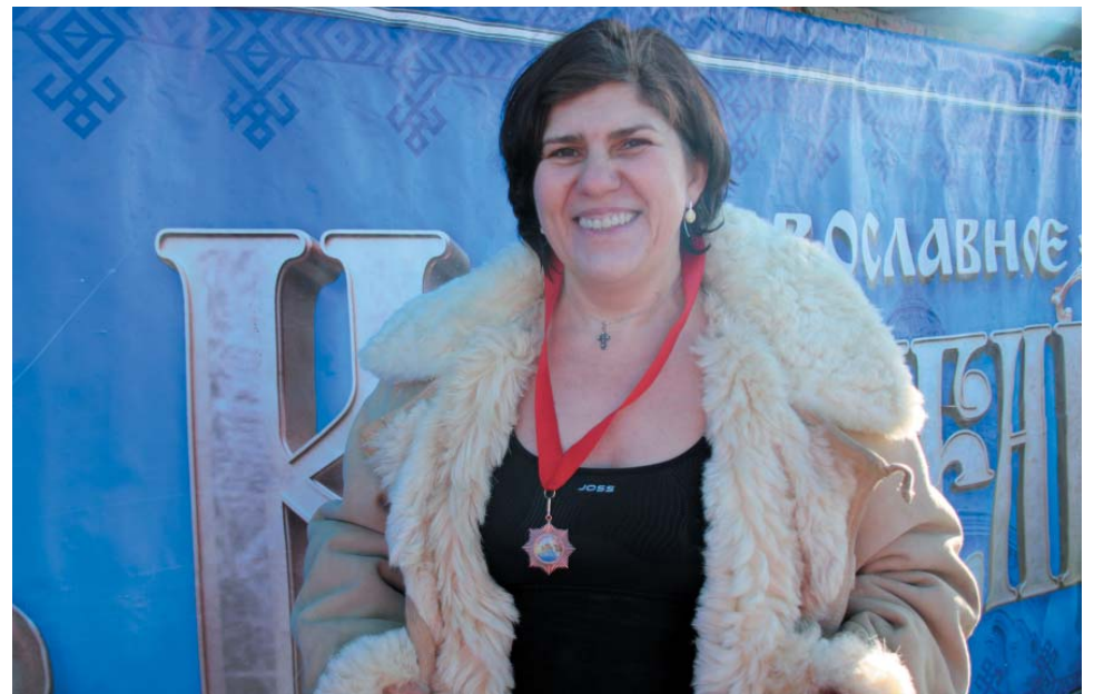
Первыми в иордань вошли работницы Общества