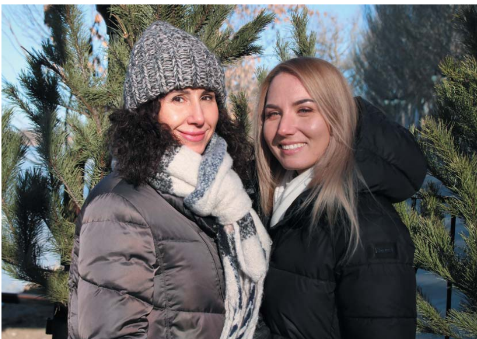
Многие газодобывчицы приехали поддержать коллег-купальщиц