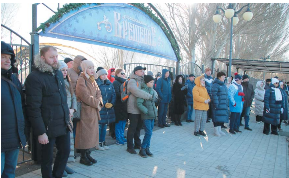
В этот день в ДОО имени А.С. Пушкина было организовано большое мероприятие