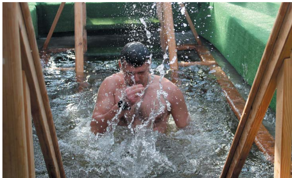
В этот день в крещенскую иордань окунулись около 500 работников Общества, сотрудников других предприятий Группы «Газпром» и жителей близлежащих населённых пунктов