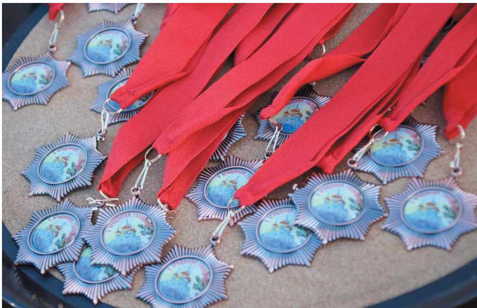
Все купальщицы получили на выходе из воды памятные медали