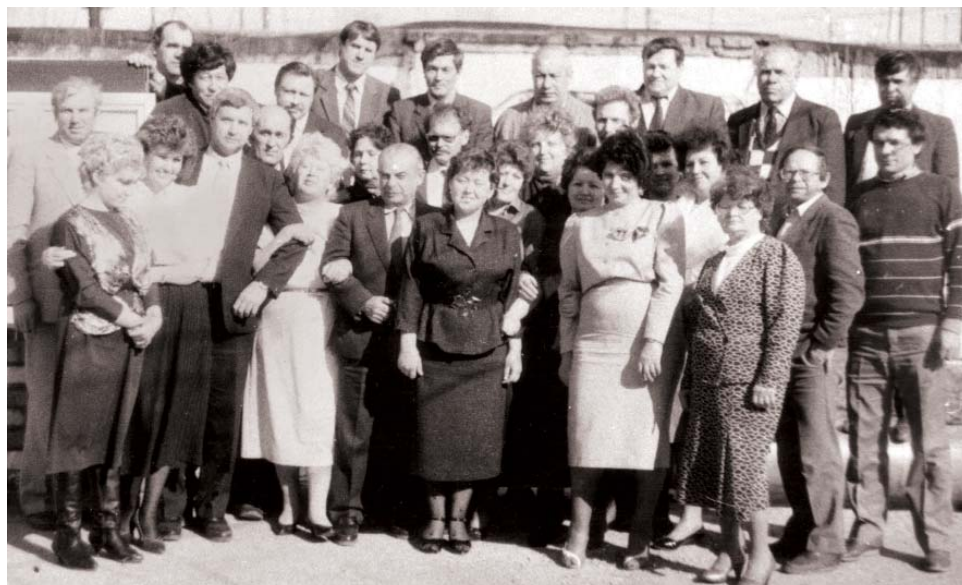
Трест «Астраханьбургаз», 1986 год