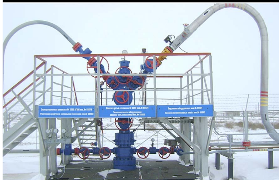
Планомерно ведутся работы по интенсификации притока газа