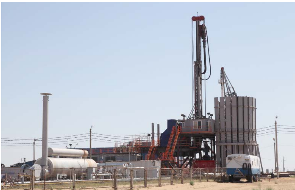
Новые технологические и технические решения внедряются при капитальном ремонте скважин

и физически устаревшего оборудования обязуюсь устье эксплуатационных скважин в рамках реализации проекта Реконструкции.