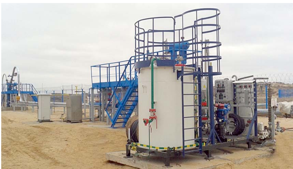
По программе импортозамещения на скважине № 617 смонтирован блок дозирования реагента

Безусловно, все достижения Общества – результат грамотного руководства и управления предприятием, а также высокого уровня профессионального мастерства работников, немалую долю которых составляют промысловики! Скоро станет историей 2018 год. В производственном календаре ГПУ он был успешным и плодотворным. В этом году промысловики заложили фундамент для новых дел, которые им предстоит воплотить в жизнь в новом 2019 году и в более отдалённой перспективе.