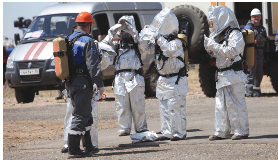
Показательные тактико-специальные учения на эксплуатационной скважине