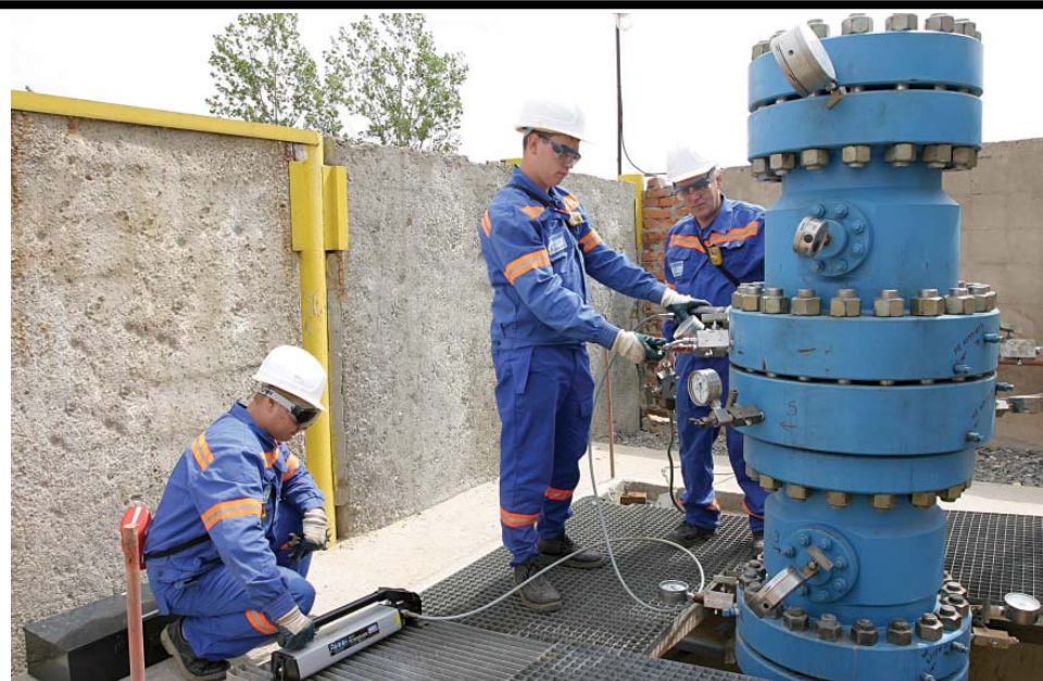
Лаборатория новой техники успешно прошла сертификацию ИНТЕРГАЗСЕРТ