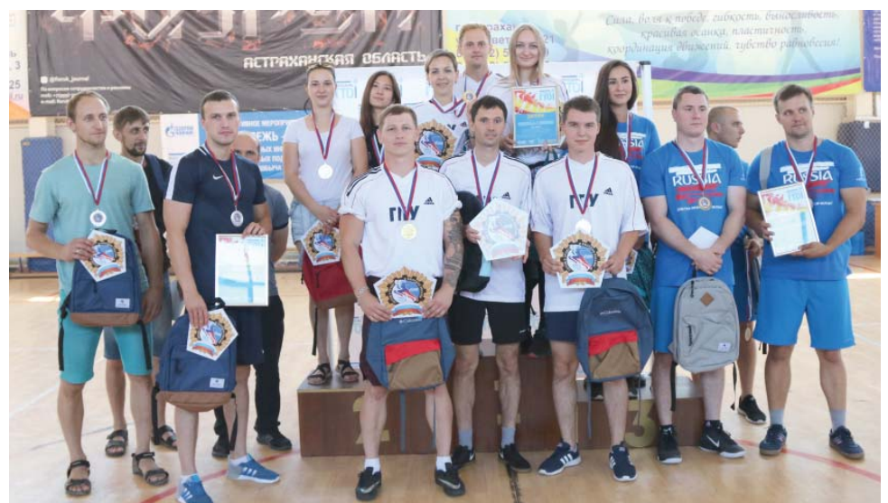
Команда молодых работников ГПУ – победитель спортивного мероприятия «Молодёжь + ГТО»