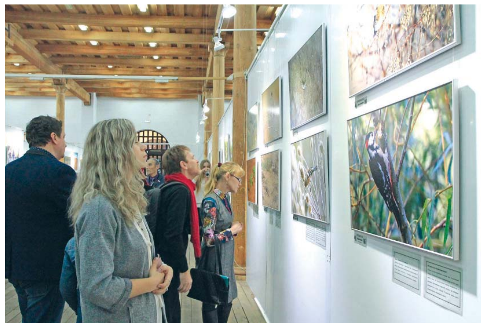
Выставка будет работать до 27 января 2019 года