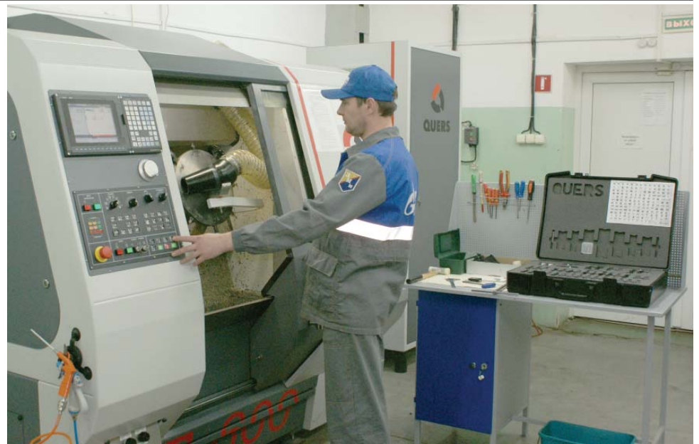
С помощью станка с ЧПУ промышленные объекты обеспечены деталями собственного производства

На базе Газопромыслового управления организовано и успешно функционирует производство деталей собственного изготовления для импортного насосно-ком-