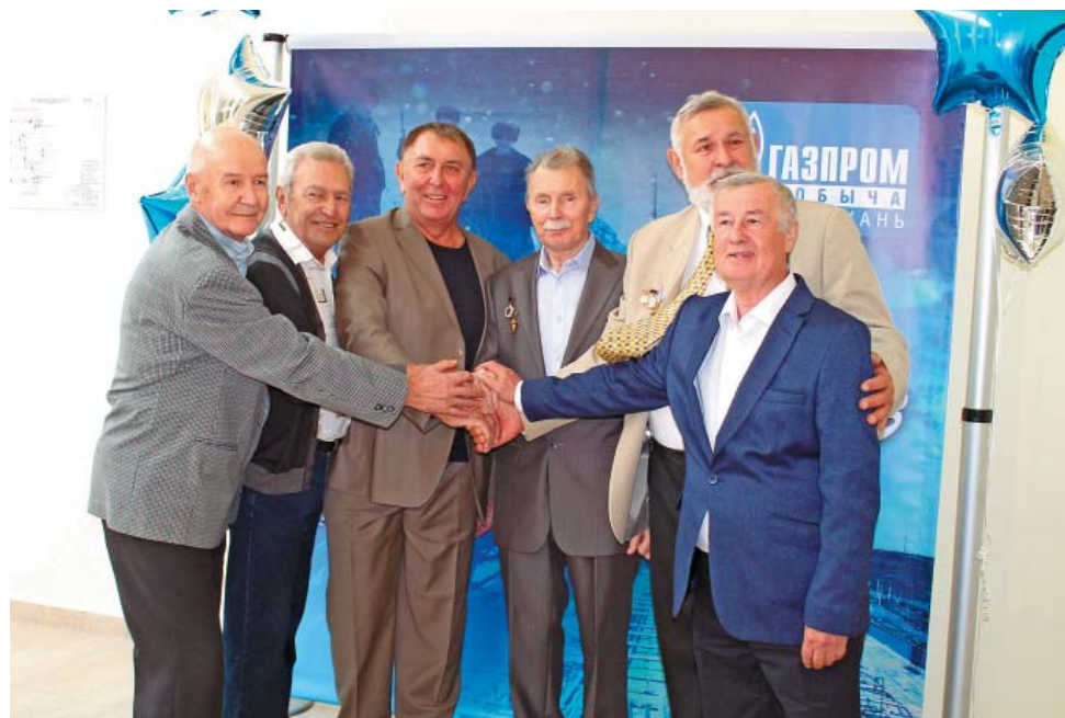
Газпромская дружба не стареет

Праздничный концерт представлял собой вечер воспоминаний. На экране периодически демонстрировались фильмы, «сотканые» из видеосюжетов и фотографий прошлых лет, подготовленные творческой редакцией «Канала 7+». И, конечно, неоценимую помощь в создании роликов оказали сами первопроходцы.