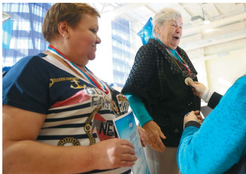
Самые активные удостоены наград и дипломов