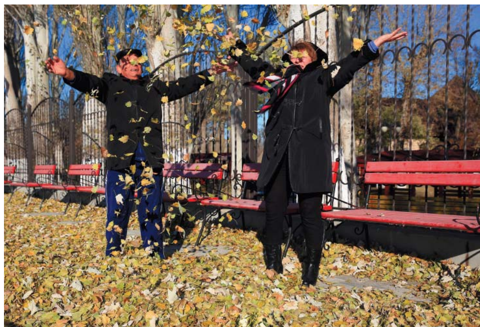
И молоды душой...