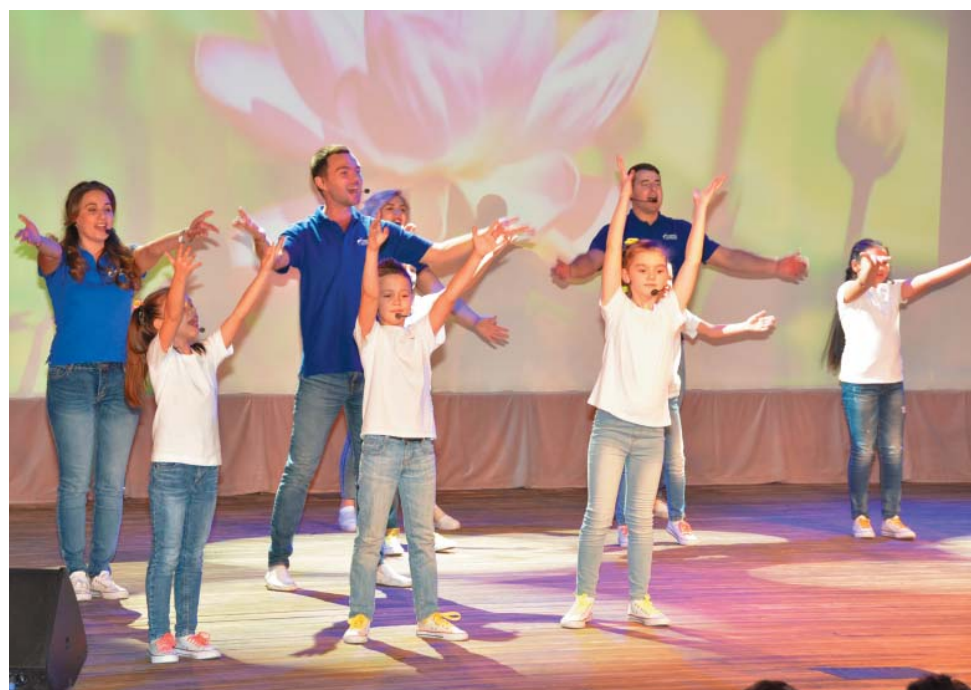
Творческий подарок от молодёжи

Вот и подошёл к концу первый «Слёт первопроходцев». Судя по улыбкам на лицах и аплодисментам зала, он никого не оставил равнодушным. «До новых встреч!» – говорили ветераны, столько положительных эмоций они почерпнули. И, без сомнения, они будут ждать следующих встреч.