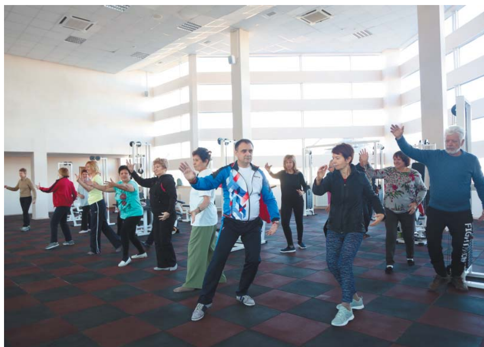
Китайская гимнастика ушу – почти что танец