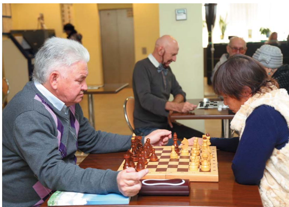
Первопроходцы удивили интеллектом в шахматных и шашечных партиях