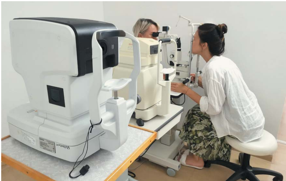
В здравнице применяются базовые и расширенные лечебные программы санаторно-курортного лечения для разных возрастных групп