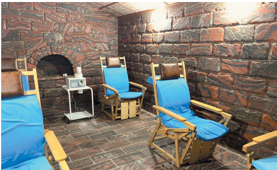
Галокамера обеспечивает не только лечебный эффект, но и качественную психоэмоциональную разгрузку

– Отдыхаю в санатории уже не первый раз. Приезжаем сюда всей семьёй. Мы любим проводить время на пляже у моря и гулять в парковой зоне. Здесь всегда красиво: много ярких цветущих клумб, уютные беседки, дендропарк со множеством реликтовых деревьев, липовые и кленовые аллеи. Дети любят наблюдать за павлинами, которые величественно прогуливаются по парку. Нравится, что территория оборудована спортивными и детскими площадками, где можно поиграть с детьми, есть тренажёрный зал и современный бассейн. Замечу, что в санаторий я приезжаю не только за качественным отдыхом, но и за передовым медицинским лечением. Мне нравится, что здесь к каждому гостю индивидуальный подход, с учётом пожеланий и назначений врачей. Причём лечат здесь не только взрослых, но и детей. Хочется сказать руководству предприятия и санатория огромное спасибо за то, что заботятся о здоровье и благополучии семей своих сотрудников.