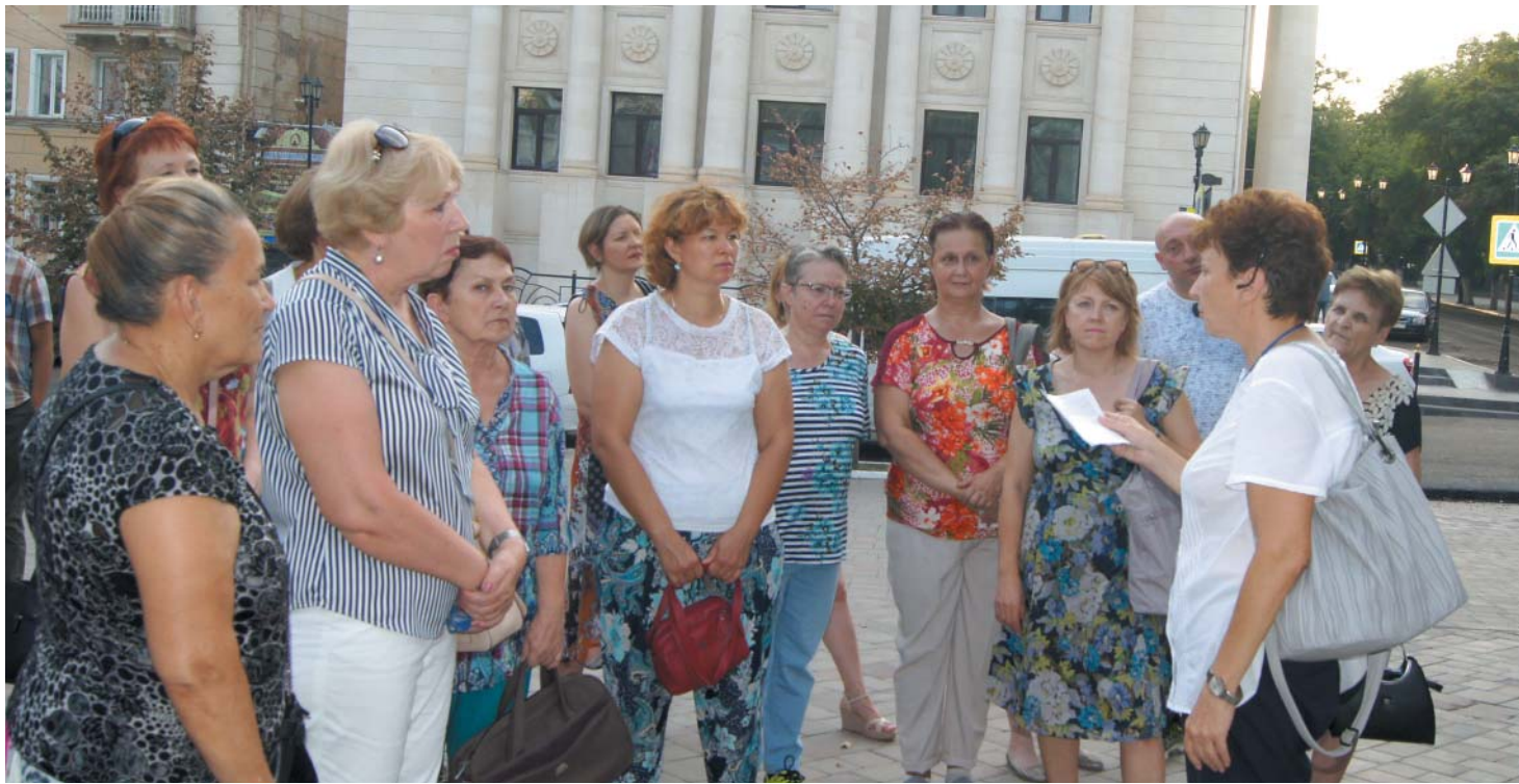
Экскурсионный маршрут пролегал через исторический центр города Астрахани

Музей ООО «Газпром добыча Астрахань» реализует проект «Параллельные истории», в ходе которого пришедшие на экскурсию горожане узнают не только об исторических памятниках в центре города, но и о добыче газа в регионе.