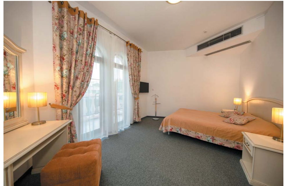
Номерной фонд санатория славится своим удобством и уютом

щихся держат под контролем спасатели. Для юных гостей оборудована детская развлекательная зона, а в летнее время с ними работают аниматоры. В санатории купальный сезон в среднем составляет 5 месяцев: с 15 мая по 15 октября, температура воды колеблется от 15 до 27 градусов по Цельсию. Соответственно, за качеством морской воды у нас ведётся постоянный контроль, причём лабораторные наблюдения проводят как в зоне влияния глубоководных сооружений, так и в зонах использования плавательных средств и непосредственно купания. Ежегодно перед открытием пляжного сезона производится осмотр и обследование дна акватории, очистка его от мусора и посторонних предметов, техническое обследование глубоководных трубопроводов, анализ состояния пляжеудерживающих и берегозащитных сооружений.