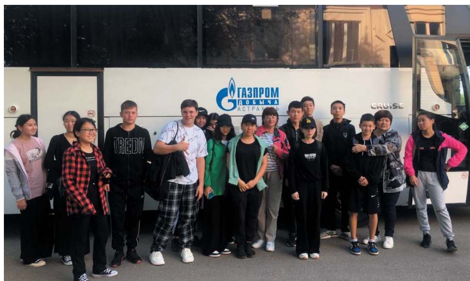
Прибытие ребят в биосферный заповедник

34 школьника в возрасте 14–15 лет и четыре сопровождающих педагога отправились в путь. Погода была замечательной. Пригревало солнце, лёгкой прохладой обдавал тёплый осенний ветер. По рассказам участников поездки, создавалось ощущение, что дети попали в райский уголок. Тишина и покой, ухоженная территория, уютные веранды, чудесные аллеи... В небе парили птицы: кобчики, скопы. Обучающиеся посчастливилось увидеть даже орлана-белохвоста – хозяина волжской дельты.