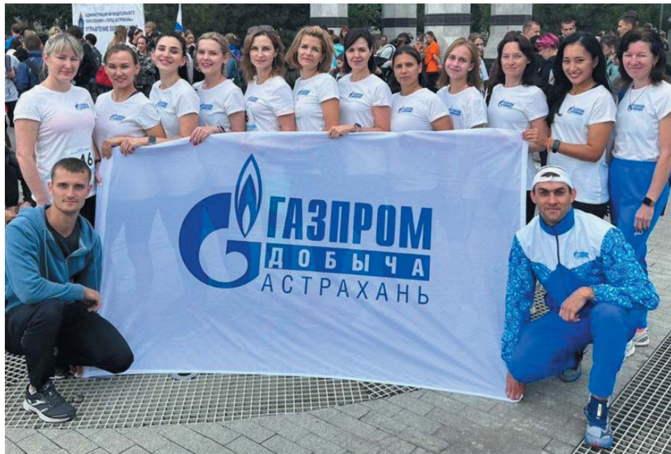
Команда Общества стала абсолютным чемпионом среди групп коллективов физической культуры и спортклубов на городской легкоатлетической эстафете

Легкоатлеты ООО «Газпром добыча Астрахань» приняли участие сразу в нескольких соревнованиях как городского, так и федерального уровня.