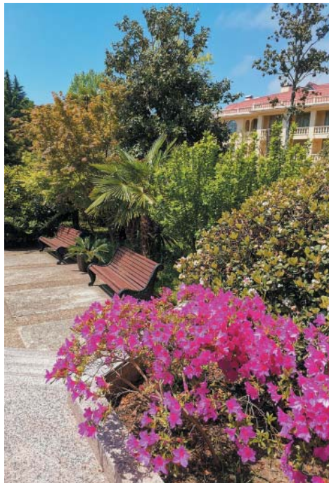
Территория санатория создана для комфортного отдыха и долгих прогулок

Отдельное огромное спасибо медикам. Отличная лечебная база даст заряд сил