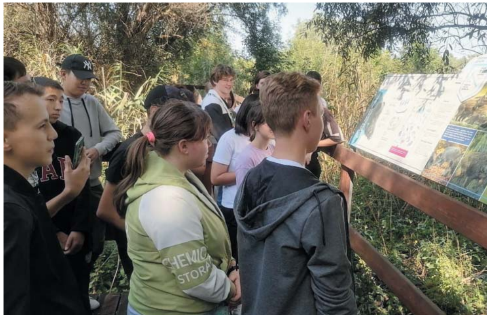
Путешествие по экологической тропе

ООО «Газпром добыча Астрахань» связывают давние партнёрские отношения с Красноярским районом, на территории которого Общество уже четыре десятка лет осуществляет свою производственную деятельность. Сотрудничество, имеющее давнюю историю, проявляется в самых разных аспектах. Это помощь образовательным, медицинским, религиозным учреждениям, общественным организациям, установка спортивных, детских площадок и многое другое. Так, 21 сентября ООО «Газпром добыча Астрахань» совместно с Неправительственным экологическим фондом имени В.И. Вернадского предоставило возможность посетить Астраханский биосферный заповедник 34 школьникам из МБОУ «Красноярская СОШ № 2» и МБОУ «Кривобузанская ООШ».