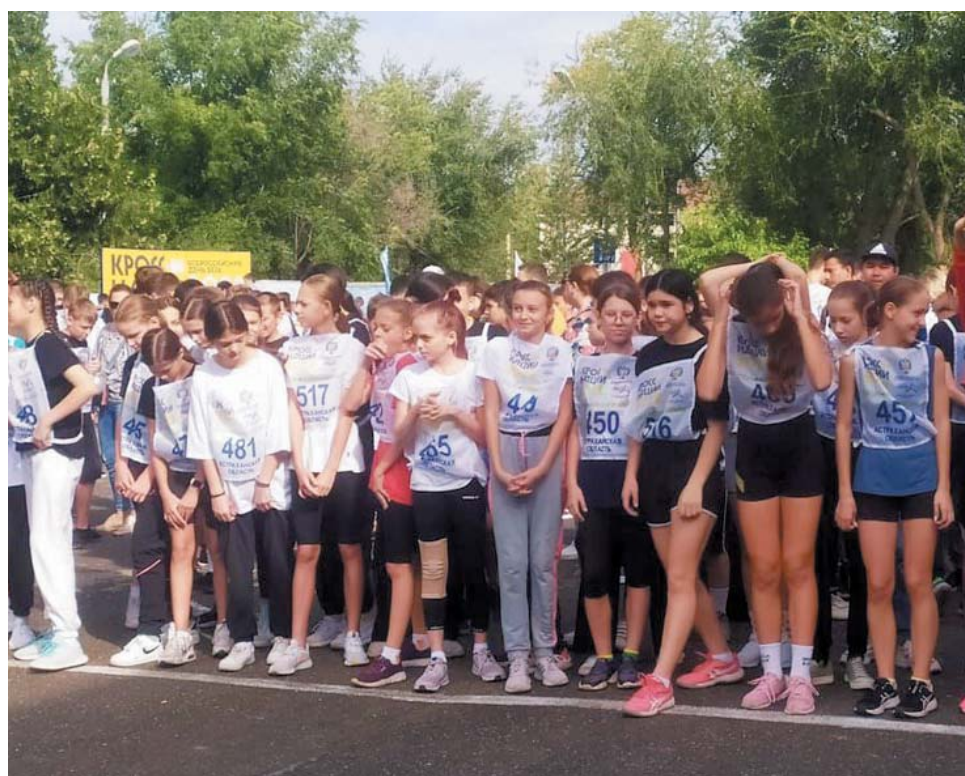
Перед стартом Всероссийских соревнований «Кросс нации» в Астраханской области

Добавим, что впервые общегородская легкоатлетическая эстафета состоялась 60 лет назад. В этом году её организатором традиционно выступила администрация