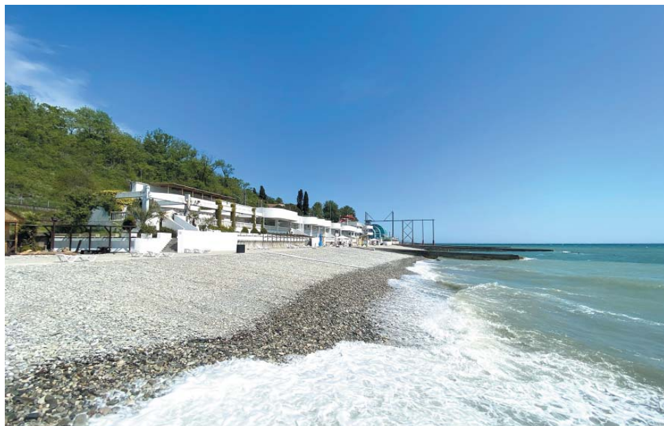
Чистое море, благоустроенная пляжная территория всегда к услугам гостей санатория