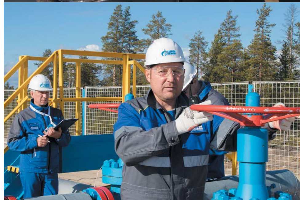
Общество «Газпром добыча Астрахань» на Фестивале труда ПАО «Газпром» представляли четыре работника