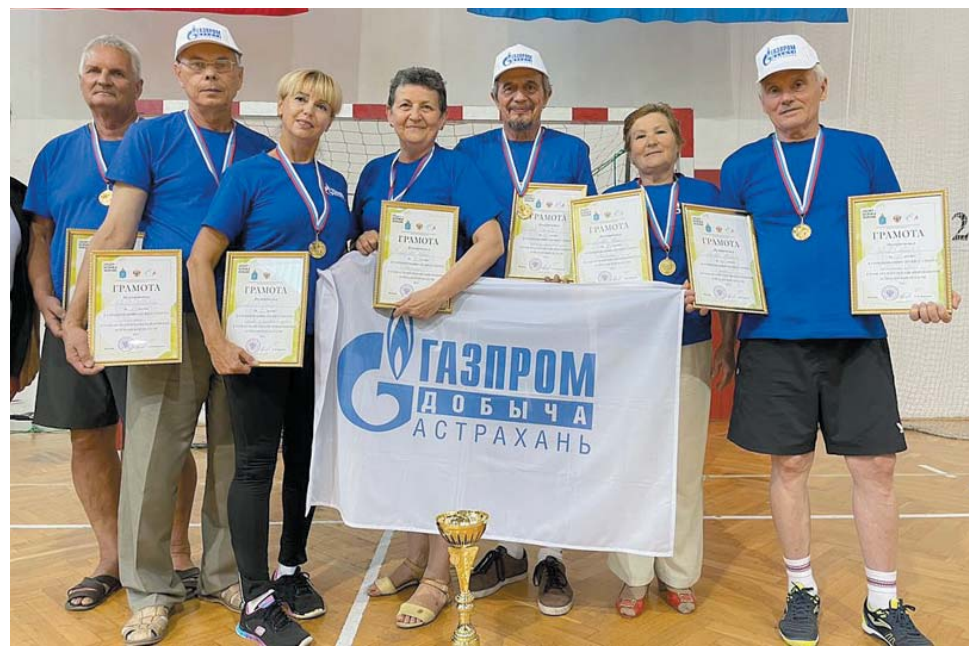
Команда пенсионеров Общества с заслуженными наградами

Таким образом, наша сборная команда одержала победу в четырёх из шести видов программы Спартакиады – стрельбе, настольном теннисе, плавании и шах-