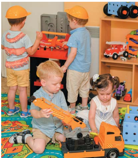
В ЧДОУ «ЦРР – д/с «Мир детства» реализуется познавательный проект «Безопасная дорога детства»