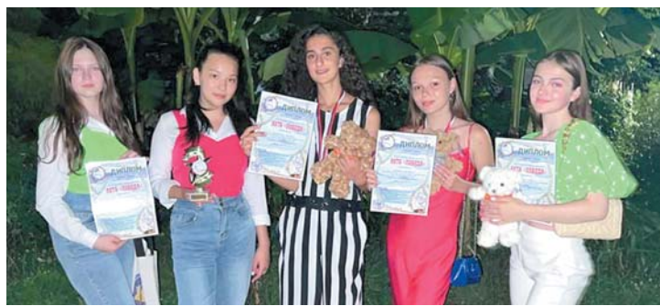
Старшая группа Эстрадно-джазовой студии Rich Sound

Образцовый коллектив Эстрадно-джазовая студия Rich Sound КСЦ ООО «Газпром добыча Астрахань» принял участие в Международном конкурсе-фестивале детского и юношеского творчества «Яхта «Победа», который прошёл в городе Сочи в начале июля.