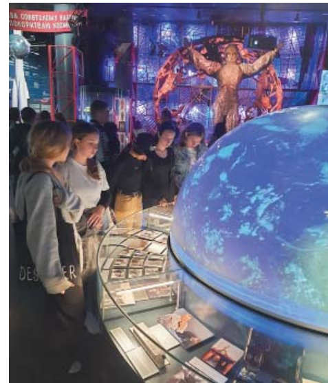
В Музее космонавтики

В Музее космонавтики ребята увидели образцы и макеты космической техники, одежду, снаряжение и личные вещи космонавтов, разнообразные тренажёры, аналогичные тем, на которых сейчас отрабатывают необходимые в полёте навыки в Центре подготовки космонавтов. Узнали, как в Центре управления полётами отслеживают работу космических станций, побывали в кабине многоэтажного орбитального корабля «Буран».