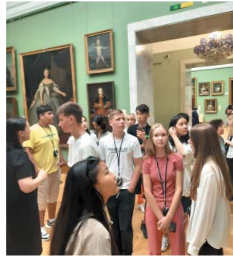
Юные астраханцы в Третьяковской галерее

На этой неделе, в среду, группа астраханских школьников вернулась из экскурсионного тура «Московская классика». Сорок четыре старшеклассника в возрасте от 15 до 16 лет смогли посетить столицу благодаря реализации в ООО «Газпром добыча Астрахань» Программы мероприятий по организации отдыха и оздоровления детей работников Общества в период школьных каникул 2022 года. Организатором познавательной поездки выступил отдел социального развития Общества.