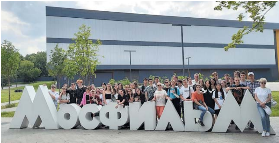
Семидневная поездка стала для астраханских школьников временем открытий и познания нового