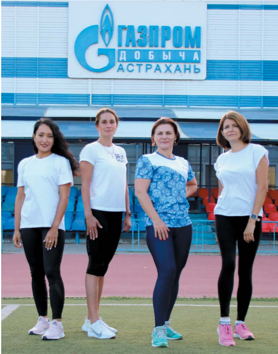
Женская команда ООО «Газпром добыча Астрахань» по лёгкой атлетике

Как известно, лёгкую атлетику называют королевой спорта, а бег входил в программу состязаний самых первых Олимпийских игр, которые проводились в Древней Греции ещё в 776 году до н.э. Войдут соревнования по лёгкой атлетике и в программу Летней Спартакиады ПАО «Газпром», которая пройдёт с 6 по 13 августа 2022 года в Санкт-Петербурге. Общество «Газпром добыча Астрахань» в этой дисциплине представят восемь работников, по четыре спортсмена в женских и мужских стартах.