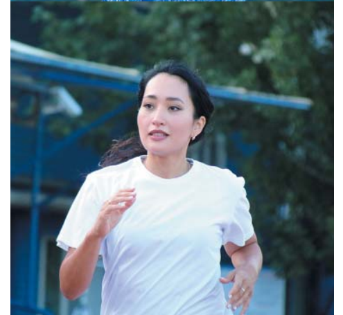
Участницы женской команды по лёгкой атлетике тренируются 4 раза в неделю