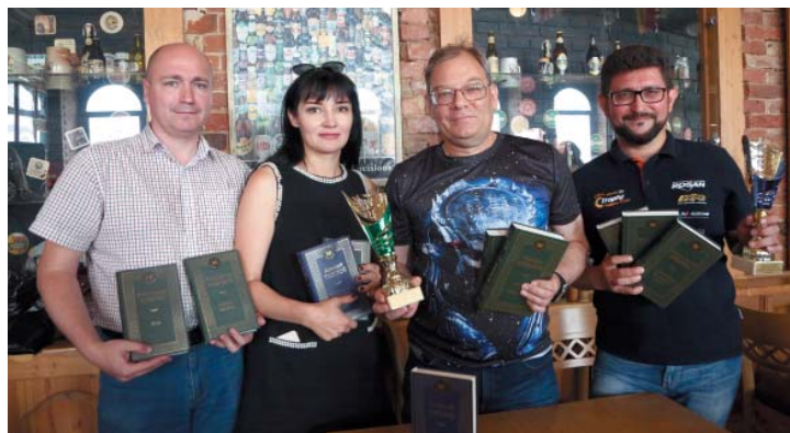
В категории «Друзья завода» второй раз подряд праздновала победу команда ССОиСМИ Общества, в которую вошли сотрудники газеты «Пульс Аксарайска» и редакции телерадиовещания «Канал 7+»