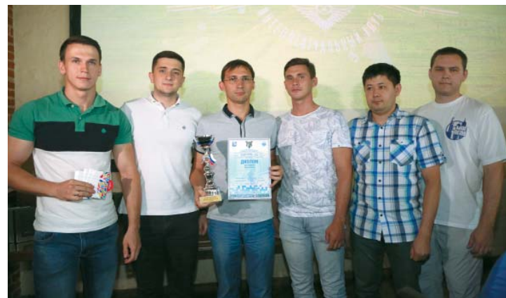
Производство № 5 – победители турнира «Гран-при Лета» серии интеллектуально-познавательных игр «Эрудит-2018» на Кубок АГПЗ