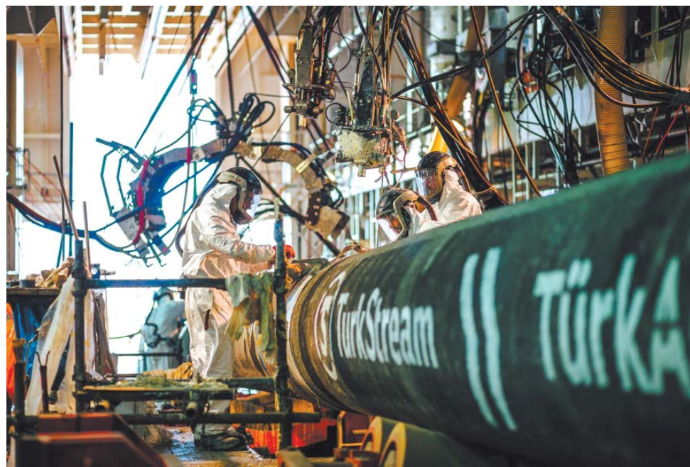
Строительство газопровода «Турецкий поток»

В 2017 году, в преддверии начала отопительного сезона, «Газпром» дополнительно арендовал мощности ПХГ в Европе, тем самым увеличив объём активного хранения газа в регионе до 8,6 млрд куб. м, что помогло удовлетворить пиковый спрос на газ в Европе во время сильных холодов.