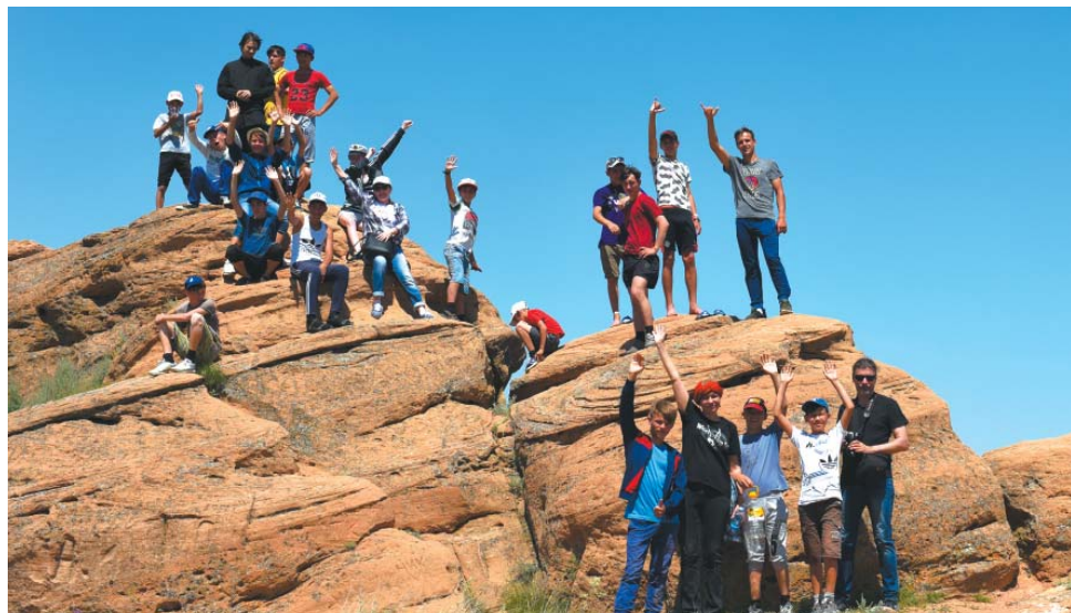
Путешествие на гору Богдо и озеро Баскунчак

– Гора Большое Богдо – самая крупная форма рельефа на территории Северного Прикаспия, она является уникальным природным объектом, на территории которой сохранилась реликтовая флора и фау-