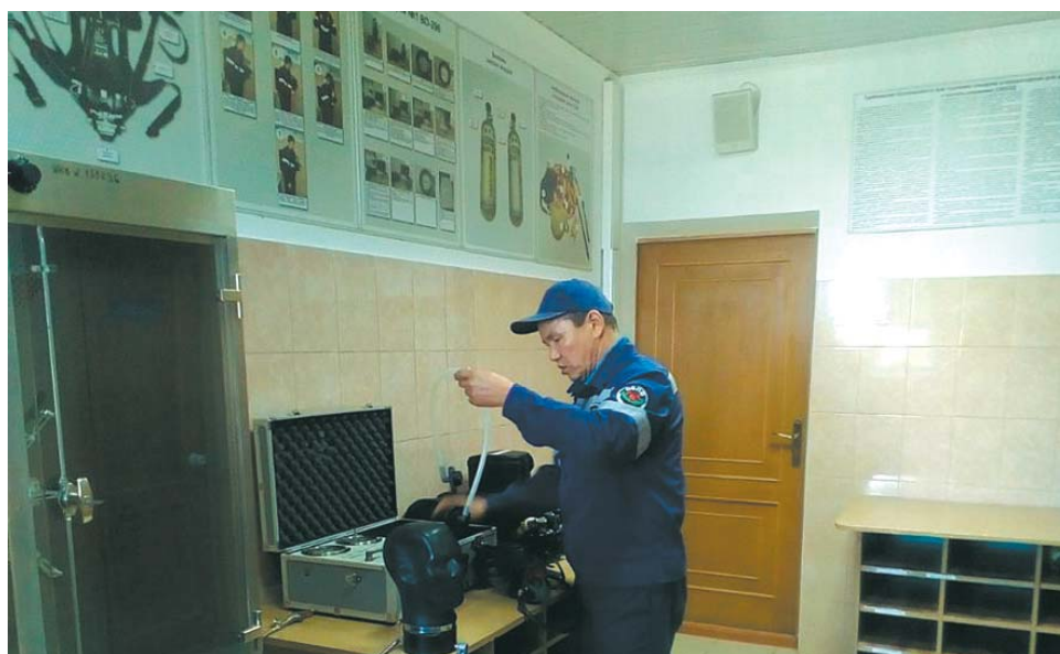
В помещении поста ГДЗС ведомственной пожарной части по охране объектов ГПУ

Следует отметить, что обычно в конкурсе основными соперниками были ведомственная пожарная часть по тушению крупных пожаров и ведомственная пожарная часть по охране объектов АГПЗ. Од-