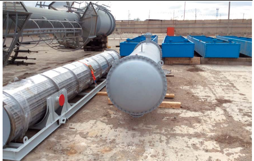
Оборудование на открытой площадке базы хранения УМТСиК (пучок трубный, теплообменник и секции аппаратов воздушного охлаждения) готово к выдаче на АГПЗ

Тем не менее, повторю, минувший год Управление завершило достойно. Самое главное наше достижение – обеспечение поставок необходимых химических реагентов, катализаторов – то есть материалов, требуемых для обеспечения непрерывности технологического процесса. Очень трудно было отработать эти поставки в пе-