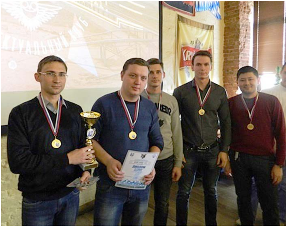
Команда Производства № 5 – победитель Гран-при зимы

На Астраханском газоперерабатывающем заводе завершился открытый интеллектуально-познавательный турнир «Эрудит завода-2017», стартовавший ещё весной этого года. В увлекательном состязании знатоков приняли участие 14 команд, представлявших производства, службы и цеха АГПЗ, а также четыре коллектива из других структурных подразделений ООО «Газпром добыча Астрахань».