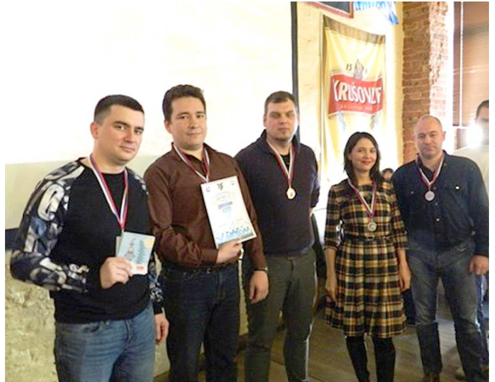
Команда Заводоуправления – победитель турнира «Эрудит завода-2017»

Не подкачал и спортивный аспект – до самого последнего этапа сохранялась интрига, кто станет призёром тур-