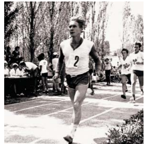
Летняя спартакиада ПО «Астраханьгазпром», 1988 год

На базе спортивного комплекса по улице Социалистической и в арендуемых залах, тирах и бассейнах проводятся учебно-тренировочные занятия по волейболу,