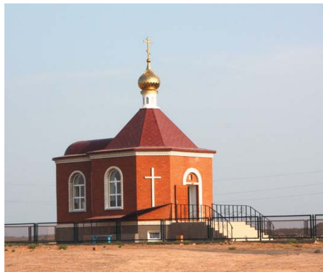
Храм Св. Пантелеимона в с. Ватажное