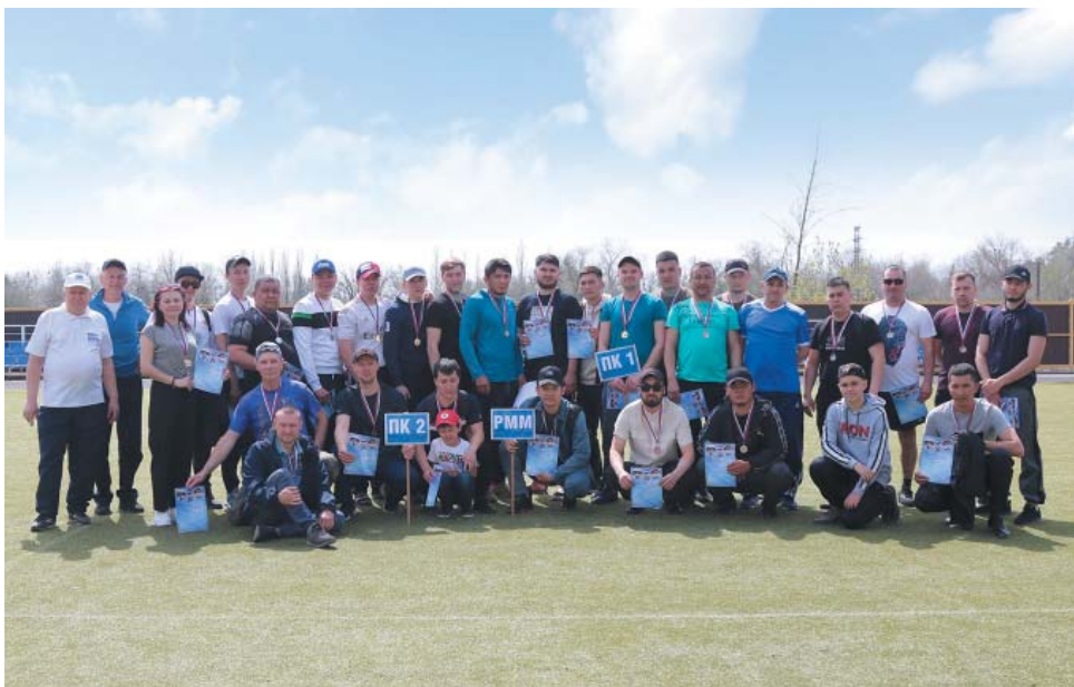
Спартакиада Управления технологического транспорта и спецтехники в ДОЦ им. А.С. Пушкина