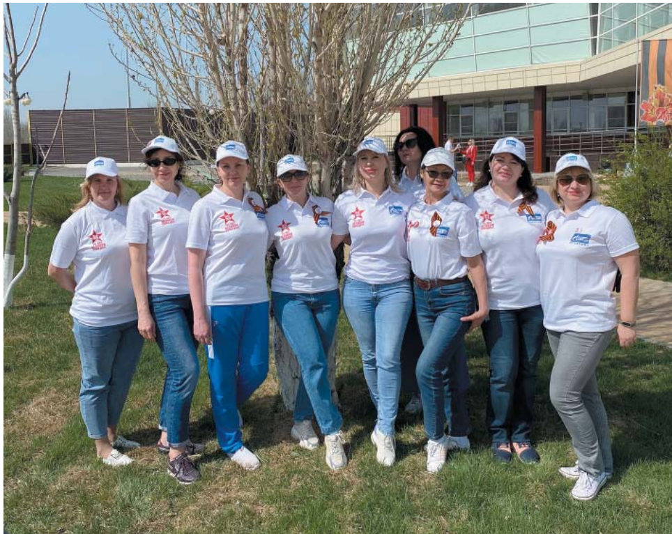
На закладке берёзовой аллеи в ДОЦ им. А.С. Пушкина

спортивным балетным танцам «Весенний бал». Кроме того, мы участвовали в организации открытого турнира по теннису и ежегодного соревнования по спортивному ориентированию «Кубок Победы» и финансировали ряд мероприятий, организованных Управлением кадров администрации Общества и Советом молодых учёных и специалистов. Также в Детском оздоровительном центре им. А.С. Пушкина состоялось мероприятие «Весенний пикник». Общая сумма финансирования этих и других мероприятий составила за год около семи миллионов рублей. Кроме того, что касается ДОЦ им. А.С. Пушкина, мы ежегодно выделяем порядка 500 тысяч рублей на обновление материально-технической базы центра, а весной этого года внесли свою лепту в его озеленение. В рамках субботника я и председатели всех первичных профсоюзных организаций Общества заложили перед главным корпусом берёзовую аллею. Подошли мы к этому вопросу ответственно: сделали выемку грунта, завезли землю, и, как нам сказали специалисты, деревья уже прижились.