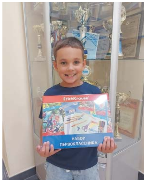
Вручение подарков к 1 сентября в Управлении связи