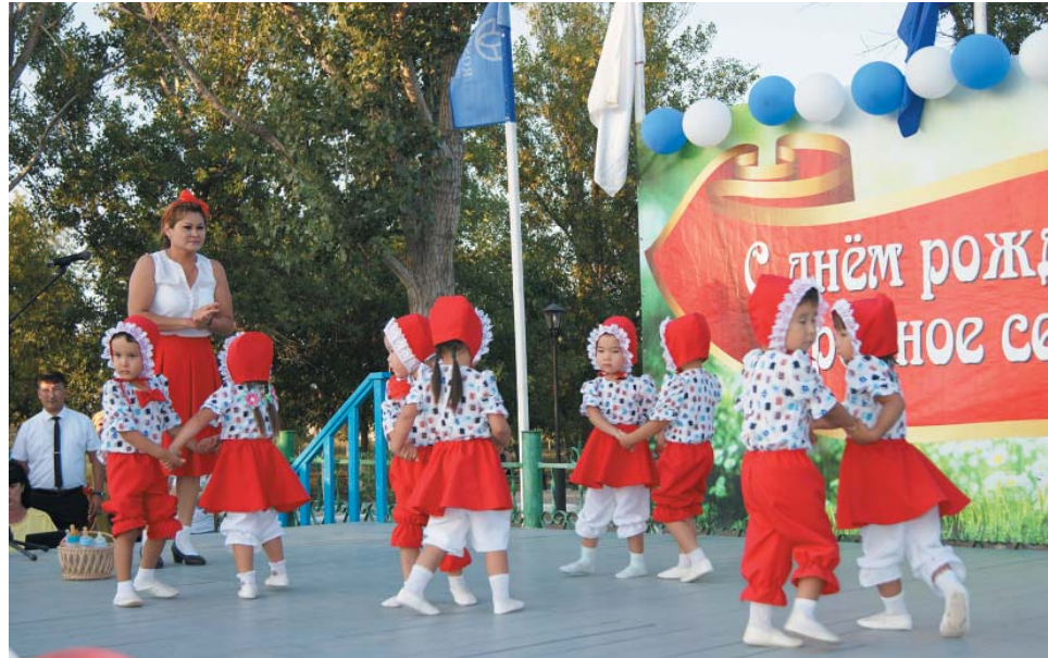
Концерт по случаю празднования Дня села