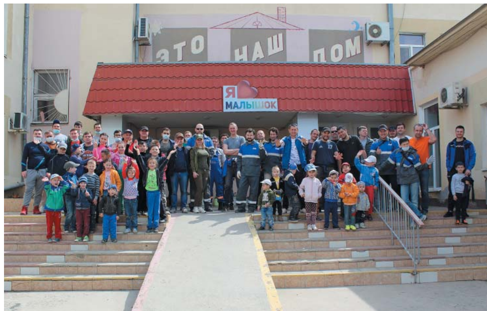
Коллектив Газпромышленного управления на субботнике в детском доме «Малышок»

– Несмотря на периодическое введение ограничений по количеству участников и зрителей, часть запланированных спортивных и культурных мероприятий мы провести успели. Так, с сентября 2020-го по август 2021 года состоялись три турнира по гиревому спорту, спартакиады Управления технологического транспорта и специальной техники, Военизированной части и Отряда ведомственной пожарной охраны, турниры по быстрому шахматам, пулевой стрельбе и настольному теннису, а также ежегодный Российский турнир по