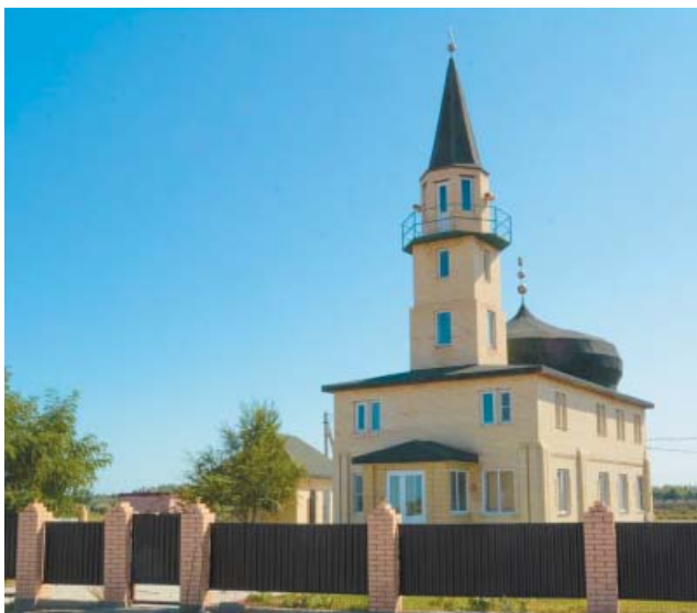
Мечеть с. Ватажное