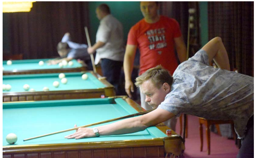
Напряжённая борьба развернулась на всех бильярдных столах

– Бильярд – один из любимых видов спорта в ООО «Газпром добыча Астрахань», он является одной из дисциплин спартакиады руководителей. На этом турнире наша цель – выявить сильнейших для формирования сборных команд Общества и участия в других соревнованиях, – рассказал корреспонденту «Пульса