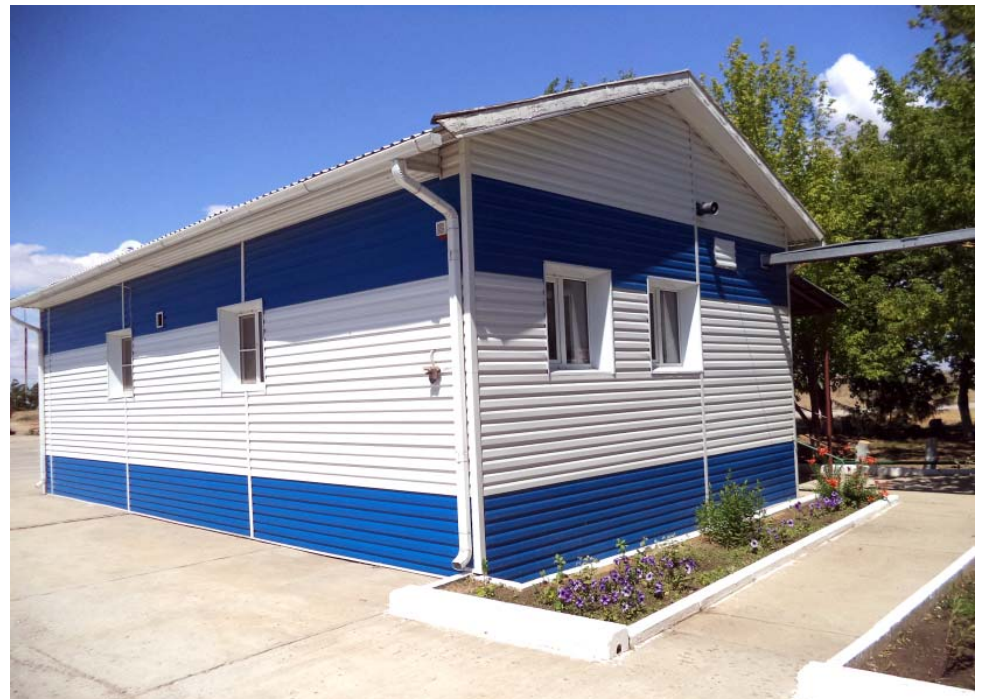
АБК УПТР: здесь решено применить в перспективе неординарное техническое решение по ремонту системы отопления и водоснабжения с использованием альтернативных источников тепловой энергии

В летний период кондиционировать АБК будут фан-котлы. Прохлада к ним станет поступать всё от того же теплообменника компрессорной установки (ведь как известно, геотермальный тепловой насос –