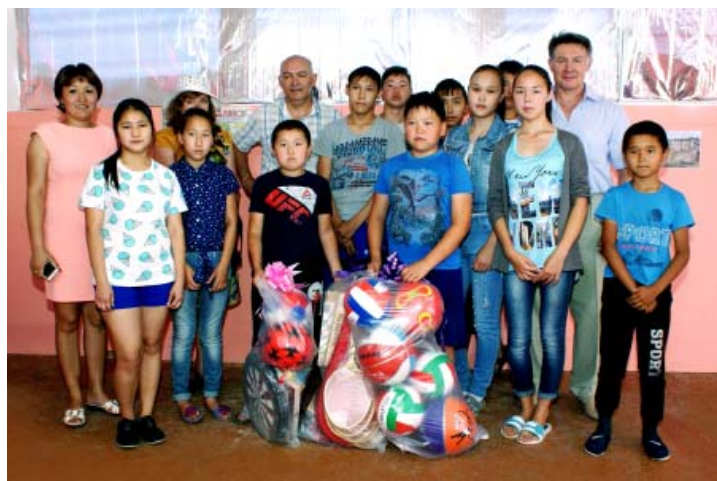
УПБ «Дружба» при МБОУ «Ахтубинская СОШ»

Говорят, что истинная дружба не знает ни времени суток, ни времени года. Этот афоризм полностью подтверждается и сложившимися шефскими отношениями астраханских газовиков со школами Красноярского района. И даже в период летних каникул, когда учебные заведения, казалось бы, «на замке», шефы из ООО «Газпром добыча Астрахань» находят возможность навестить своих подопечных и порадовать их нужными подарками.