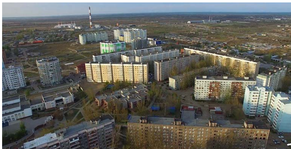
Микрорайон назван так в честь Семёна Петровича Бабаевского (1909–2000) – русского советского писателя и журналиста, лауреата трёх Сталинских премий

2016 год – приход храма инициировал проведение первого в г. Астрахани турнира по футболу среди воспитанников Воскресных школ.