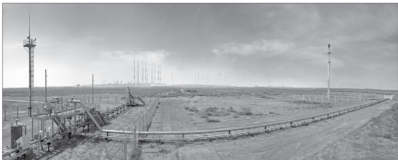
Вид на эксплуатационную скважину у завод.

инфраструктуры могло продолжаться только за счет прибыли промышленных предприятий.