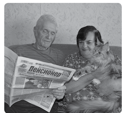
Пенсионер ВСЕГДА ПОДСКАЖЕТ

СПРАВОЧНИК Астраханского пенсионера Выпуск №1