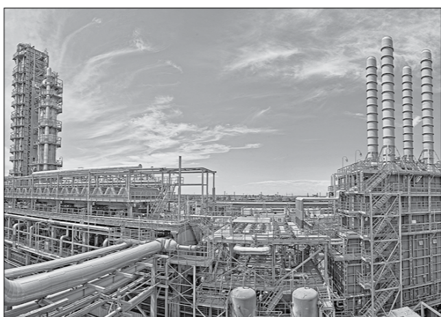
Установка подготовки сырья для каталитических процессов.