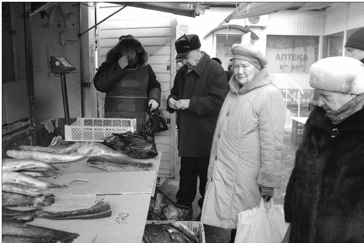
Почему дорожает рыба? Продавцы на мои вопросы отвечают спокойно: "Цену поднимают рыбаки". Рыбаки ли?

Теперь давайте все вместе подумаем, почему дорожает рыба. Ловится она у нас в