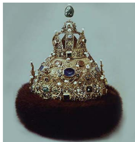
Шапка Астраханского царства (Оружейная палата)

«Шапкой Астраханского царства» называют венец, изготовленный, по одной версии, иностранными, вероятно восточными,