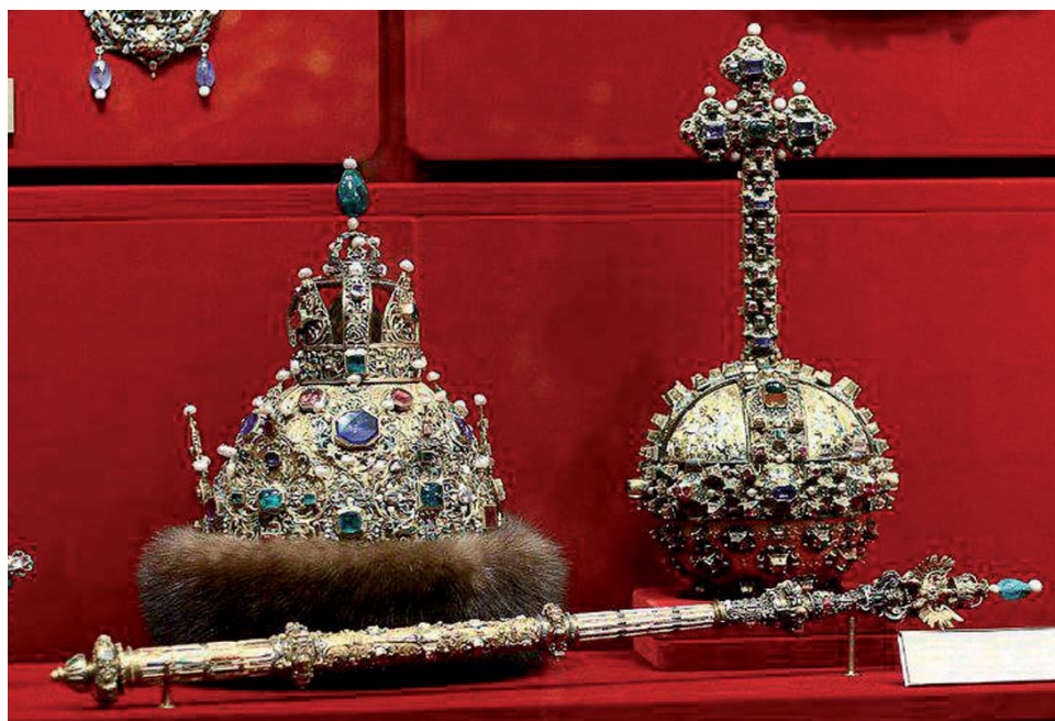
Венец из «большого наряда» М.Романова – шапка Астраханская, скипетр и держава Б.Годунова