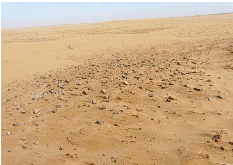
Фрагменты керамики эпохи бронзы на дне диффузионной котловины