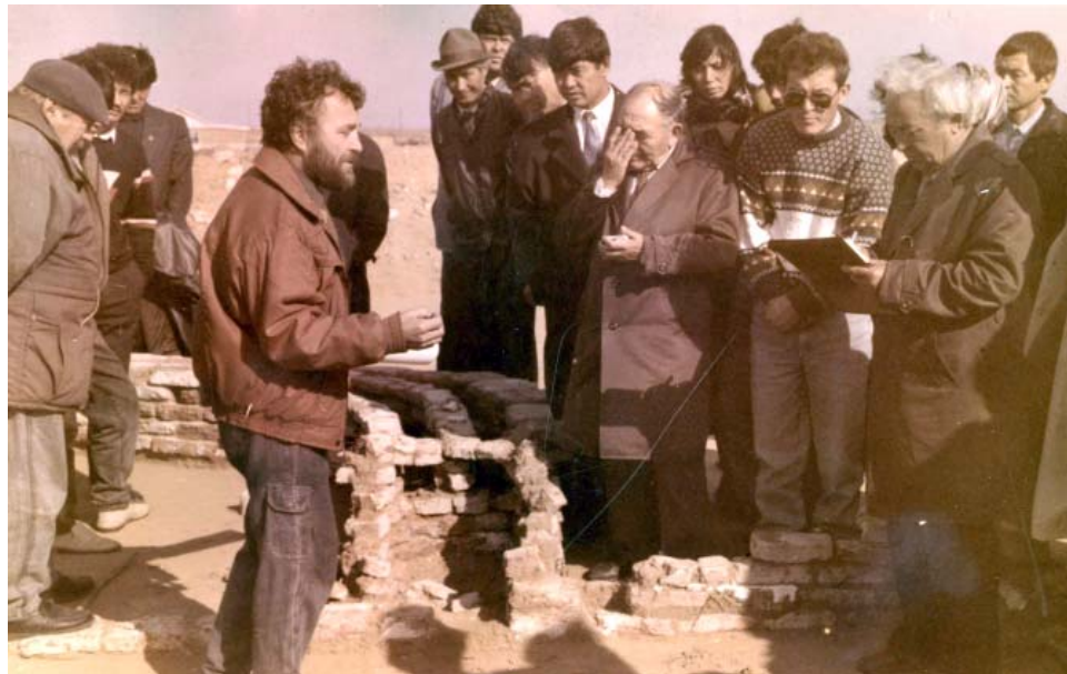
Встреча общественности Красноярского района с археологами на археологическом объекте в п. Комсомольский, 1992 г.

Дадим слово самому исследователю: «Прохладным, но ясным сентябрьским