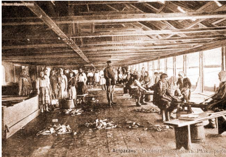
Астрахань. Рыбный промысел. Рэзка рыбы

В ту пору кинематограф в России только набирал темпы. В 1896 году питерский