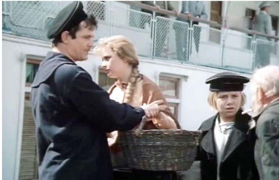
«Раннее, ранее утро»

В 1983 году зритель увидел ещё один революционно-приключенческий фильм – «Раннее, ранее утро» – вторую кинематографическую версию повести Валенти-