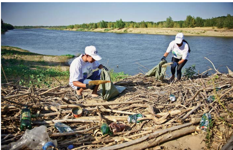
В экспедиции были очищены берега шести рукавов великой русской реки Волги