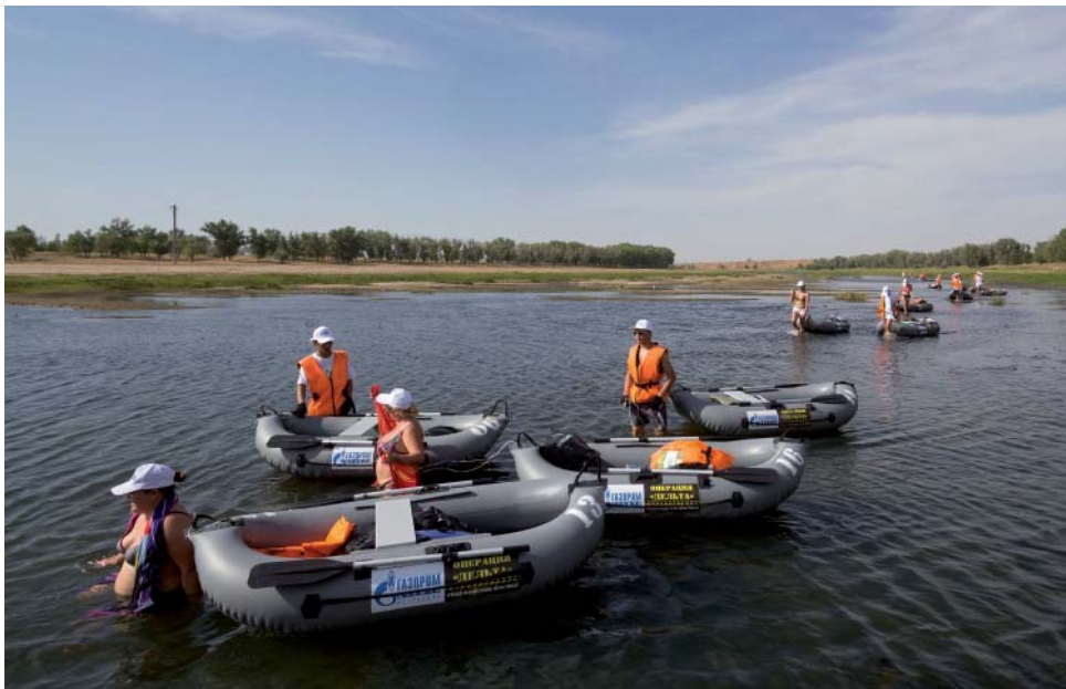
«Газпром добыча Астрахань» принял участие в очень масштабном санитарно-просветительском проекте «Операция «Дельта»: отбей нашествие пластика»