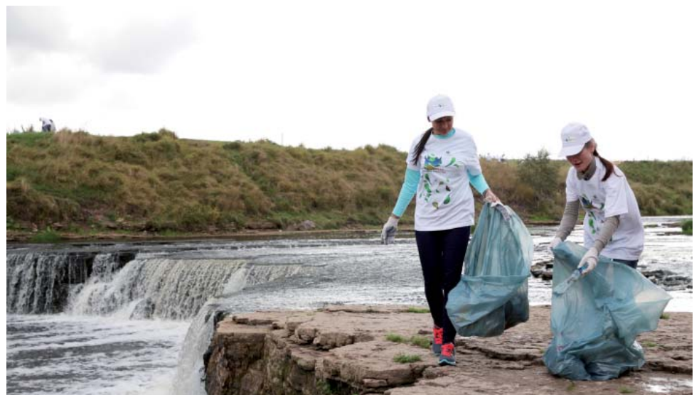
Сотрудники «Газпром трансгаз Санкт-Петербург» в заповеднике «Саблинские пещеры» у Тонненского водопада