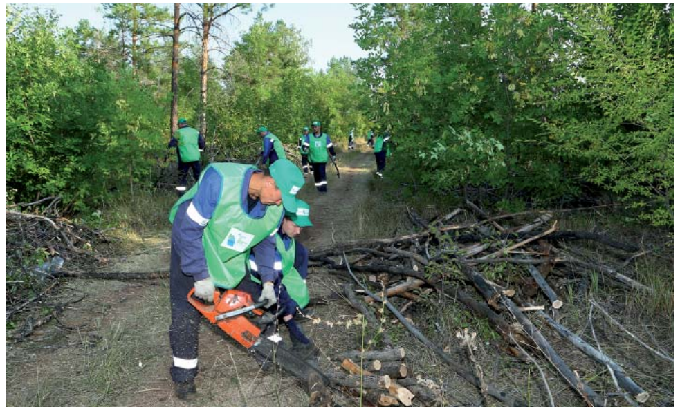
Коллектив «Газпром добыча Оренбург» в лесном массиве Оренбурга убрал валежник, сухостой, мусор, выдолбил поросль, мешающую росту деревьев