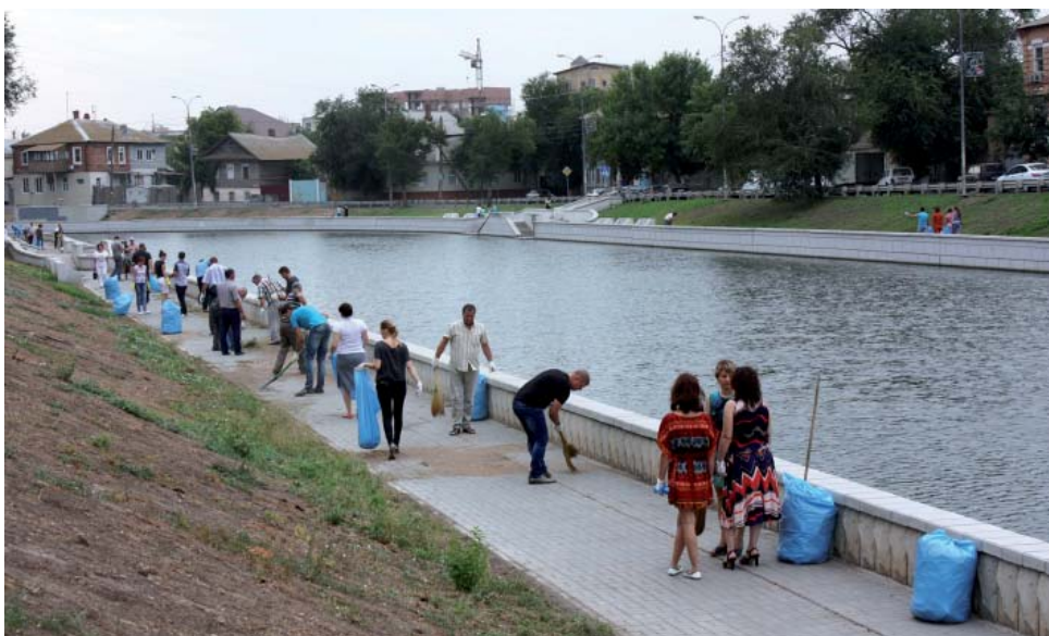
Коллектив «Газпром межрегионгаз Астрахань» на набережной городского канала

«Газпром трансгаз Нижний Новгород» провёл субботник во всех регионах своей деятельности: Кировской, Нижегородской, Владимирской, Ивановской, Костромской, Пензенской областях, Республиках Мордовия, Чувашия, Марий Эл, Краснодарском крае. Силами газовиков проведена уборка территорий, прилегающих к объектам газотранспортной системы, прибрежных зон рек и озёр, парков и скверов. Также была оказана помощь в очистке и благоустройстве территорий школ, детских садов и других социальных объектов. Площадь убранной территории составила 160 гектаров, количество собранного мусора – 155 куб. м.