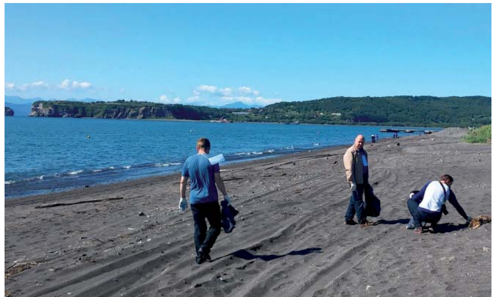
Субботник газовиков Барабинского ЛПУМГ ООО «Газпром трансгаз Томск» на уникальном озере Сартлан