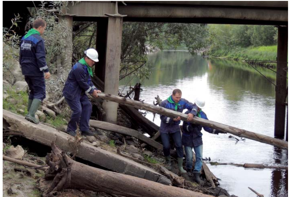
Очистка реки Пунги работниками Пунгинского ЛПУМГ ООО «Газпром трансгаз Югорск»

Сотрудники «Газпром трансгаз Казань» очистили почти 240 гектаров, убрав 90 тонн мусора.