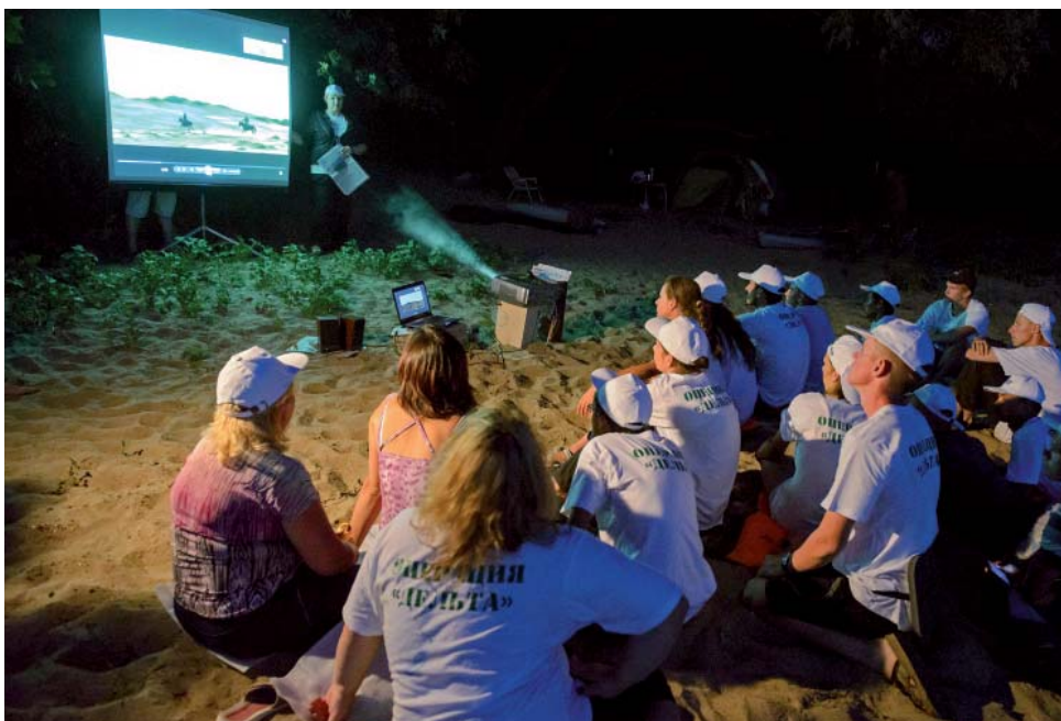
Сотрудники Музея ООО «Газпром добыча Астрахань» выезжали с лекциями на места стоянок