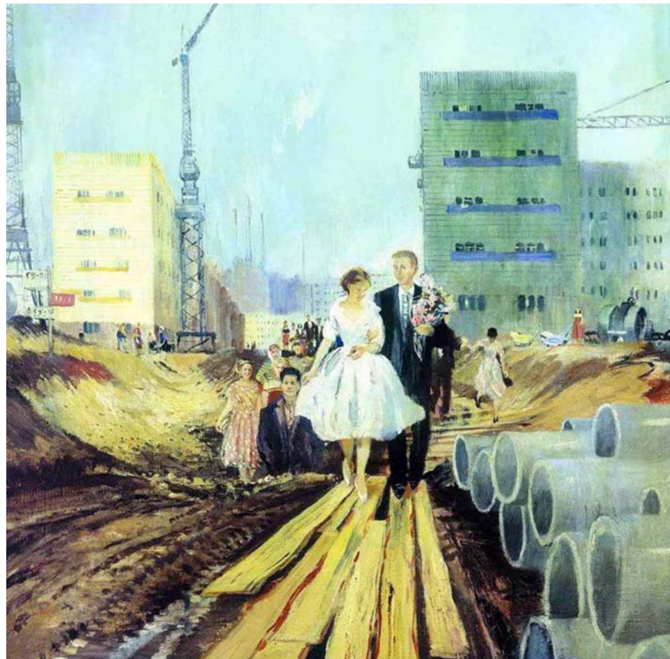
Юрий Пименов «Свадьба на завтрашней улице», 1962 г.

всего и вся привёл к открытию специализированных свадебных салонов, где в очень нешироком выборе предлагались костюмы и платья аскетичного покроя. Поэтому в моду опять вошли портные-надомники. А также тамада, которого раньше могли и привлечь за «халтуру».