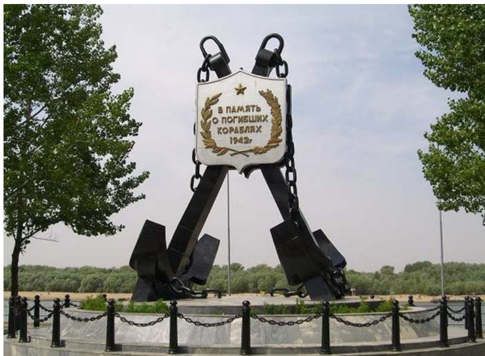
Что для памяти людской ценнее: скромный обелиск с именами односельчан, не вернувшихся с войны, как в красноярском селе Кривой Бузан (снимок слева), или монументальная композиция с «облицом посвящением» погибшим в ВОВ, как на Комсомольской набережной в Астрахани?

Живший с раннего детства в Астрахани Василий Агапкин, известный автор марша «Прощание славянки», 7 ноября 1941 года руководил сводным оркестром во время исторического парада на Красной площади.