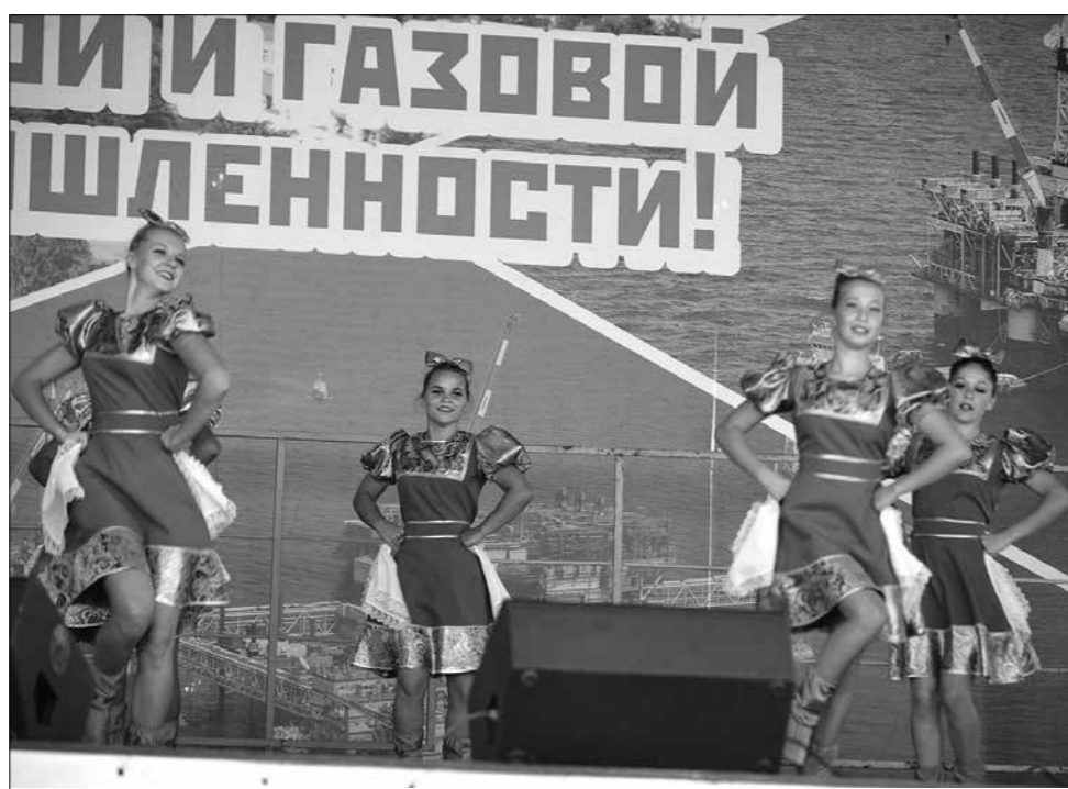
Концертная программа собрала большое количество зрителей.

Всего в 2016 году на конкурс было представлено 75 заявок от 50 детских учреждений. В результате под-