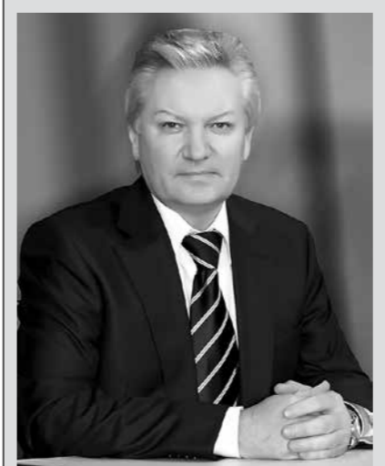
Оплачено из средств избирательного фонда Астраханского регионального отделения Всероссийской политической партии "Единая Россия".

Александр КЛЫКАНОВ, лидер федеральной списка партии "Единая Россия" по Астраханской области: