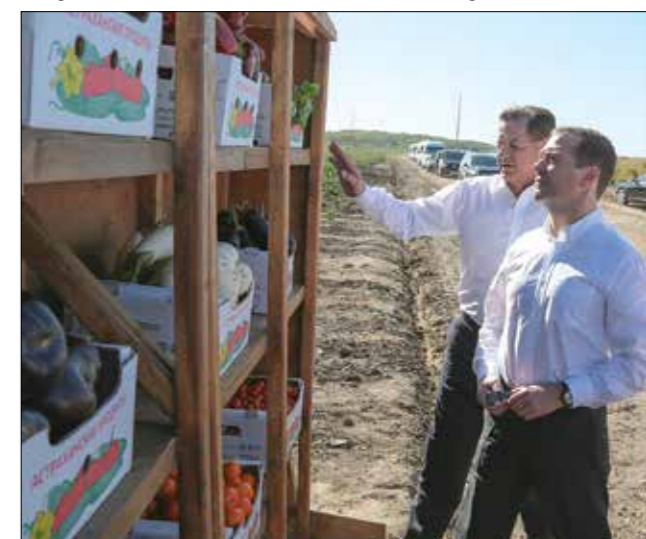
Александр Жилкин показал премьер-министру, что выращивают в Астраханской области.

Астраханскую область посетил председатель правительства РФ Дмитрий Медведев. В Приволжском районе, в оздоровительном центре имени А.С. Пушкина, премьер-министр провел совещание, посвященное развитию сельскохозяйственной отрасли страны. Участие в нем приняли руководители "аграрных" российских регионов, представители профильных министерств и организаций, некоторые – в режиме видеоконференции.